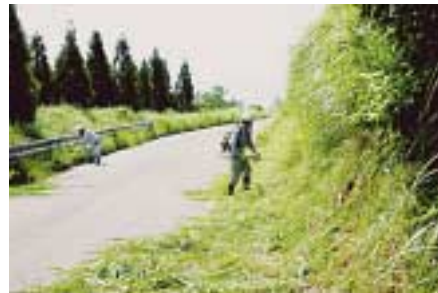
写真は中央林道西原台付近

日中の暑い中での作業でしたが、各施設等きれいに草が刈り取られ、清々しいものとなりました。