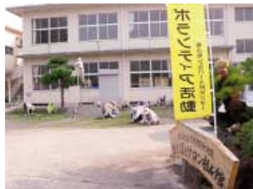
シルバー人材センターによるボランティア清掃風景 7月23日、サロン館周辺をきれいにしてくださいました