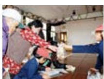
さつまあげ販売中