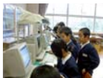
ブログで情報発信