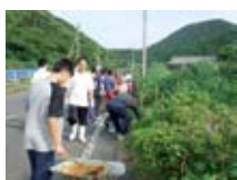
南端町づくり活動