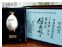
学校賞(川辺青の俳句)