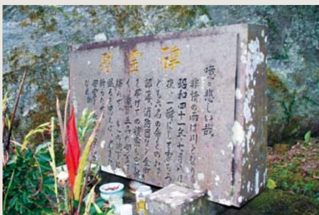
当時の集落跡に建てられた慰霊碑

43年前の7月8日に起こったこの災害は、おりしも七夕の惜別を憂う「織姫の涙」が自然の猛威となつて、被害をもたらしたのか：自然の脅威の警鐘だったのか：自然と共生する私たちにとつては、他人事ではないと感じられました。