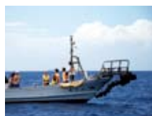
伝統ある洋上体験学習