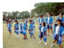
町民運動会での応援