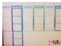
全学年特選(県作文)