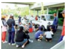
校区クリーン作戦