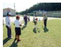
グランドゴルフ大会