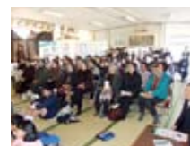
公民館での学習発表会