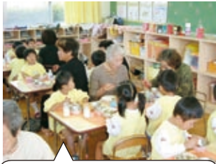
祖父母給食試食会