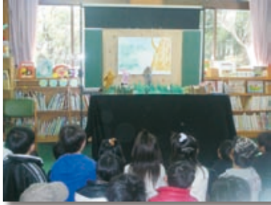
▲ 12月のおはなし会の様子

根占図書館では、毎月第3土曜日におはなし会を行っています。大型紙芝居や人形劇、ボランティアによる絵本読み聞かせなど、楽しいおはなしが盛りだくさんです。家族やお友達をさそって、みんなでおはなし会に行ってみませんか？