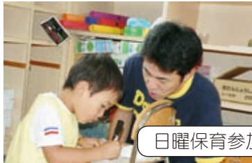
日曜保育参加 親子製作・交流