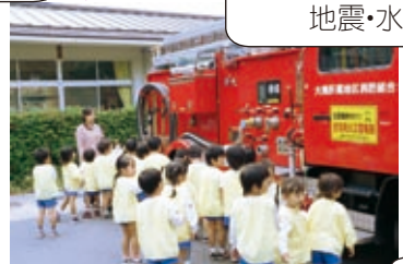
園外へお散歩…瀬脇海岸へ