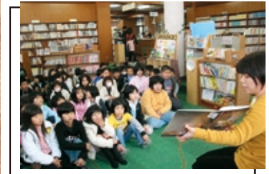
▲おはなし会の様子

お楽しみイベント！ おはなし会スタンプラリー実施 中！ スタンプ3個毎にプレ ゼントがもらえます！