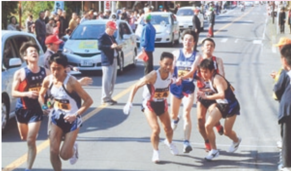
(タスキを受ける橋口君：右端)

2月24日、県下一周駅伝大会の最終5日目。根占中学校下を8時30分、南大隅町長の号砲とともに一斉にスタートしました。