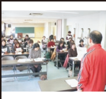
ウォーキングの説明を熱心に聞き入る参加者