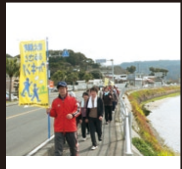
雄川沿いの景色を楽しみながら歩く参加者