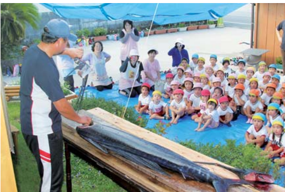
バシヨウカジキの解体に興味津々の子どもたち