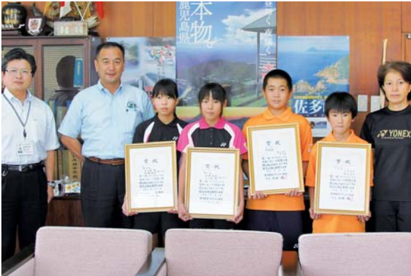
報告に訪れた子どもたち