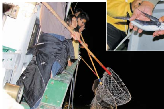
たも網をかまえてトビウオを待つ子どもたち

午後7時に間泊港から2隻の漁船で出航し、集魚灯に寄ってくるトビウオをたも網ですくいました。この日の海は波も穏やかで絶好の天候でしたが台風15号が通過した後だったせいか、数匹しかすくえませんでした。今年も昔から行われている伝統漁法を体験するよい機会となりました。