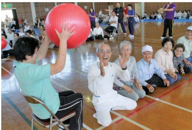
楽しく元気にプレー

老人スポーツ大会では、各地区の老人クラブ会員を中心に約560人の方が6種目で競技を行いました。参加された皆さんは、年齢を感じさせない、はつらつプレーで大会を大いに盛り上げました。