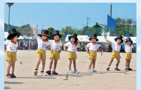
元気がかわいらしい演技やマーチングを披露し、運動会を大いに盛り上げてくれたねじめ幼稚園・根占保育園・つじみ保育園・はまゆう保育園の園児たちです。