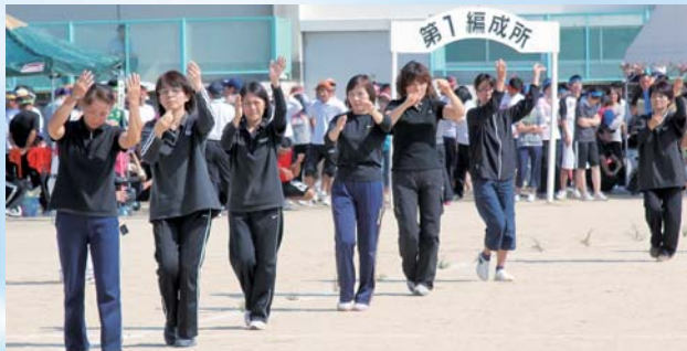
女性会の皆さんによる根占小唄と佐多音頭