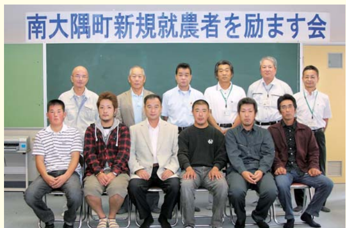
今年度認定された皆さん