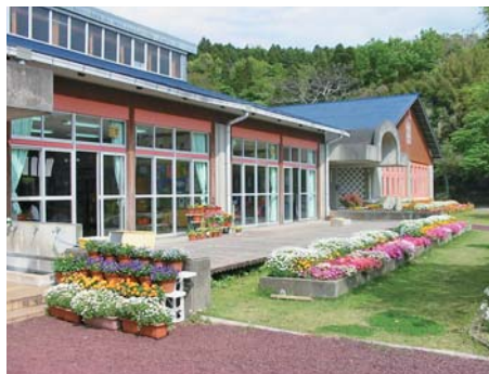
神山小（写真左）と佐多小（写真右）の校舎