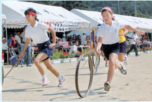
子どもたちも上手に金輪をまわしています。