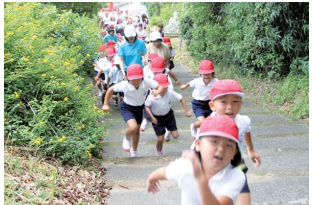
若宮神社境内に駆け上がる児童