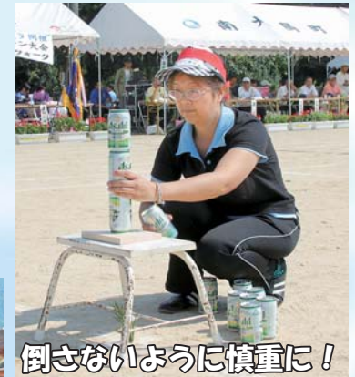
倒さないように慎重に！