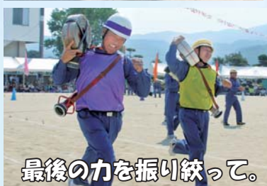
最後の力を振り絞って。