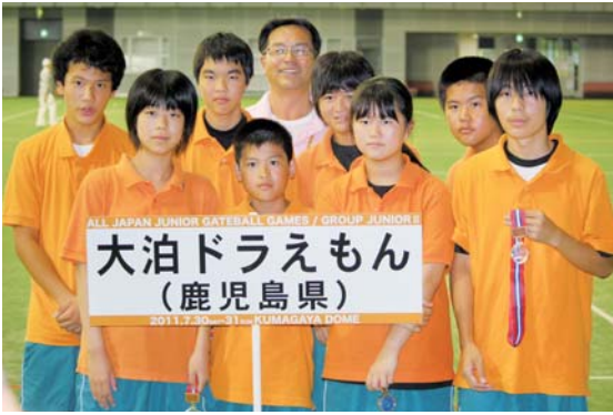
見事3位入賞を果たした「大泊ドラえもん」

予選リーグを突破し、決勝トーナメント1回戦では島根県代表を、2回戦では愛知県代表を破り、準決勝では岩手県代表に惜しくも敗れたものの見事3位に輝きました。今後の活躍を期待しています。