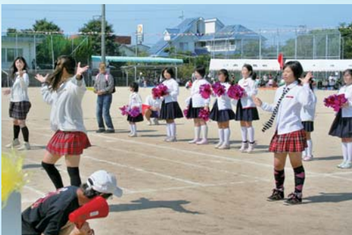
応援の部最優秀賞に輝いた大中尾・辺塚地区の応援