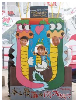
パネルと「南大隅宝モノ発掘調査隊」の皆さん

南大隅宝モノ発掘調査隊は「ふるさと雇用再生特別基金事業」で、南大隅の観光資源の掘り起こしや情報発信を行う皆さんです。