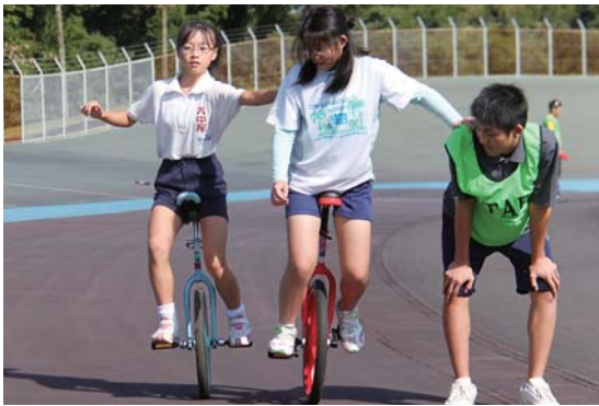
練習の成果を発揮する児童

町内外から小中学生112人が参加し、自転車競技を楽しみました。競技は、一輪車の部と二輪車の部が行われ、一輪車の部では日頃学校等で練習している成果を発揮するよい機会となりました。また、プロの競輪選手などによる模範走行も行われました。