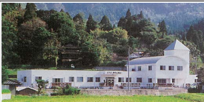
全個室(18部屋)入居費1ヶ月6~6.5万円程度