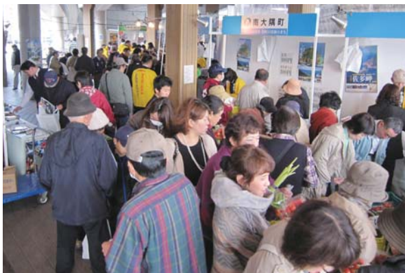
多くのお客さんで賑わう南大隅町ブース