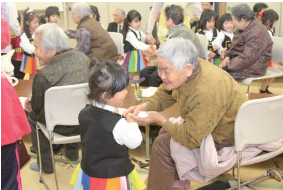
子ども達とふれあう参加者