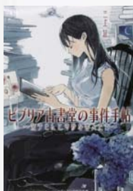
ビブリア古書堂 の事件手帖①