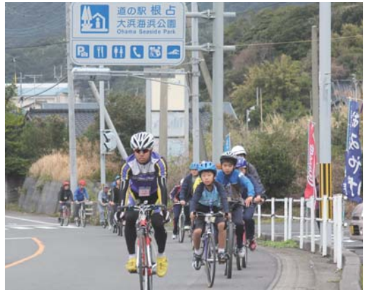
南大隅高自乗車部員による先導

3月3日、第1回南大隅町さわやかサイクリング大会が行われました。この大会は、根占〜佐多間の風光明媚な海岸線をのんびりサイクリングしようと今年初めて開催されました。