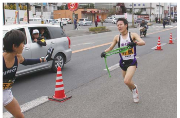
最後の力を振絞りタスキを渡す橋口選手

また、大会5日目（29日）には根占中学校下をスタートし、出場した全選手に沿道の皆さんの温かい声援が送られていました。