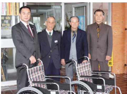
県グラウンドゴルフ協会ホールインワン基金による贈呈式

また、南大隅町グラウンドゴルフ協会では、4月1日から協会員の登録更新と新規会員の募集も行ってまいります。