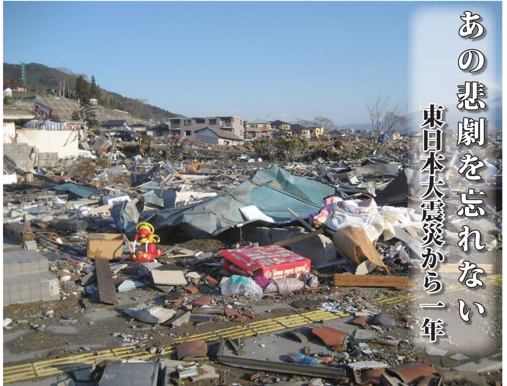
昨年4月に撮影された大船渡市内

平成23年3月11日、午後2時46分、宮城県牡鹿半島沖を震源とするマグニチュード9の大地震が発生しました。