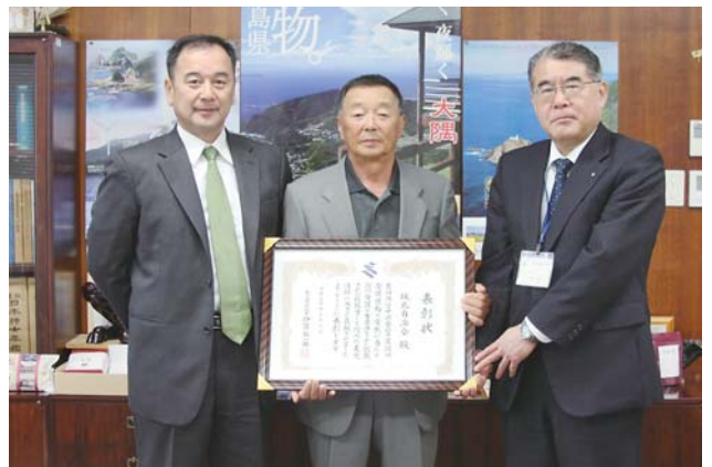
表彰された坂元自治会代表(写真中央)