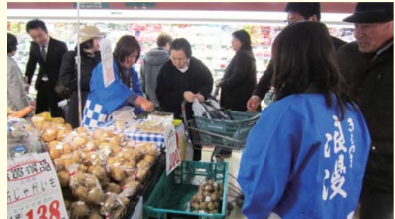
都内量販店で行ったばれいしょPR

また女性部会員5人は都内の量販店店頭において、「春ばれいしょの煮しめ」を試食品として提供し、消費者との交流PRを図りました。