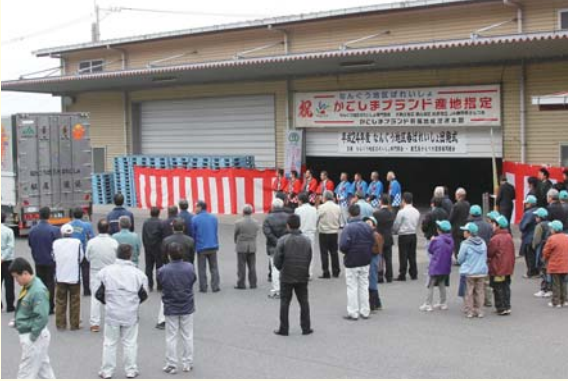
ばれいしょを乗せたトラックが関東方面へ出発