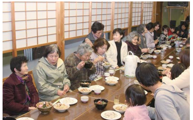
振舞われた料理をいただく女性の皆さん