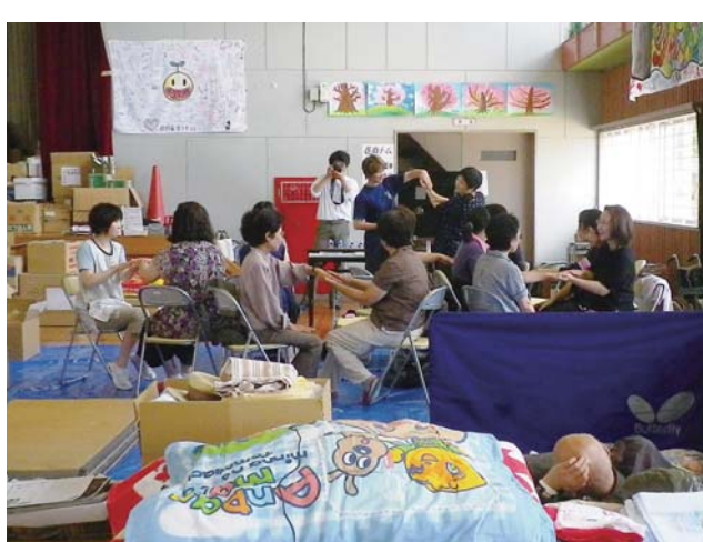
避難所のようなす (昨年6月撮影)

この地震により高さ数十mの大津波が発生し、東北地方から関東地方の太平洋沿岸部に甚大な被害をもたらしました。死者行方不明者は約2万人。まさに国難といえる未曾有の大災害となりました。