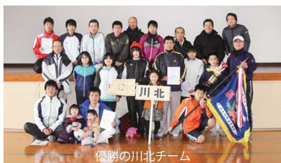
優勝の川北チーム