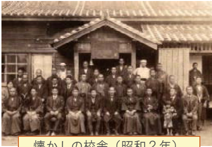
懐かしの校舎（昭和2年）

ありがとう 我が母校 ⑨ 南大隅町では、平成25年4月に小学校統合を控えています。今月の「ありがとう我が母校」は、辺塚小学校を掲載します。