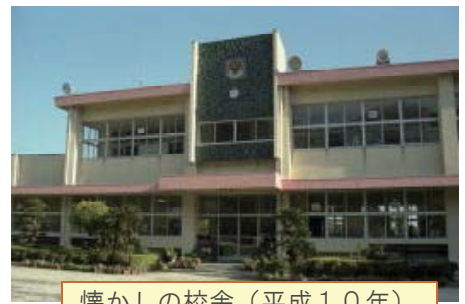
懐かしの校舎（平成10年）