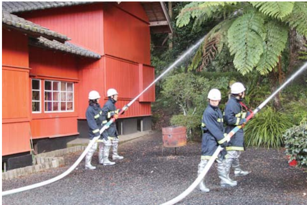
諏訪神社での訓練

文化財防火デーは、昭和24年1月26日に法隆寺金堂から出火し、国宝「十二面壁画」が損傷したことを契機に制定されたものです。