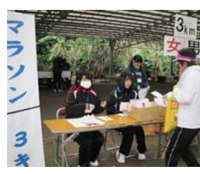
地域行事でのボランティア