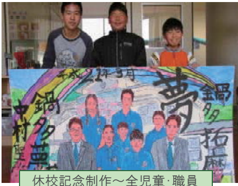
休校記念制作～全児童・職員