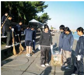
毎月の地域清掃活動

本校家庭クラブでは、ボランティアを中心としたさまざまな活動を行っています。そもそも家庭クラブとは、高等学校で家庭科を学習する生徒が組織するクラブのことをいい、学校や地域社会の改善を目指して、家庭科で学習した知識や技術を生かし、実践活動を行うものです。本校では、こうした活動を生徒みんなで積極的に取り組んでいこうと、現在「1人1回ボランティア活動参加の推進」と「ボランティアポイント制度」を導入して、ひとりでも多くの生徒に活動に参加してもらうための実践を行っています。「ボランティアポイント制度」では、1回の活動参加=1ポイントとし、年間を通じてたくさんのポイントを集めた生徒には、『感謝状』の表彰も行っています。この制度により、年間10ポイント以上集める生徒も出ています。今後も地域の高校生として、私たちの力で何かできることを、地域のために取り組んでいけたらと思います。主な家庭クラブの活動は次の通りです。