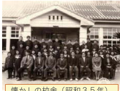
懐かしの校舎（昭和35年）