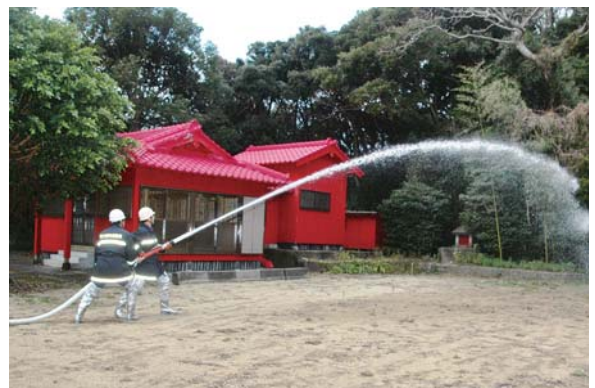
稲牟禮神社での訓練