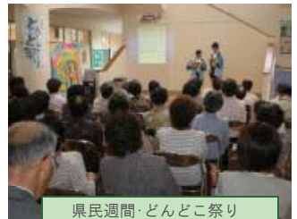
県民週間・どんどこ祭り