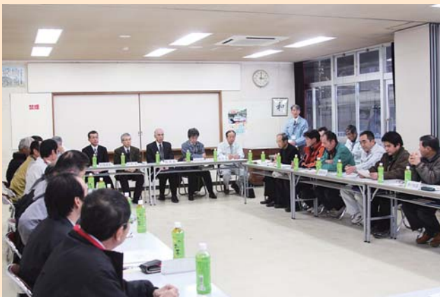
検討委員会の様子

これまで町政座談会等において地域から出された意見要望等を含めて協議検討いただきました。協議の結果以下のような活用策の意見がありました。