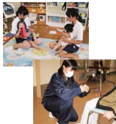
保育園・福祉体験学習