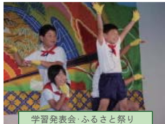
学習発表会・ふるさと祭り