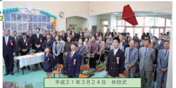
平成21年3月24日 休校式