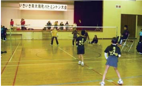
楽しくプレーする参加者

いきいき南大隅町バドミントン大会が1月13日、町体育館で行われ、小学生から一般まで118人が出場しました。大会の結果は以下のとおりです。(各クラス優勝チーム)