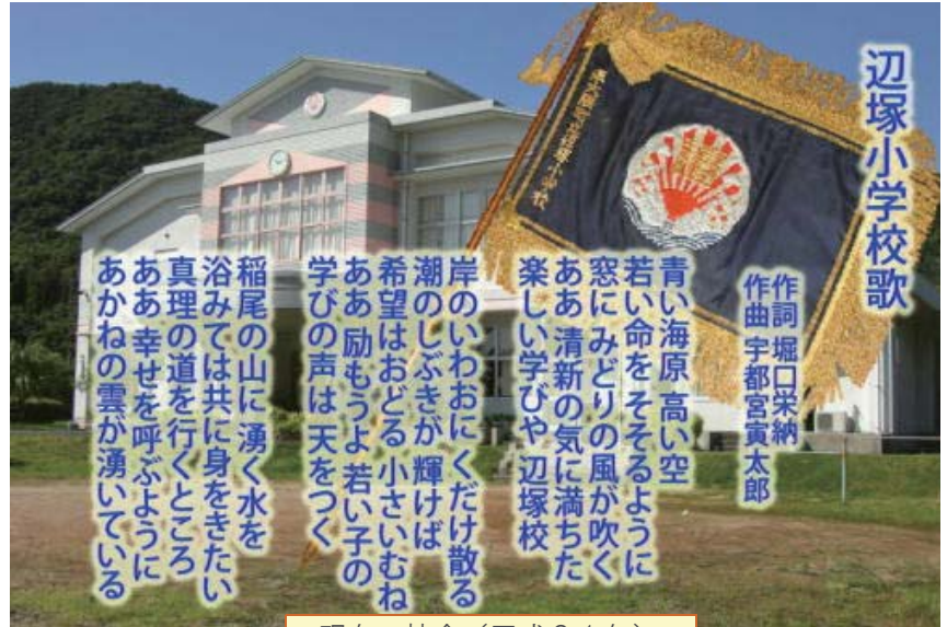
現在の校舎（平成21年）