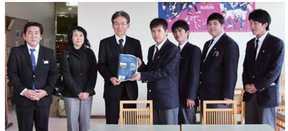
マップを手渡す南大隅高校の皆さん

南大隅高校課題研究グループの生徒が1月25日、町内の観光地などをまとめた「南大隅よかところマップ」をネッピー館・なんたん市場の指定管理者芙蓉商事に手渡しました。このマップは地域貢献の一環として“南大隅の良さをもっとアピールできないか”と作ったもので、生徒の皆さんは「マップを作ったことで自分達のふるさとの良さを再確認することができた」と話しました。作られたマップはなんたん市場などで活用される予定です。