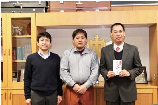
寄付金を手渡す卒業生代表(写真左から2人)

今年1月に同窓会を開催し、後輩のために何かできないかと話し合い、今回、図書購入費に充ててもらおうと寄付を行うことになりました。卒業生の皆さんありがとうございました。