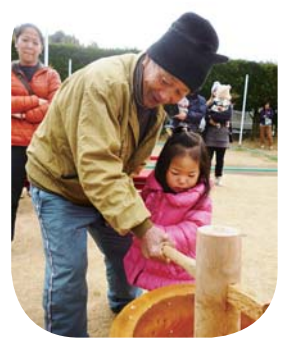
大人と一緒に餅をつく園児