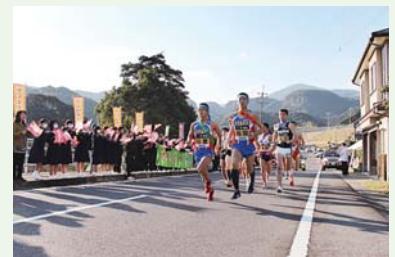
根占中下を一斉にスタート

第60回記念鹿児島県下一周市郡対抗駅伝競走大会が2月16日から20日までの5日間行われました。南大隅町からは5人の選手が肝属チームにエントリーされました。