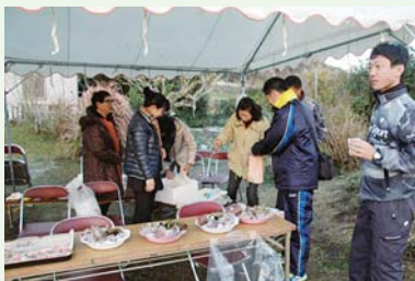
女性会の皆さんによる温かいおもてなし