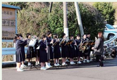
根占中音楽部による演奏