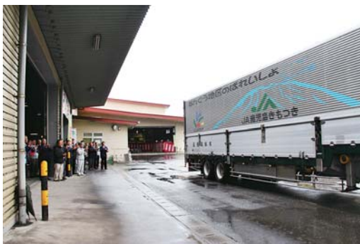
関東方面へ向けて出発するトラック

なんぐう地区のバレイショはかごしまブランドの産地に指定されており、今年は南大隅町と錦江町で204畝で栽培されています。