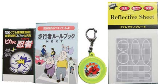
配付された交通安全対策品

近年、高齢者が当事者となる交通事故が急増しています。特に、夜間に交通事故に遭われた歩行者は夜光反射材を着用していない方々です。南大隅町では、交通事故を未然に防ぐために町内の75歳以上の方々へ交通安全対策品（反射キーホルダー、反射シート等）を配付しました。