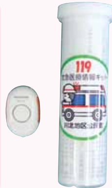
救急医療情報キット

か(感動) わ(和) き(気) た(楽しく) を合言葉に体育、文化面に地区一丸となって知恵を出し合い取り組んでいます。町内で一番大きな地区ではありますが、まとまりがあり、地区運動会等老若男女、祇園・若宮・鬼丸の対抗を楽しんでおります。少子高齢化ですが、互助共助で見守りが出来る安心安全な組織体制づくりが出来ればと思っております。