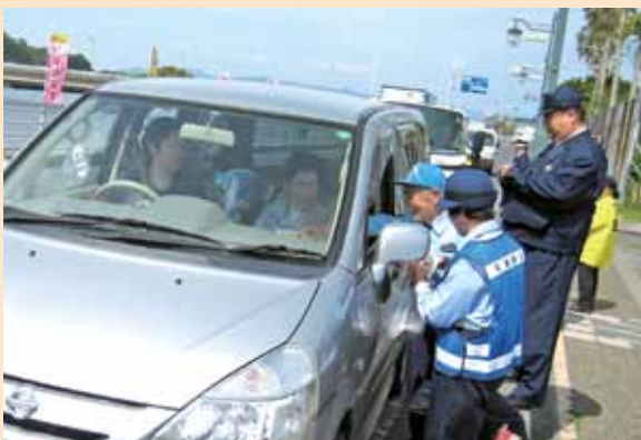
ドライバーへ交通安全を呼びかける参加者

今年に入り、県内では交通死亡事故が非常に多くなっています。運転手の皆さんは、安全運転を、歩行者の皆さんは夜光反射材の着用を心がけ、交通事故防止に努めましょう。