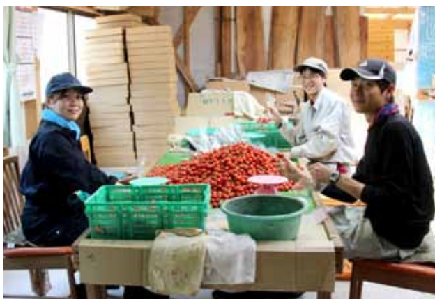
農業体験をする会員