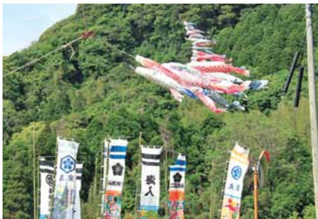
谷間を泳ぐこいのぼり

毎 年、南大隅町で行われる東京農業大学アジア・アフリカ研究会の春合宿が4月26日から5月8日にかけて行われ、同研究会21人が参加しました。この春合宿は毎年、地方の農業を学ぶ場として実施され、今年で17回目を迎えます。学生の皆さんは、農家民泊などを通して、南大隅の皆さんの温かさや自然の豊かさを感じた合宿となりました。