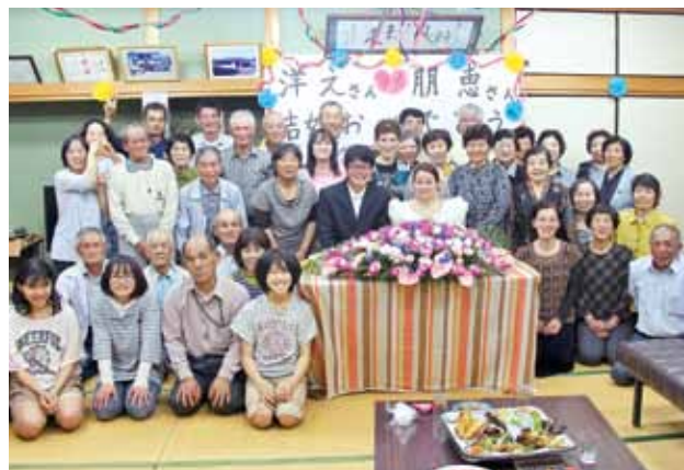
新郎新婦（写真中央）を囲む参加者

4 月末から5月にかけて、町内各地でこいのぼりが掲げられました。掲げられたのは川原自治会小川内、パノラマパーク西原台、道の駅ねじめ、瀬戸山坂、川田代自治会などで、南大隅に吹く春風に気持ちよさそうに泳いでいました。子どもの健やかな成長を願って揚げられるこいのぼりは町内外から訪れた人々の目を楽しませました。