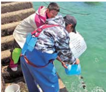
ヒラメの稚魚放流（大浜漁港と伊座敷漁港）