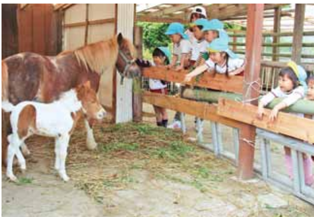
誕生した赤ちゃんポニーに声をかける園児

新入学児童の皆さんは、どの顔も晴れやかで新たな小学校生活への期待でいっぱいの様子でした。友達いっぱいになって、勉強に運動にがんばってください。