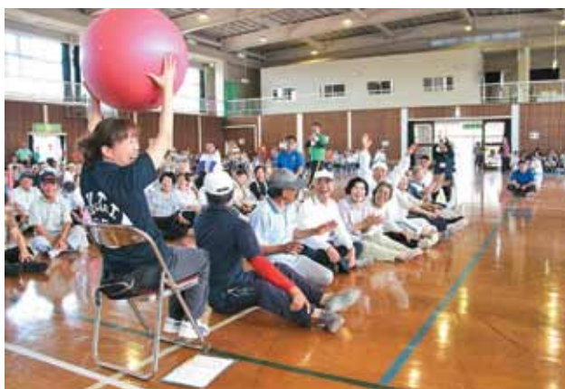
競技を行う参加者