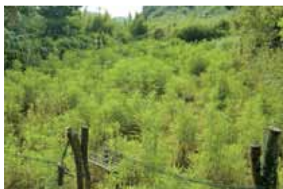
放牧前の耕作放棄地