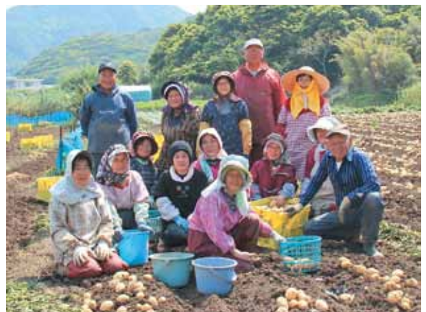
地元の担い手農家の方を中心に事業を行っています。

再生された農地で収穫されたゴマを利用し、料理教室を開催しました。地域の皆さん約40人が参加し、地域の活性化に繋がっています。