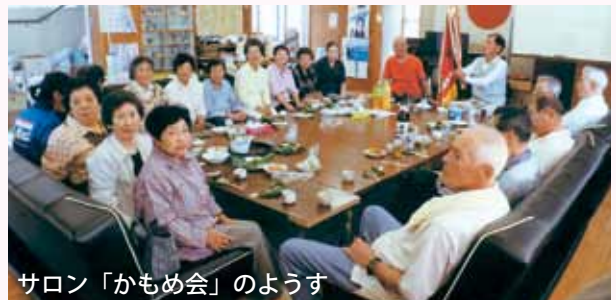
サロン「かもめ会」のようす

今年度からは、自治会長夫妻を中心に福祉アドバイザーと自治会内の見守り活動を続けていき、皆が安心して生活していけるように努力していきます。