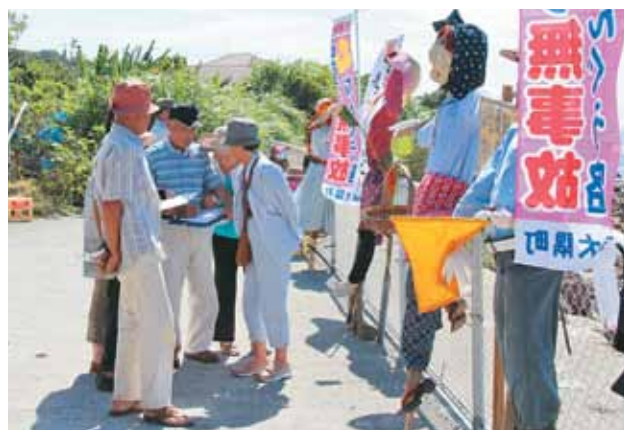
かかしの審査を行う参加者