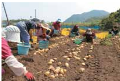
放牧後、農地として再利用し、バレイショやゴマなどの作付けを行っています。

で大泊地区の耕作放棄地約1.6ヘクタールが解消されました。 この事業は鹿児島県内でも初めての取り組みとなっております。町では今後もこの事業を継続し、耕作放棄地の解消、鳥獣被害対策に取り組んで行きたいと考えています。