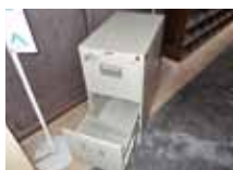
キャビネット (袖型)