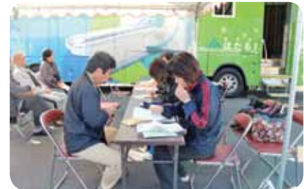
ヘリカルCTコーナー