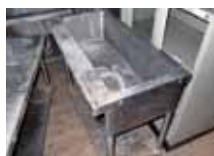
ステンレスシンク