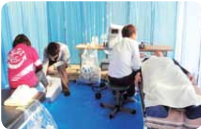
頸動脈エコー・骨密度検査コーナー