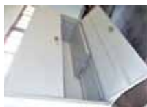
キャビネット (立型)