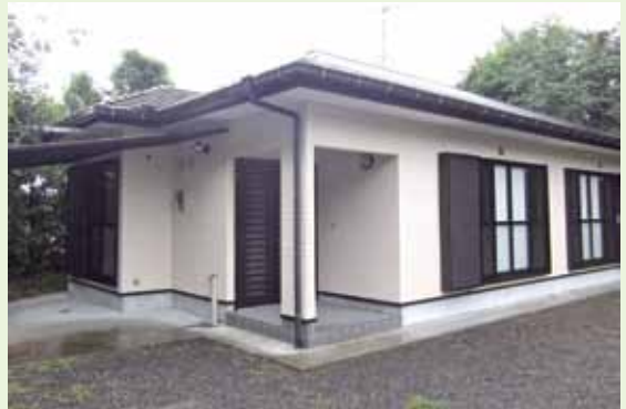
旧滑川小校長住宅

○申込者にはこの他、条件があります。必ず役場にて売却条件を示した要項をご覧ください。