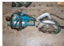
電気カンナ・ノコ