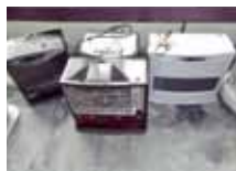
ストーブ・ファンヒーター