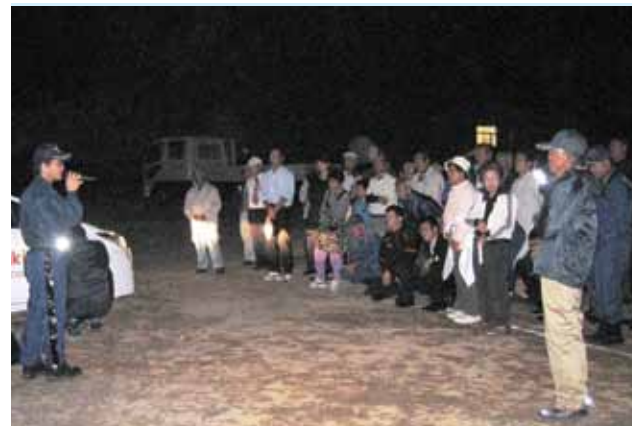
ライトの説明を受ける参加者