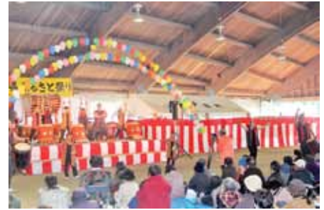
ねじめ太鼓によるステージ発表