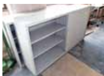
キャビネット (横大)