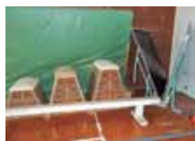
とび箱・平均台・卓球台