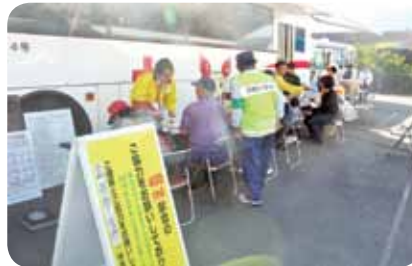
献血・健康診査コーナー