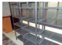
スチール製整理棚