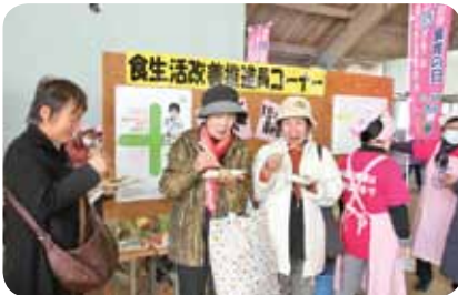
健康食試食コーナー