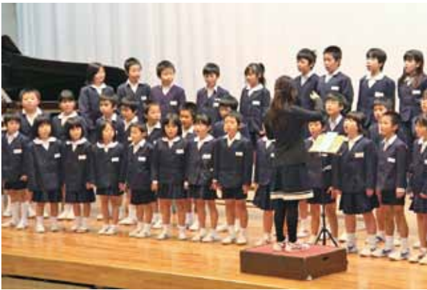
元気いっぱいの歌声を披露する児童