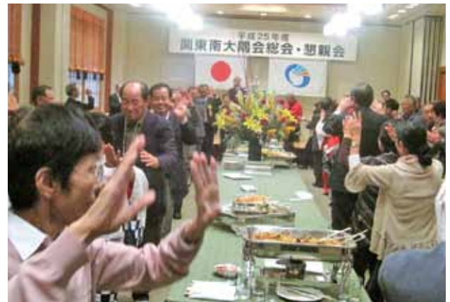
会の最後に行われた総踊り

また、音楽会の後には鹿児島交響楽団のコンサートも行われ、オーケストラの生演奏を楽しみました。