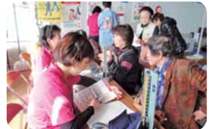
健康相談コーナー