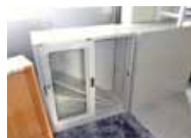
キャビネット (書棚)