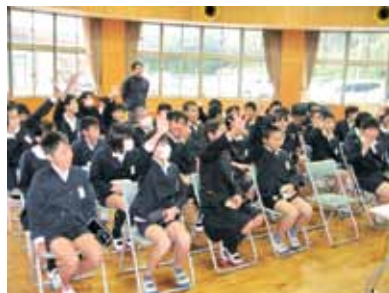
神山小学校での租税教室

税の仕組みや必要性について理解してもらうために、神山小・佐多小で租税教室を実施しました。