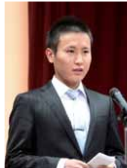
所信表明 橋口さん