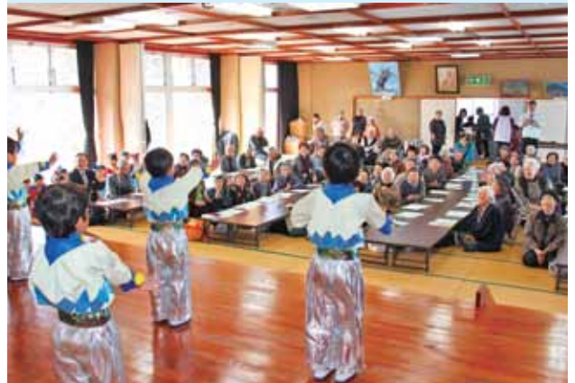
保育園児による遊戯の披露