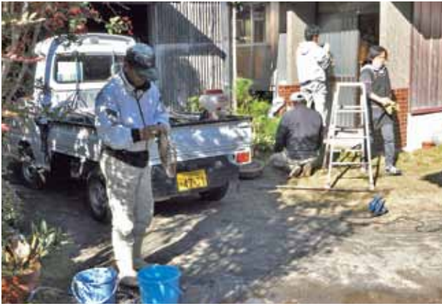
清掃作業を行う隊員の皆さん