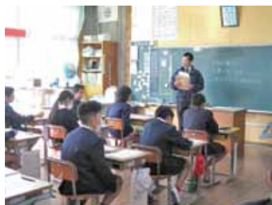
佐多小学校での租税教室

子どもたちは、「税金の大切さを知って、大人になったら町のため、国のため、自分のためにもしっかりと税金を納めたい」などと話していました。