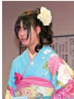
記念品受領 薬師さん