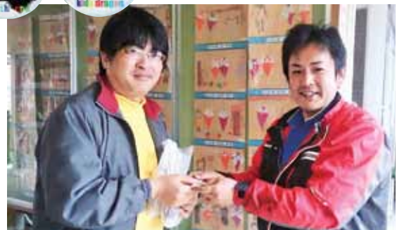
缶バッジを根占保育園長（左）に手渡すメンバー（右）