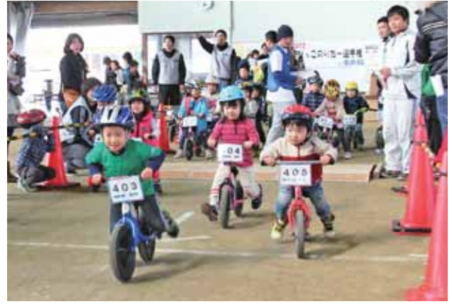
ランニングバイクで一斉にスタートする子ども

川原見守り隊24は隊員12人で高齢者が困った時の支援を24時間、24の瞳で見守ることを目的に結成されました。