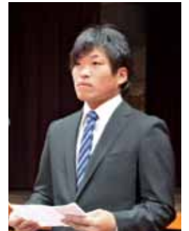
所信表明 桑田さん