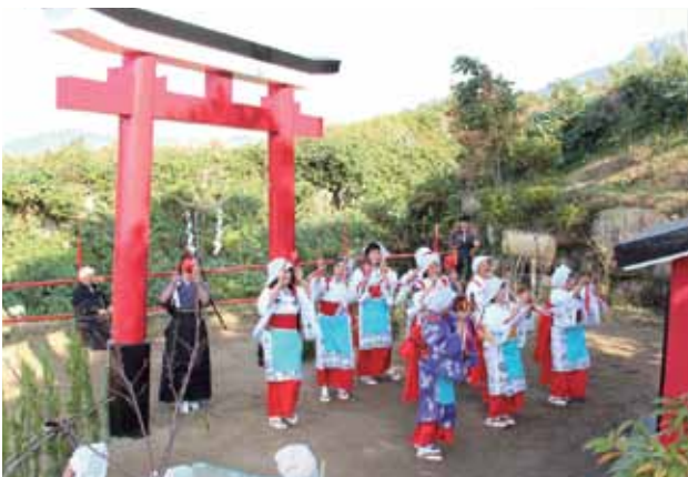
地元女性による木遣り踊りの奉納