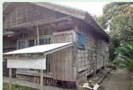
旧公営上之園住宅