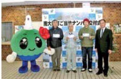
1月7日に行われた交付式

税務課では引き続きご当地ナンバーの交付を受け付けています。ご希望の方はお問い合わせください。