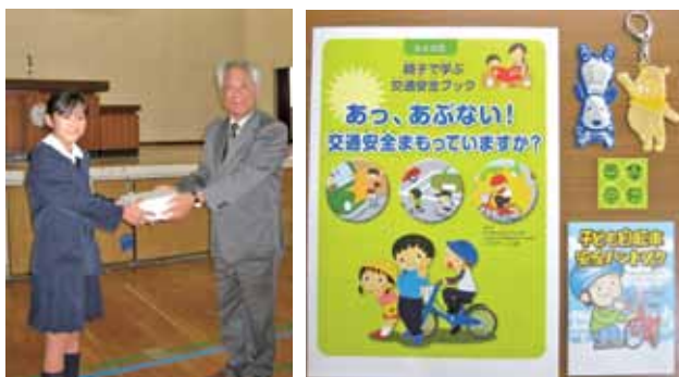
神山小での贈呈式(左)と配付した交通安全対策品(右)