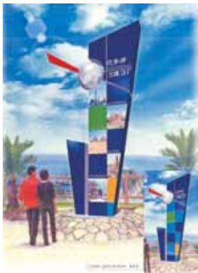
優秀賞 広島県 タカオ株式会社様