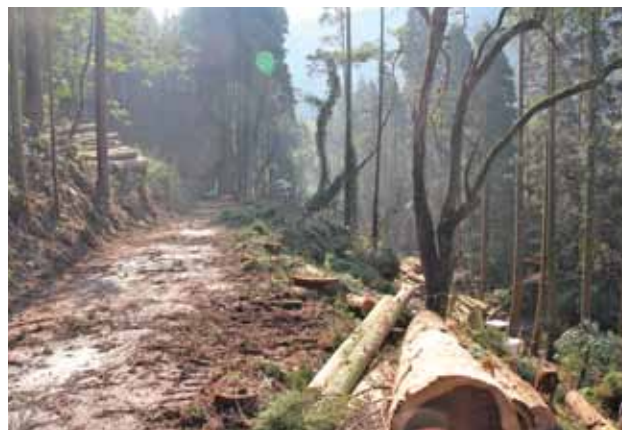
立木伐採が進む道路