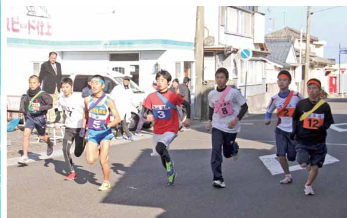
一斉にスタートする1区のランナー