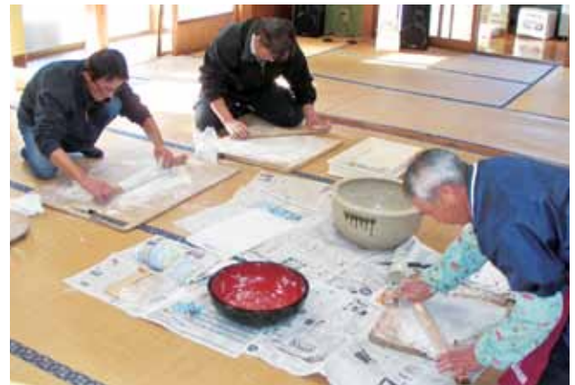
食事の準備をする男性陣