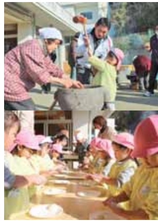
ねじめ幼稚園の様子