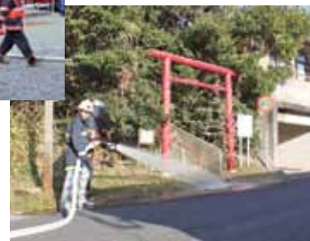
津柱神社での訓練