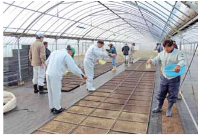
県本土トップを切って行われた種まき

は まゆう保育所で1月18日、ねじめ幼稚園では1月24日にもちつき会が行われました。もちつき会には町社会福祉協議会「おおくす会」の協力をもらい、園児や保護者、地域の高齢者などが参加しました。園児のみなさんは大人の手を借りて、「ヨイショ、ヨイショ」の掛け声をかけながら餅をつきました。つきあがった餅はみんなでおいしくいただき、楽しい一日となりました。またはまゆう保育所では花壇整備も行いました。