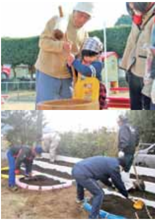
はまゆう保育所の様子