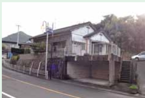
佐多小旧教頭住宅

入札を希望される方は必ず、契約条項を閲覧してください。この物件には最低売却価格が設定されています。契約条項に記載してあります。