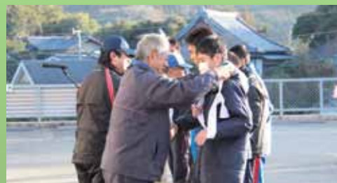
1区のランナーにたすきかけられました