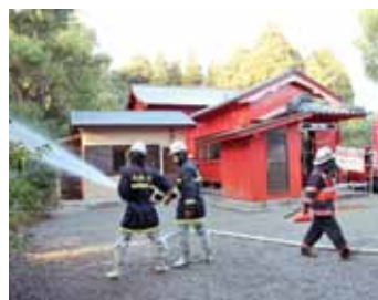
若宮神社での訓練

また、交通安全対策品の中には、交通安全絵本やリーフレット等もあります。ご家庭での交通安全指導に活用するなど家族みんなで交通安全に取り組みましょう。*配布物は各学校や年齢階層によって異なります。