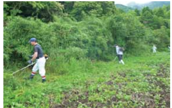
草払いによるヤブの解消