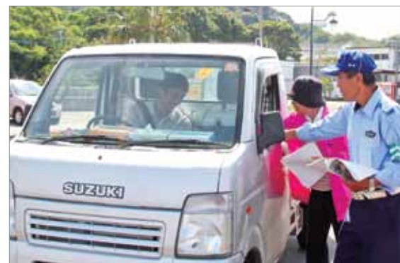
ドライバーへ安全運転を呼びかけました

7月18日、夏の交通事故防止運動に伴う街頭キャンペーンが根占・佐多両地区で実施されました。この日は、町交通安全協会、交通安全協力員、交通安全母の会の方々が参加され、錦江警察署、県交通安全協会錦江地区協会の協力のもと、チラシ等を配りながら、ドライバーへ安全運転を呼びかけました。一人ひとりが交通ルールを守り、事故の未然防止に努めてください。