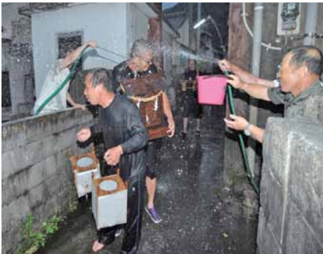
水をかけられながら、ご神体を運ぶ一行