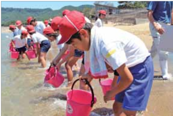
マダイの稚魚を放流する児童

また、佐多地区においても、尾波瀬・上之園地先へ約27,000尾が放流されました。