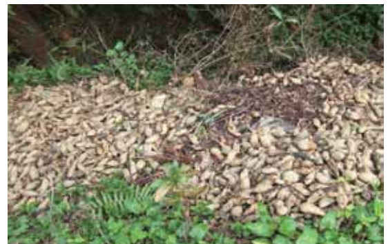
収穫の残りを放置しない