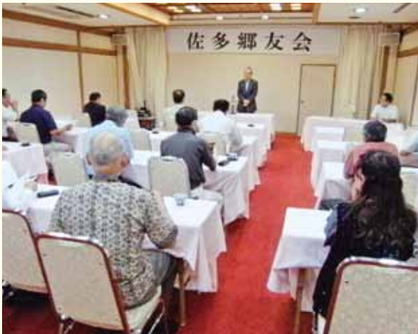
佐多郷友会総会の様子 (7月5日)

過疎高齢化で、色々なところで弊害が生じております。しかし、そこに生活されておられる方々は、暮らして行かなければなりません。少しでも手助け出来ることがあればと、心がけていきたいと思います。