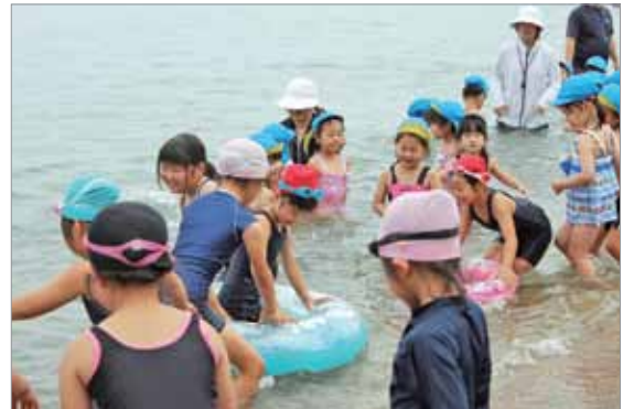
海水浴を楽しむ子どもたち

当日は、あいにくの曇り空でしたが、子どもたちは待ちわびた海水浴を楽しんでいました。