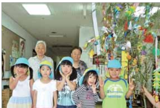
真寿園に贈られた七夕飾り