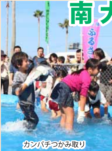
カンパチつかみ取り