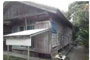
旧公営上之園住宅