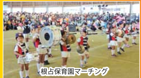
根占保育園マーチング