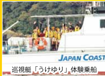
巡視艇「うけゆり」体験乗船