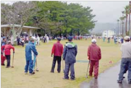
肝属地区グラウンドゴルフ大会の様子

本町からも17チーム、85人が参加し、他の協会会員と親睦を深めながら日頃の練習によって習得した技術を競い合いました。