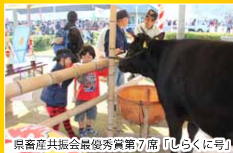
県畜産共振会最優秀賞第7席「しらくに号」