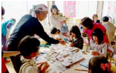
歯科用石膏でのキーホルダー作成