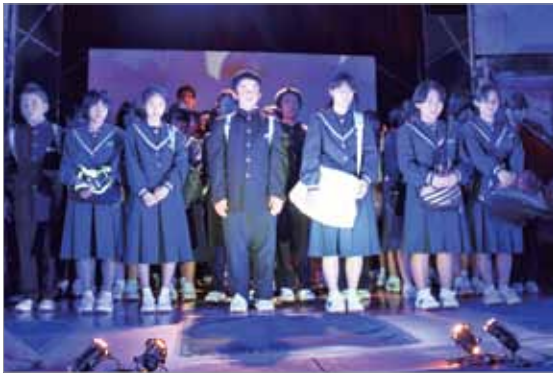
劇団員と共演する第一佐多中の生徒