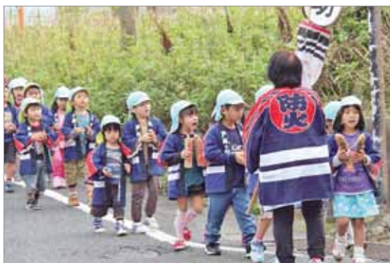
はまゆう保育所の幼年消防クラブ

11月9日から15日まで全国秋季火災予防運動が実施されました。本町でも11月10日と11日に、はまゆう保育所と根占保育園の園児による幼年消防クラブ防火パレードが行われました。園児の「火の用心、良い子は火遊びしません。心で用心、目で用心。」という大きな声が商店街で響いていました。火災の発生しやすい時季を迎えました。火の用心をお願いします。