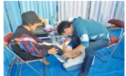
頸動脈エコー検査