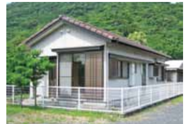
旧辺塚小校長住宅