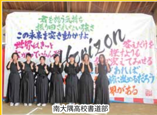
南大隅高校書道部