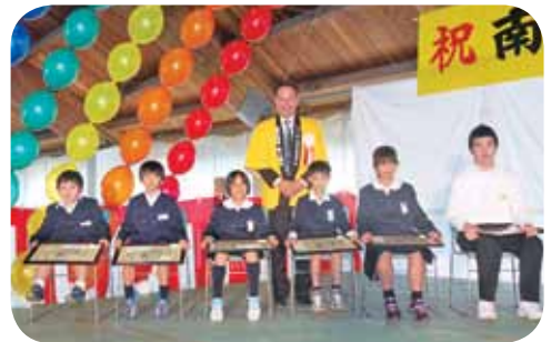
表彰された児童・生徒