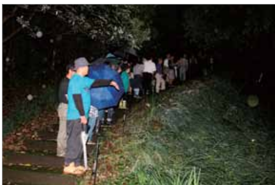
幻想的なホタルの乱舞を楽しむ見学者

当日は雨が降り、ホタルが舞うか心配されましたが、夜が更けるにつれ、徐々にホタルが乱舞し始め、見学者は幻想的な光を堪能しました。