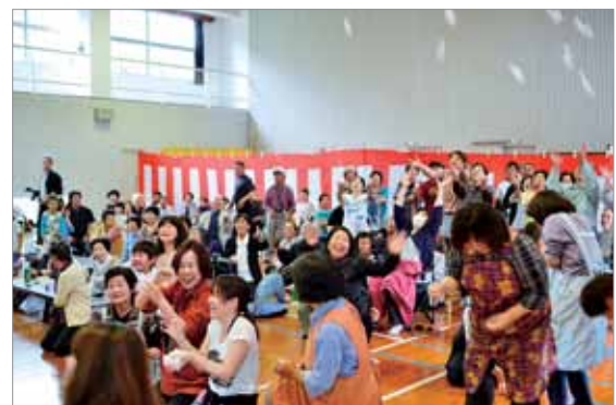
辺塚まつりでの餅まきの様子

辺塚地区は総人口約180人の小さな地区ですが、地域の皆さんが、地域を盛り上げようと努力されており、この祭りは今年で30回を数えます。