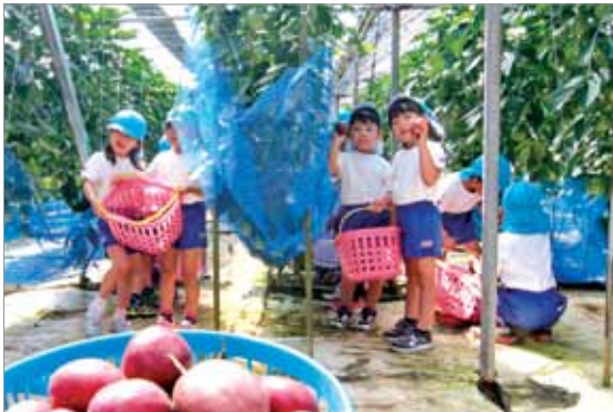
パッションフルーツを採集する園児