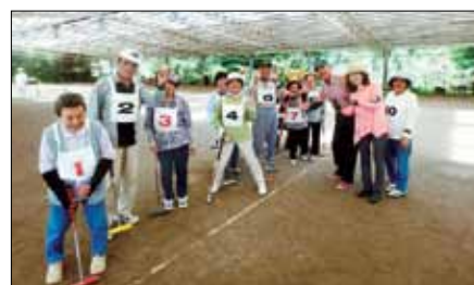
チャレンジ杯ゲートボール大会