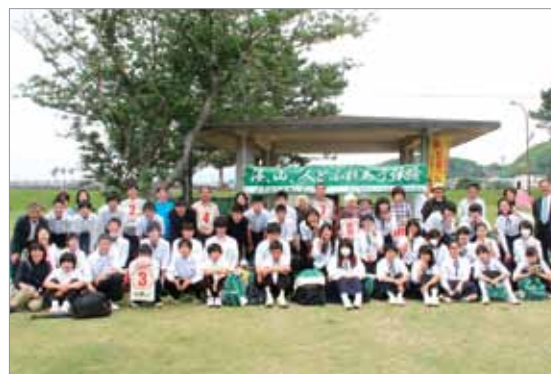
奈良県平群町立平群中学校3年生の皆さん

生徒の皆さんは、3～4人のグループに分かれ、町内12組の受入家庭に民泊し、最南端の田舎暮らしを体験しました。