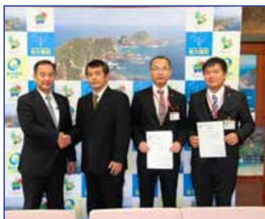
森田町長と協定を締結した3人の郵便局長

この協定は、災害発生時において郵便局が業務中に発見した被害状況を災害対策本部へ提供していただくことや避難所への郵便箱設置などの協力について定めたものです。