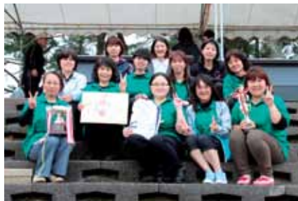
レディースの部優勝：町二レディー