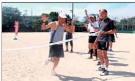
42.195km リレーマラソン完走