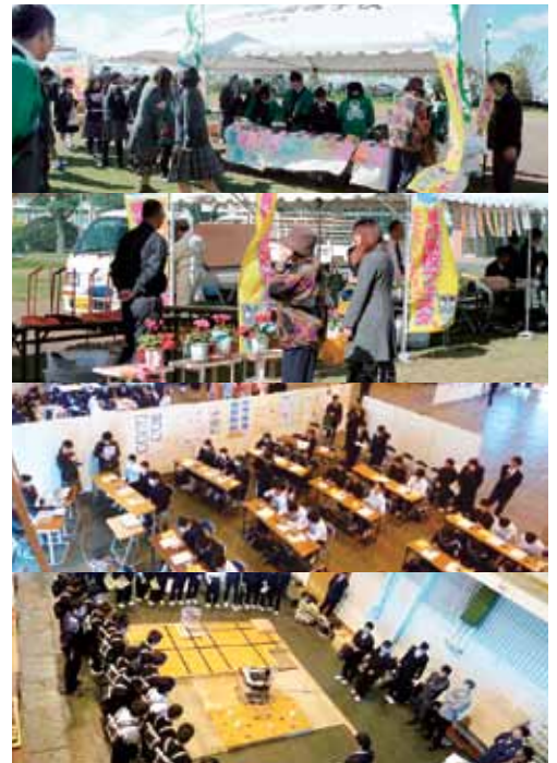
▲昨年度の専門学校フェスタの様子

南大隅高校 鹿屋農業高校 鹿屋女子高校 鹿屋工業高校 串良商業高校 末吉高校 曾於高校 岩川高校 垂水高校 尚志館高校 が集結します!