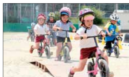
ちびノリダー体験教室