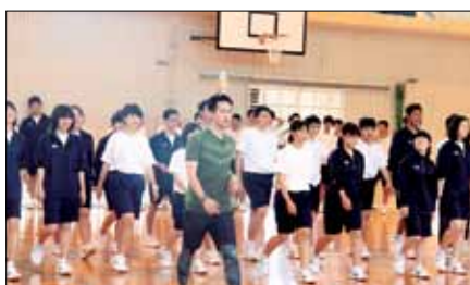
ウォーキングトレーニング（南大隅高校）