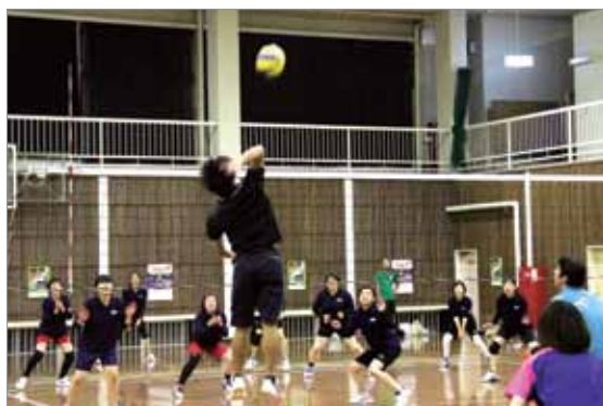
町職域バレーボール大会の様子