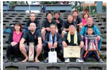
一般の部優勝：町一自治会