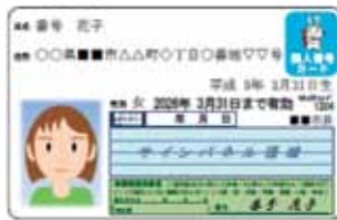
個人番号カード 表面(案)