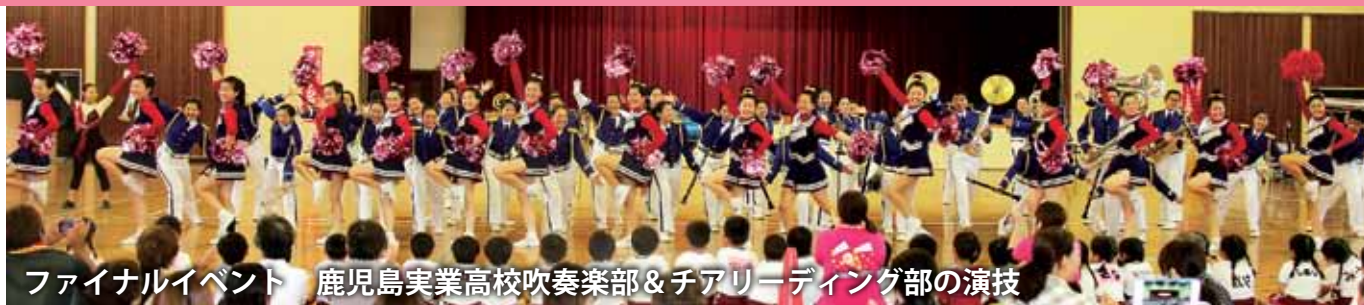
ファイナルイベント 鹿児島実業高校吹奏楽部&チアリーディング部の演技