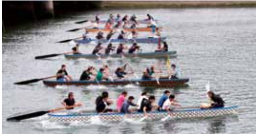
レディー GO! スタート

5月24日、第11回みなみおすみドラゴンボート大会・おすみドラゴンボート大会・ジュニアドラゴンボート大会が雄川河畔で行われ、全22チームが熱戦を繰り広げました。特に、一般の部の決勝レースは、町一自治会と丸峯やろう会式の組がほぼ同時にゴールし、結果発表があるまで、どちらが勝ったか分からない白熱したレースとなりました。岸からも多くの声援が送られ、大会は大いに盛り上がりました。