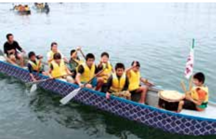
ジュニアの部優勝：瀬脇子ども会