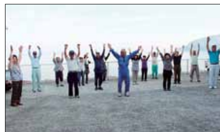
早朝のラジオ体操（原自治会）