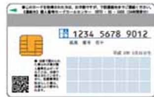
個人番号カード 裏面(案)