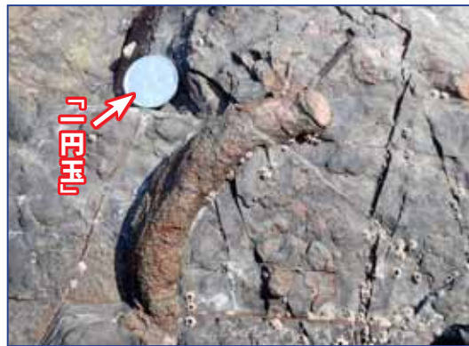
写真1 竹之浦の海岸で見られる生物の棲家の化石

海の底の砂泥であったことの証拠として、例えば塩入海岸の岩や佐多岬周辺の岩には、ゴカイなど海底で暮らす生物の棲家(すみか)の化石が見られます。(写真1)