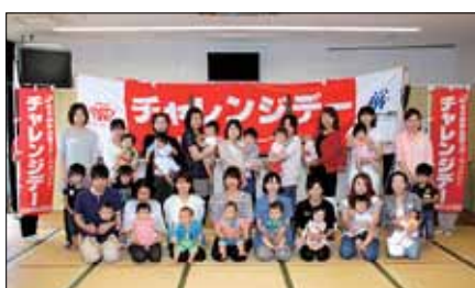
はいはい・ニコニコレース出場の皆さん