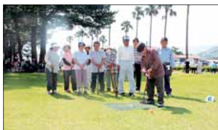
チャレンジ杯グラウンドゴルフ大会