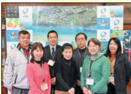
包括支援センター職員