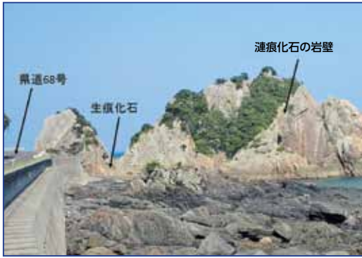
写真1：竹之浦海岸 （化石が見える場所）

立目崎から佐多岬を通り佐多辺塚海岸にかけて、約4,000〜2,200万年前の付加体の岩石が露出しています。（2015年1月号参照）このうち竹之浦海岸（竹