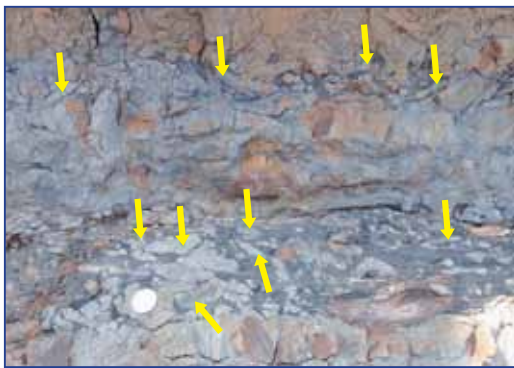
写真3：生痕化石②（矢印部分）