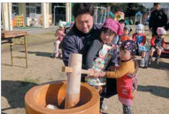
はまゆう保育所での餅つき会