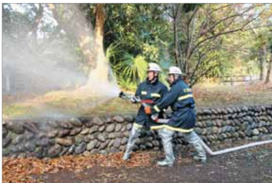
佐多旧薬園での防火訓練の様子