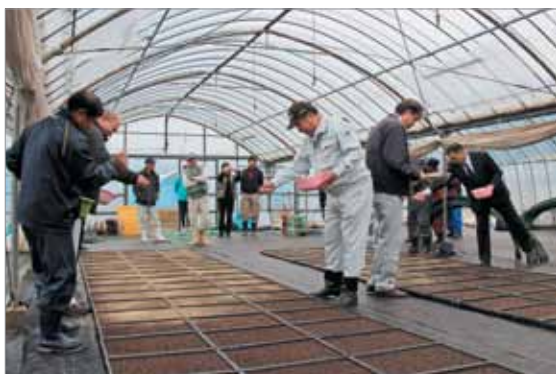
県本土トップを切って行われた種まき

現在、町内6戸の農家が10ヘクタールで栽培しており、3月上旬に田んぼに定植します。