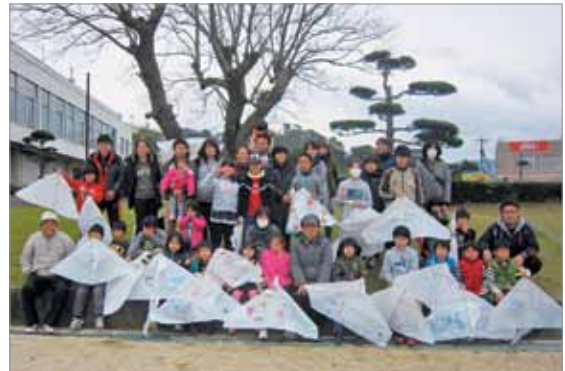
たこあげ会に参加した親子

子どもたちは、社会福祉協議会おおくす会会員の指導を受けながら、約1時間かけて手作りのたこを完成させ、運動場でのたこあげを楽しみました。空高くたこをあげようと、子どもたちは一生懸命運動場を走り回っていました。