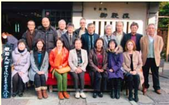
旧大泊中学校昭和43年度卒業生の皆さん

た。文字通り子どもに戻って、楽しみました。1日目の宴会が終わったのは深夜でした。小学生から1クラスしかない地域でした。級友は人生の大切な時間を共に過ごしたかけがえない存在です。わずか2日間でしたが、一緒に過ごすことで、自分が鹿児島の人間、佐多の間であることを改めて体感することができました。目の前に地元の壮大な海が広がった気がしました。元気でいるうちは、年に1度は皆で集まり、人生の集大成とも言える大切な時間を再び共に過ごしたいと思っっています。来年は参加できなかった人にも参加してもらい、2回目の同窓会を開く計画です。