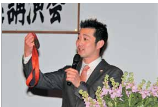
銅メダルを手に講演される宮下氏

講師は、2008年北京オリンピック競泳男子400mメドレーリレーの銅メダリストで、現在スポーツキャスターとして多方面でご活躍中の宮下純一氏で、「挑戦すれば何かが変わり、チャンスが訪れる」、「自分を変えてくれるのは隣の人かも。出会いを大切に」と話してくださいました。