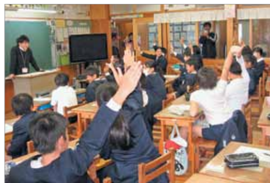
神山小での租税教室の様子

子どもたちは、「税金の大切さが良く分かりました。大人になったらしっかりと税金を納めます」と話してくれました。