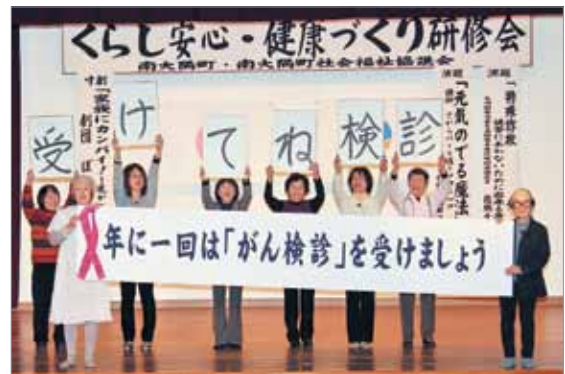
がん検診受診を呼びかける劇団「ぼっけもん」

研修会では、乳がんを克服した家族を描いた寸劇や講演が行われ、家族や地域の支え、検診受診の大切さを痛切に感じました。