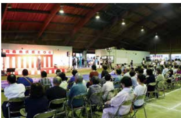
ふれあいドームでの夏祭りステージ

会場の根占ふれあいドームでは、ねじめ太鼓楠龍の演奏、南大隅高校書道部のステージショー、楊心門の空手演舞、カラオケ大会の上位入賞者の歌声や舞踊・民謡など、多くの出演により、ドーム内は、盛り上がり夏の夜を満喫しました。