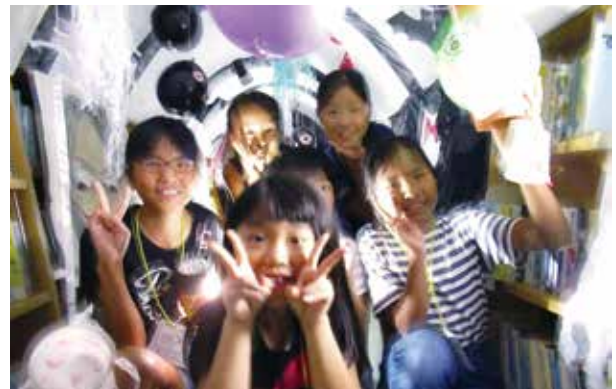
根占図書館内を楽しく探検する参加者

参加者はうす暗い館内を地図を手に探検し、ヒントを手掛かりに目的の本を探したり、間違い探しやクイズをしたり、ミッションをひとつずつクリア。館内は、おばけの登場でびっくりする子どもたちでにぎわい、いつもと違う図書館の魅力を楽しみました。