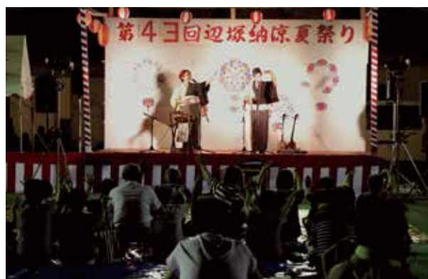
ステージと会場が一体となった島唄ライブ

雨が心配されましたが、花火も盛大に上がりました。ステージでの島唄ライブや、輪になった盆踊りでは会場が一体となり、多くの来場者は辺塚の夏祭りを楽しみました。