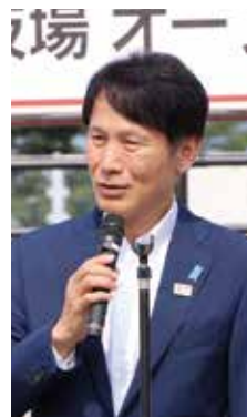
主催者挨拶 鹿児島県知事