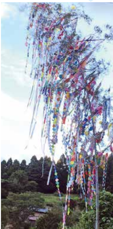
最優秀賞の住宅自治会

8月7日、佐多校区民会は、約15年続いている「佐多校区民会七夕コンクール」を開催しました。11自治会が参加し、各自治会の公民館などに七夕飾りを設置しました。