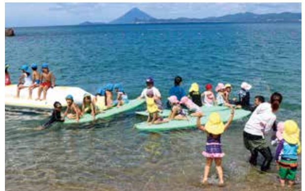
海開きイベントを楽しむ保育園の園児たち

7月13日にゴールドビーチ大浜海水浴場の海開きが行われましたが、当日天候不良により実施できなかった「海開きイベント」が8月3日に開催されました。参加した根占・つじみ保育園の園児たちは、海開きの合図とともに海に飛び込み、海水浴を楽しみました。また、砂浜での宝探しゲームやゴムボートでの遊びも行われ、夏の海を満喫しました。