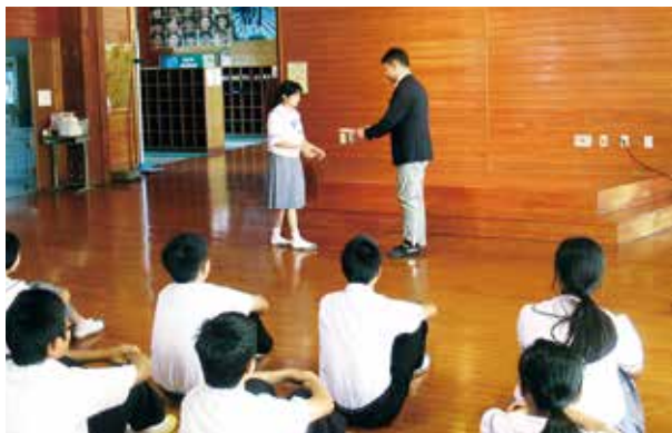
サードブック贈呈式（第一佐多中学校）

今年度は、さらに発展させ「サードブック」事業として、中学生が心豊かに成長するために人生の宝となる1冊を贈りました。