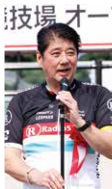
来賓挨拶 県自転車 競技連盟会長