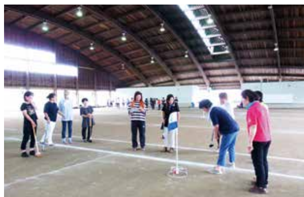
グラウンドゴルフを楽しむ会員

50人の会員が楽しみながら好プレー。参加者は「なかなか思うところにいかないが楽しかった」と、みんなで和気あいあいと、笑顔と笑い声のあふれる大会になり、グラウンドゴルフで賑やかに交流できました。