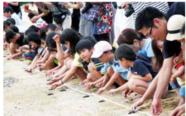
ウミガメの赤ちゃんを海へ放す子どもたち

同会は、ウミガメ放流会等を通じて自然環境保護に取り組んでいます。ウミガメの訪れるキレイな海を今後も守りましょう。