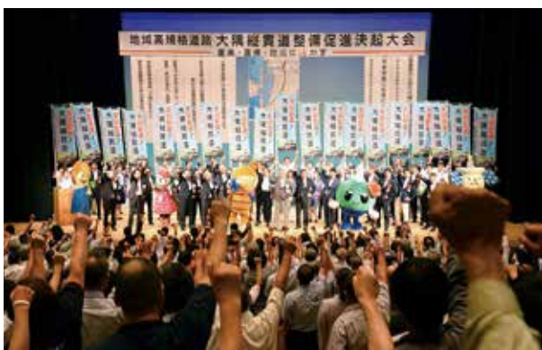
錦江町文化センターでの決起大会

東九州自動車道と一体となり広域交通の重要な路線となる「大隅縦貫道」の全線開通を目指し、産業・医療・防災に活かすことで、本町を含む大隅地域の発展に大きく期待されます。国道448号以南も早期事業化に向けて大会決議されました。