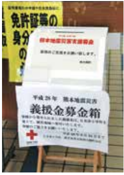
本庁に設置された 義援金募金箱

甚大な被害の様子から、復興へは長い年月を要することが予想されます。一日も早い復興を願い、今後も被災地と十分連携し、必要な支援を行って参ります。