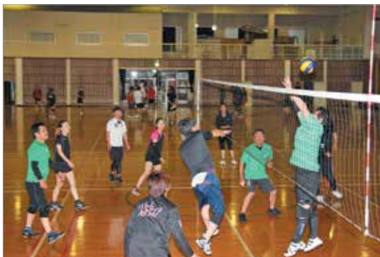
町職域バレーボール大会の様子