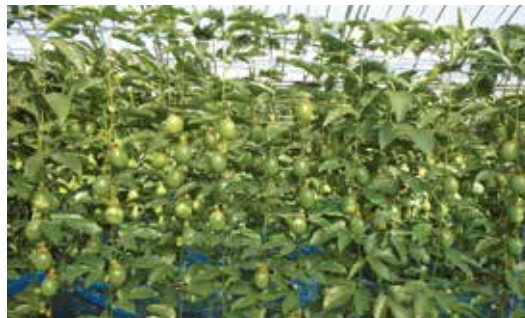
たわわに実るパッションフルーツ