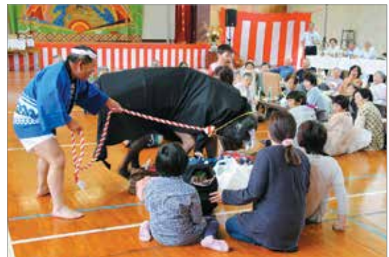
辺塚ふるさとまつりの様子

子どもみこしや餅まき、踊り、歌謡ショー、寸劇と多彩なプログラムで、会場に集まった人々を楽しませました。この祭りは、地区公民館や地元青壮年部の方々が地域を元気にしていこうと毎年開催されており、今回で31回目になります。