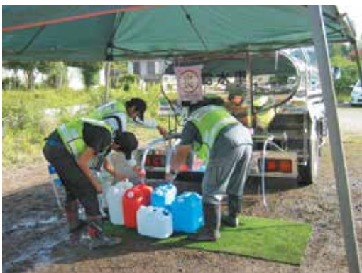
派遣職員による給水活動

全体的な復興作業としては、まだまだ時間や労力が必要ですが、一方で少しずつ復興が形となって表れてきています。苦しい今を乗り越え、復興の先にある明るい熊本を取り戻せると信じて、被災地の皆さんと志を同じくして頑張っていこうと思います。