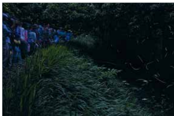
ホタルの幻想的な光の舞を楽しむ見学者

5月21日、横ビュー高原ゆめクラブ（滑川地区公民館）主催の横ビュー高原ホタルまつりが鹿父神社で開催されました。会場では、暗くなるまで手打ちそばの無料振舞やバイオリンとフルートのコンサートが行われ、150人を超える見学者を楽しませました。夜が更けホタルが乱舞し始めると、多くの見学者から「光った、光った、きれい」と感動の声が上がっていました。