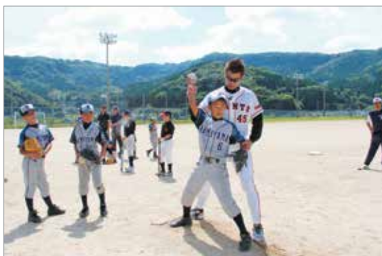
投球フォームの指導の様子