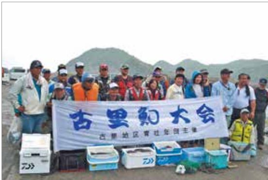
もはめ釣大会に参加した皆さん

大会終了後の懇親会では、もはめの肝炒め料理や刺身などが振舞われ、楽しい交流ができました。