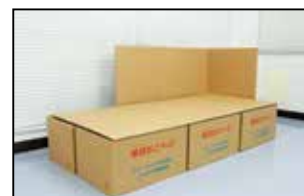
ダンボールベッド