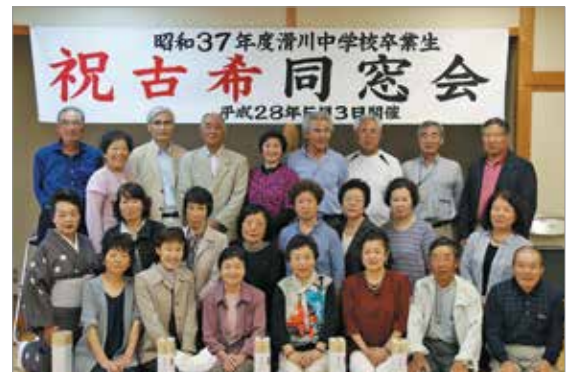
昭和37年度滑川中学校卒業生の皆さん