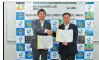
協定書を取り交わす様子

避難所に特設公衆電話を設置し、被災者の通信確保を図ることが目的です。特設公衆電話の基本料金や通話料金は西日本電信電話株式会社が負担するため、無料で利用でき、災害時優先電話なので、通常の電話よりつながりやすくなります。