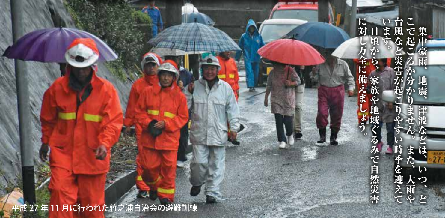
平成 27 年 11 月に行われた竹之浦自治会の避難訓練

集中豪雨、地震、津波などは、いつ、どこで起こるか分かりません。また、大雨や台風など災害が起こりやすい時季を迎えています。日頃から、家族や地域ぐるみで自然災害に対し万全に備えましょう。