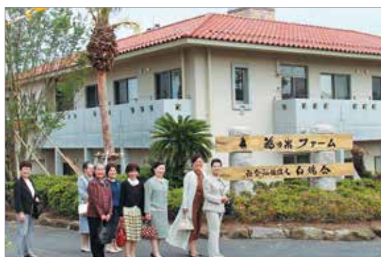
花の木ファーム内覧会に訪れた関係者