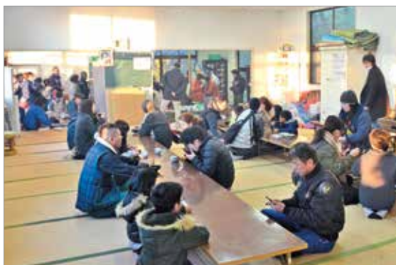
竹之浦公民館でぜんざいをいただく観光客

訪れた60代男性は、「素晴らしい初日が見れた。おまけに温かいぜんざいをいただけて、心も体も温まった。良い1年になりそうだ」と嬉しそうに話してくださいました。