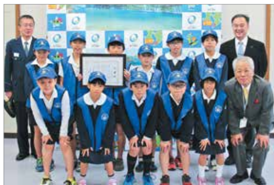
表彰された神山小学校の「なんぐう交通・防犯少年団」

少年団の皆さんは、振り込め詐欺や交通事故防止を目的とした標語を作成し、同標語を元に作成された歌「いつでも元気で」の合唱を行うなど、防犯・事故防止に大きく貢献されました。