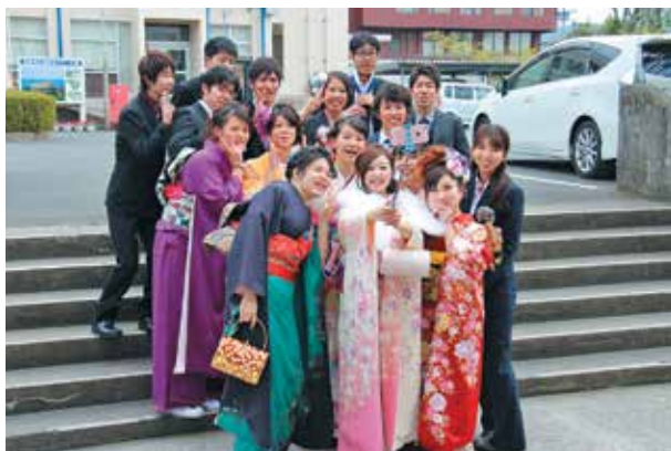
友人達との記念撮影