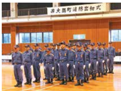
宮田・登尾分団による小隊訓練