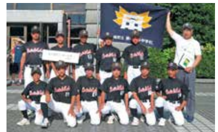
第一佐多中学校野球部