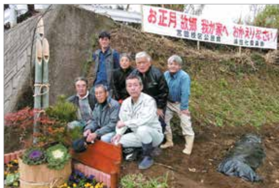
設置された門松・横断幕と宮田校区役員

下り線の横断幕には「お正月故郷我が家へおかえりなさい」、上り線には「ゆっくいできたな、気をちけっもどいやいな」と書かれていました。