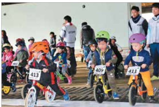
一斉にスタートする幼児バイカー

1着になれなくて泣き出す子どもがいるほど、白熱したレースが数多く展開されました。