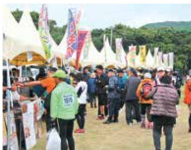
賑わいを見せる地産地消フェア

また、この大会は多数のボランティアスタッフがによって運営が支えられています。スタッフの皆さんありがとうございました。