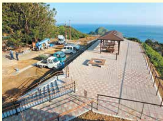
開発が進む佐多岬公園（トンネル入り口）