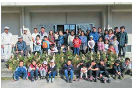
完成した門松と参加者の皆さん

子どもたちは、社会福祉協議会「おおくす会」会員の指導のもと、門松の由来や作り方を教えていただきながら、「来年もよい年でありますように」と願いを込め、それぞれ悪戦苦闘しながら立派な門松を完成させました。