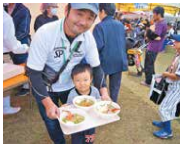
振舞われたイセエビ汁