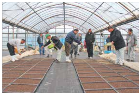
県本土トップを切って行われた種まき

現在、町内6戸の農家が約10ヘクタールで栽培しており、3月上旬に田んぼに定植します。