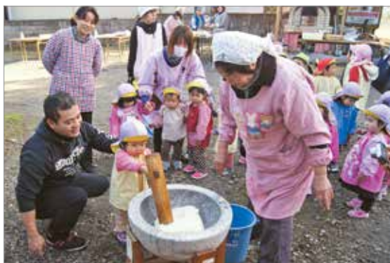
根占保育園での餅つき会の様子