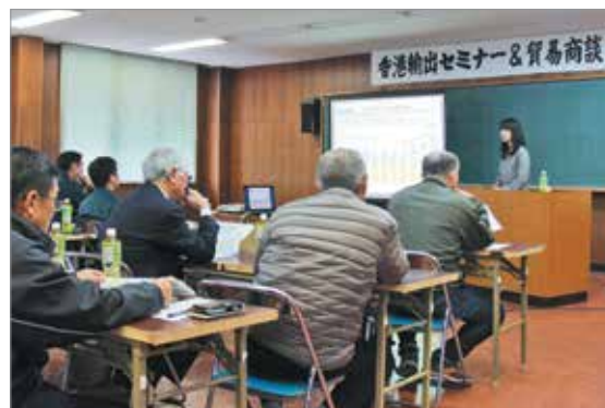
香港輸出セミナーの様子

輸出に興味のある農林水産業や食品製造業、各種経済団体の方々12人が参加し、ジェトロ鹿児島貿易情報センターや鹿児島県貿易協会による説明を熱心に聴いていました。また、貿易商社による個別の商談も実施されました。