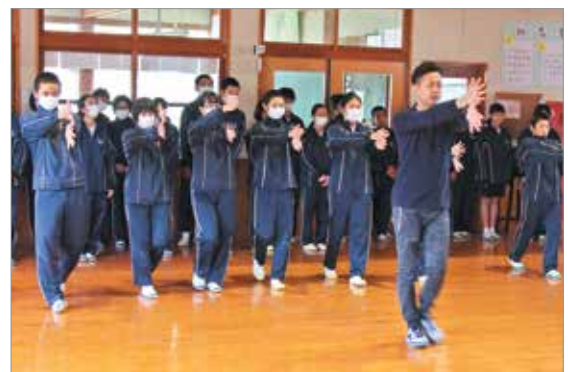
身体を中心を意識してウォーキングする様子

「身体を中心を意識して、手を後ろに強く振る」を日頃の「歩き」に取り入れてみてください。