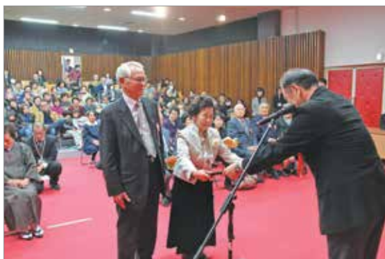
夫婦共に80歳を迎えた長寿証の表彰