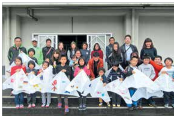
新春たこあげ大会に参加した親子

子どもたちは、社会福祉協議会おおくす会会員の指導を受けながら、約1時間かけて手作りのたこを完成させ、たこあげを楽しみました。空高くたこをあげようと、子どもたちは一生懸命走り回っていました。