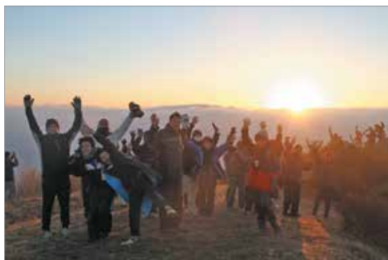
辻岳山頂からの初日を喜ぶ参加者