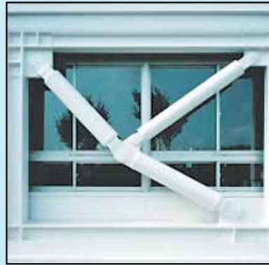
油圧制震ブレースの設置例