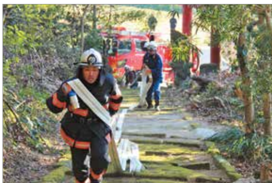
鬼丸神社の境内に向ってのホース延長の様子