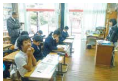
佐多小での租税教室の様子

■問い合わせ先 役場 税務課 Tel 24-3116（直通） 支所 総務民生グループ Tel 26-0511（代表）