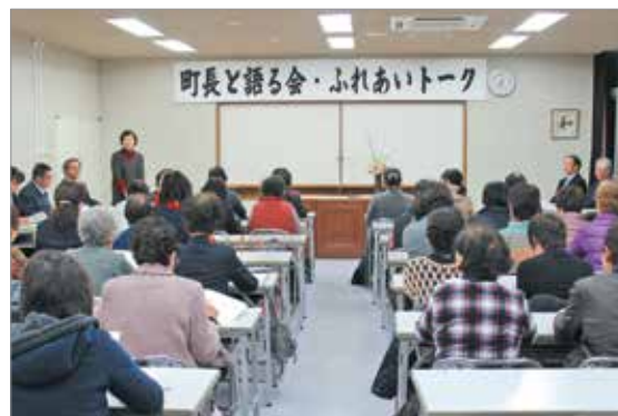
町長と語る会・ふれあいトークの様子

当日は、町内の9つの女性団体から45人が参加し、協働による町づくりを推進するため、有意義な意見交換が行われました。