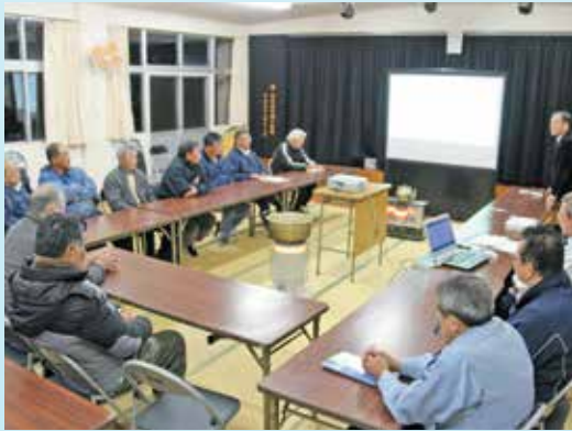
大泊公民館での町政座談会の様子

会開催」を強く要望されました。それらを受け、町内13地区の公民館単位で、役場庁舎の耐震化についての事業説明を主題とした町政座談会を開催することとなりました。 町政座談会は1月12日、辺塚地区から始め、2月9日現在、9地区での説明を終えました。3月初めまでに地区公民館単位での説明及び意見聴取を終え、庁舎の耐震化の方向性を決定する予定です。