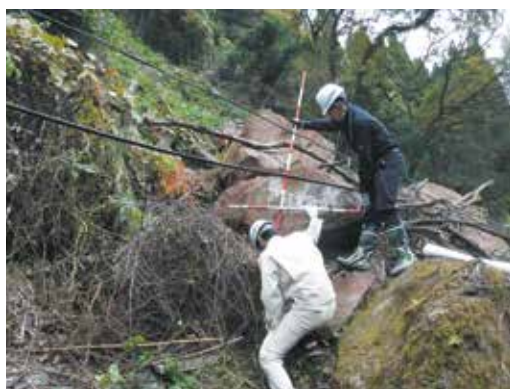
被災現場の測量を行う様子

豪雨に伴う被害件数が574件、合計784件の甚大な被害がありました。青森県や埼玉県、大阪府、山口県、肝付町、錦江町、南大隅町と全国各地から職員が向出して災害支援チームを構成し、災害復旧支援業務を行いました。