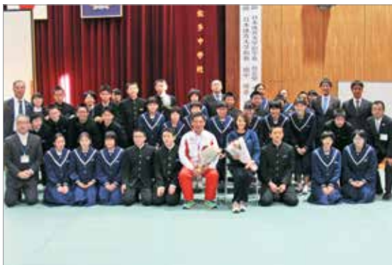
第一佐多中学生徒との記念撮影