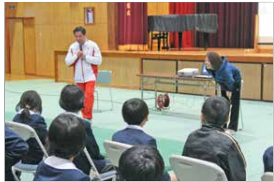
教育講演会の様子

講演会に佐多小の児童や地域住民も参加し、講師のお二人は、自身の体験談を交えながら、「ピンチはチャンスでもある」「好きなことを見つけてください」と話してくださいました。