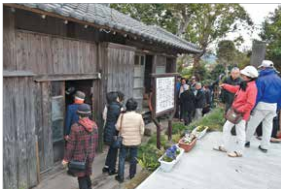
西郷南洲翁宿泊所を見学するツアー客

西郷隆盛は、しばしば本町へ訪れており明治10年、西南戦争の引き金となった私学校生草牟田弾薬倉庫襲撃事件発生の報告をこの宿で聞かれ、「ちょっしもた」と言われたそうです。