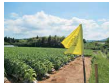
畑に設置された黄色旗

◇お願い事項 誤って農薬が飛散したと思われる場合は、黄色旗に記載されている葉たばこ農家までご連絡ください。