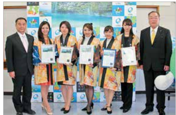
委嘱状が交付された5人のアンバサダー

アンバサダーの皆さんには、WEBやSNSなど活用しながら、本町のPR活動を行っていただきます。