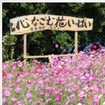
地域によって整備された花壇

また、生涯にわたって「いつでも、どこでも、だれでも」学ぶことができる環境づくりに取り組み、活力あふれる地域づくりを推進するため、引き続き花いっぱい運動などを中心とする地区公民館活動の支援を継続してまいります。