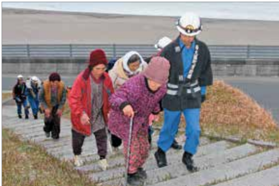
消防団員と一緒に高台へ避難する浜尻地区の住民

当日は、早朝からの訓練でしたが、地域の方や本町消防団、大隅肝属地区消防組合佐多分署、錦江警察署など約100人が参加し、連携をとりながら避難経路や要援護者の救助の方法などを確認しました。万が一、津波警報等が発令された場合には、何はさておき、高台へ避難しましょう。