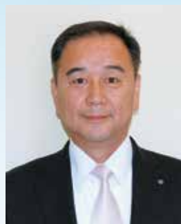
南大隅町長 森田俊彦