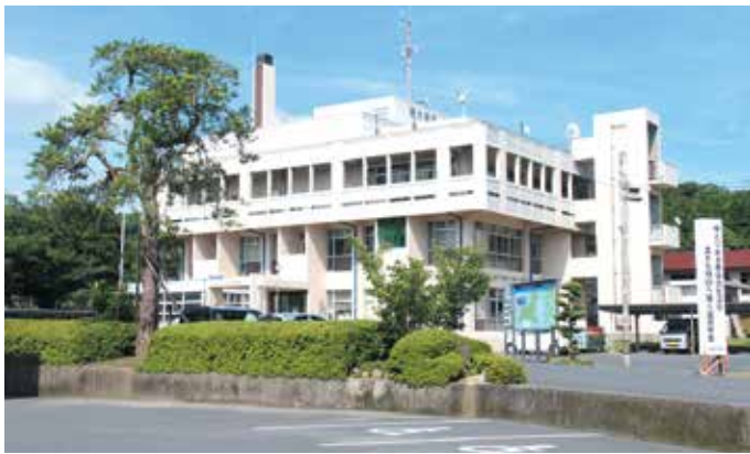
現在の役場本庁舎

現庁舎は昭和48年建築、築43年経過により老朽化が顕著に見えてきております。これまでに外壁塗装や、空調・フロアー等一部改修は行っておりましたが、耐震化については