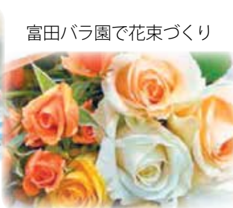
富田バラ園で花束づくり