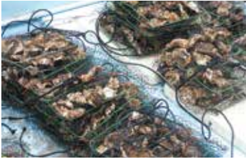
水揚げされた岩ガキ