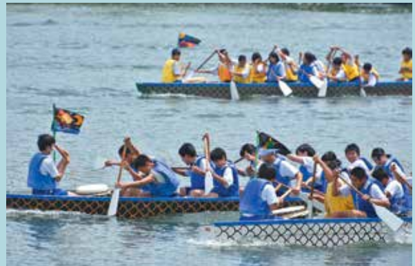
必死に漕ぐ根占中学生

梅雨時季とは思えない強い日差しの中、生徒らは380mの区間を必死に漕いでいました。結果は、3年生で構成されたチームが優勝しました。