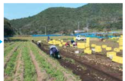
解消された農地 (平成 29 年 3 月)