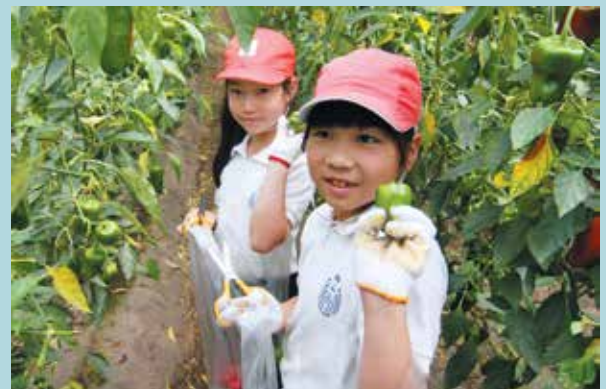
ピーマン狩りを体験する神山小児童