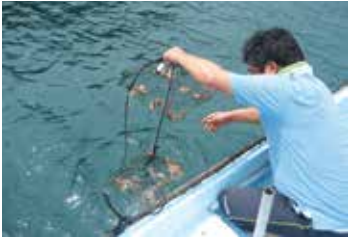
岩ガキの稚貝の投入