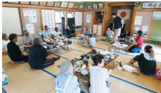
(地区公民館ミニバレーの打ち上げ)