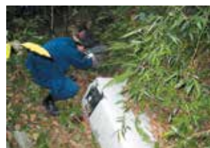
不法投棄現場検証