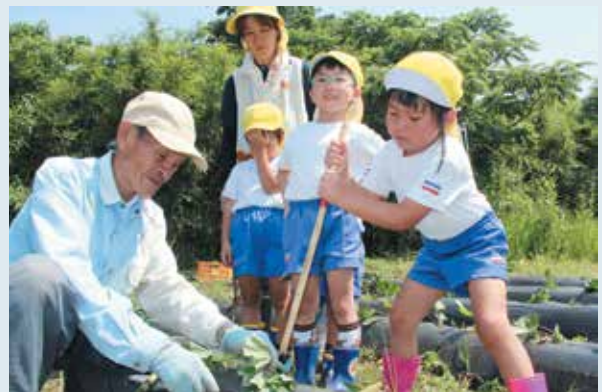
竹の棒を使って植えつけるねじめ幼稚園児

園児たちは、シルバー人材センター会員から教えてもらいながら、竹の棒を使って楽しそうに植えています。