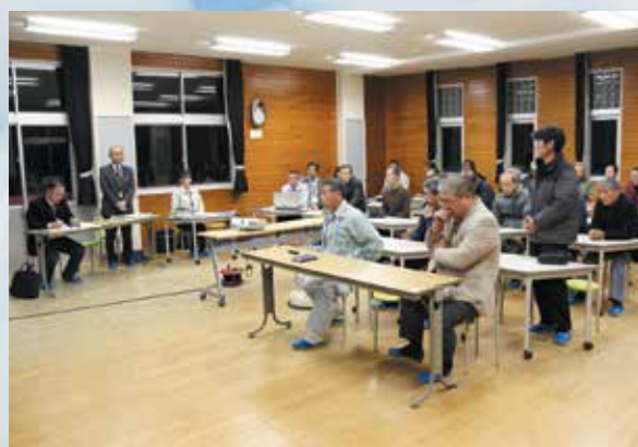
宮田地区での町政座談会 (1月17日)

全体的な参加者は若干少なかったものの、多くのご質疑やご意見を賜わり、概ね内容についてはご理解いただいたと考えております。座談会でのご意見・ご要望等の方向性としては、現庁舎の耐震補強でのご意見もある中、大方のご意見としては、