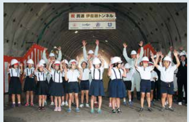
貫通を祝い万歳三唱する佐多小児童

伊座敷トンネルは、防災面だけでなく佐多岬へ安全にアクセスできると期待されており、掘削工事完成後は、舗装や照明などの整備を行い、平成32年末の開通が予定されています。