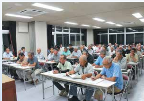
自治会長会 (昨年10月24日)

昨年10月24日、大会議室において、62自治会の出席により自治会長会を開催しました。この中では、これまでの経緯と耐震化の必要性、補強・新築での耐用年数の違いや、今後の取り組み方法についてご説明申し上げ、結論としては一部反対意見もありましたが、新築案で進むべきとの方のご意見が占めたとことであり、座談会形式で町民への内容説明を行った後、方向性を見極めるべきであるとのご意見をいただきました。