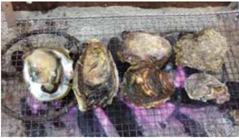
岩ガキの炭火焼 (2人前)

本町では、漁業者の所得向上と佐多岬地区周辺の観光の目玉となるよう平成 26 年度から、鹿児島県及びおおすみ岬漁業協同組合と連携し、岩ガキの養殖に取り組んでいます。