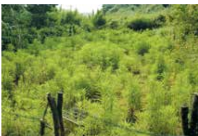
事業着手前の耕作放棄地