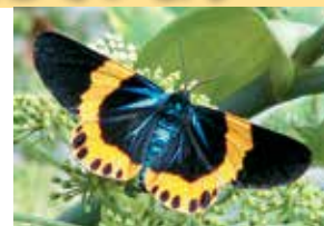
キオビエダシャクの成虫

被害の拡大防止には、幼虫の早期発見による捕殺が効果的です。もし、幼虫が大量に発生しているときは、薬剤散布が効果的です。ただし、薬剤散布は幼虫を殺すには効果がありますが、成虫、卵及びサナギには効果がありません。