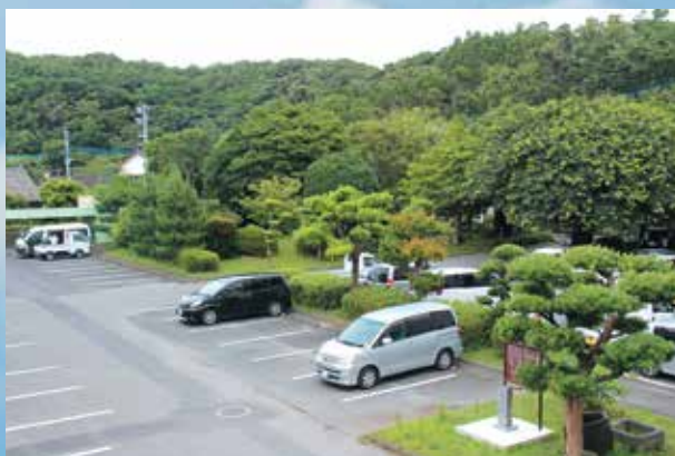
新庁舎建設予定地