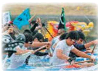
ねじめドラゴンボート

南大隅町では魅力的な体験プログラムを提供しています。パンフレット『ひみつ基地みなみおおすすめ』には、体験プログラムをはじめ観光スポット、地域のお祭りなど、普段体験することの出来ない町の魅力をぎゅっと詰め込んでいます。詳しくは、南大隅町観光協会ホームページをご覧ください。みなさまのご参加をお待ちしております！