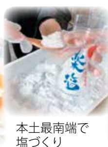
本土最南端で 塩づくり