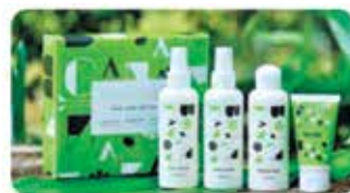
ボタニカル ファクトリー

南大隅町では魅力的な体験プログラムを提供しています。パンフレット『ひみつ基地みなみおおすすめ』には、体験プログラムをはじめ観光スポット、地域のお祭りなど、普段体験することの出来ない町の魅力をぎゅっと詰め込んでいます。詳しくは、南大隅町観光協会ホームページをご覧ください。みなさまのご参加をお待ちしております！