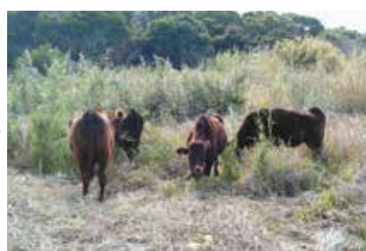
平成 23 年に放牧された繁殖牝牛