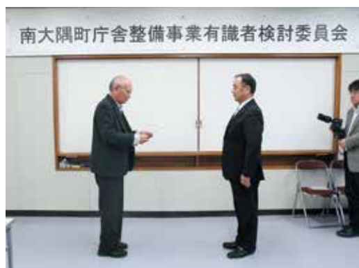
庁舎整備事業有識者検討委員会からの答申(昨年11月28日)

1点目に、新庁舎の位置、規模、機能等については、今後十分に検討し事業推進すること。