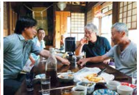
(飲み会でなんこ遊び)