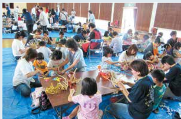
創作活動を楽しむ子ども会会員

うどんや竹とんぼ作り、レジンクラフト、焼き板クラフト、エコクラフトの5つのグループに分かれて創作活動を行いました。作る楽しさを味わいながら、普段交流することの少ない異年齢や他の学校の子どもたちと交流を深めました。