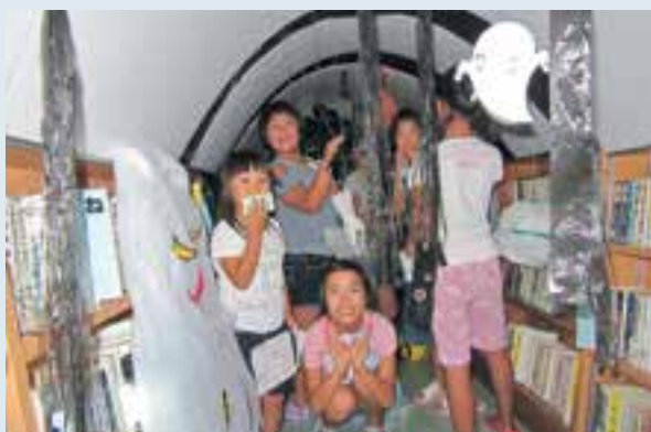
図書館での探検を楽しむ様子

この日の図書館は、館内が暗く探検仕様に模様替えされ、参加者は地図を頼りに与えられたミッションをドキドキしながらクリアしていきました。その後、怖い話をテーマにした紙芝居や人形劇なども行われ、参加者はいつもと違う図書館の雰囲気を楽しんでいました。