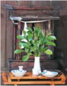
オギオンさあご神体

本町の無形民俗文化財に指定されている島泊地区の伝統行事「オギオンさあごの嫁入り」が8月11日に行われました。