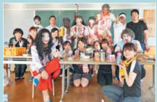
肝試しのスタッフ（町青年団）

この肝試しは、町民の交流の機会を増やし、地域の活性化につなげようと3年前から実施されています。