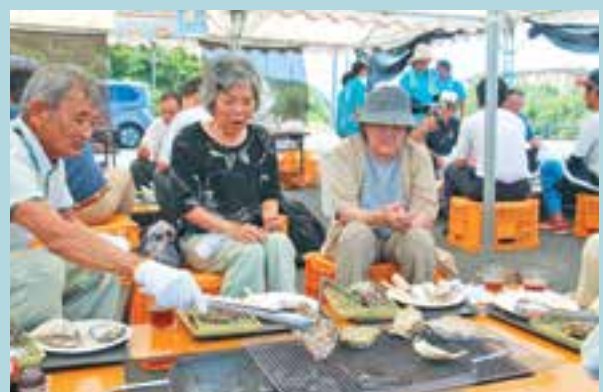
岩ガキを炭火で焼く来場者