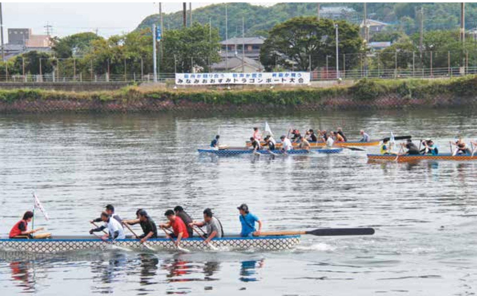
自治会対抗の第13回みなみおおすみドラゴンボート大会（平成29年5月14日開催）

今回は、自治会に対する本町の支援事業の内容や各自治会の活用例などについてご紹介します。