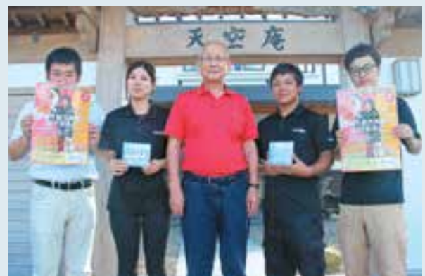
完成したCDと十津川農場の皆さん