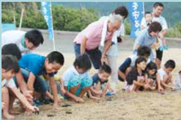
ウミガメの赤ちゃんを海へ放す子どもたち

今季、大浜海岸では6月14日から7月16日まで計8回の産卵が確認され、ふ化に合わせて放流会が開催されました。