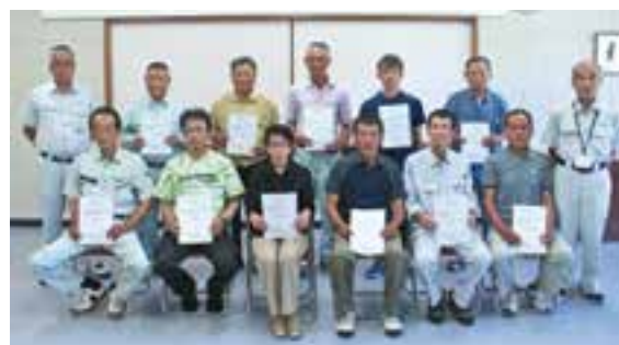
農地利用最適化推進委員と橋口委員長