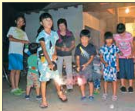
屋外で行われた子ども向けイベント

それよりも、小さい子どもから高齢者まで、公民館に入り切らないぐらい集まっていたら、本当にうれしかったです。