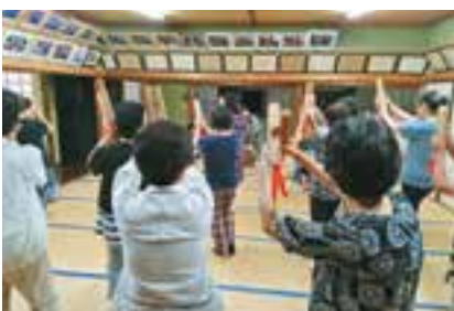
栗之脇公民館での練習風景