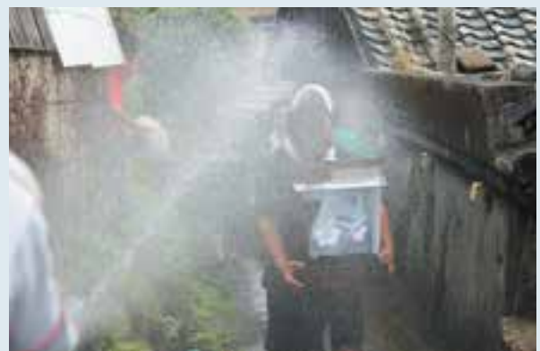
ご神体を運ぶ様子