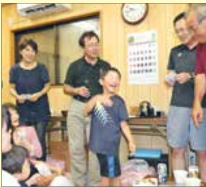
公民館内での交流会の様子

まずは、みんな一堂に集まってもらいたい。そう思って役員で協議したら「夕涼み会」が一番良いだろうとなりました。