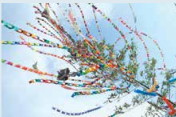
風に揺れる七夕飾り

地区公民館内の各自治会ごと、自治会内の各班ごとに出来栄を競うコンテスト形式で実施しているところも多いようでした。8月は猛暑が続きましたが、風に揺れる七夕飾りは、どことなく涼しげでした。