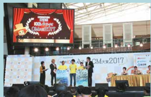
ふるさとCM大賞審査会の様子