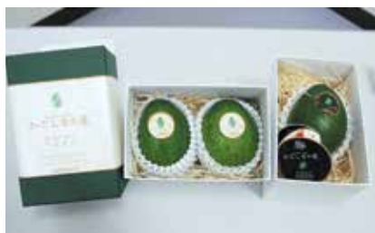
ギフト用の南大隅町産アボカド