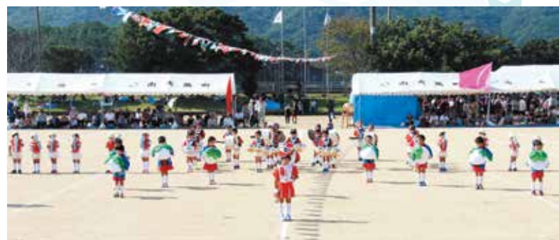
鼓笛マーチング (根占保育園・つじみ保育園)