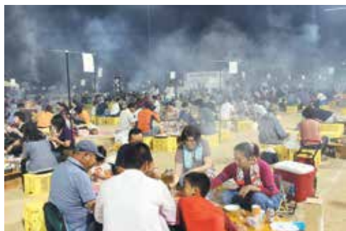
バーベキューを楽しむ参加者

2017 南大隅肉の感謝祭が10月12日、根占運動場で開催され、町内外から1000人が参加し、黒牛ステーキや黒豚肉、鶏肉などをバーベキューで楽しみました。