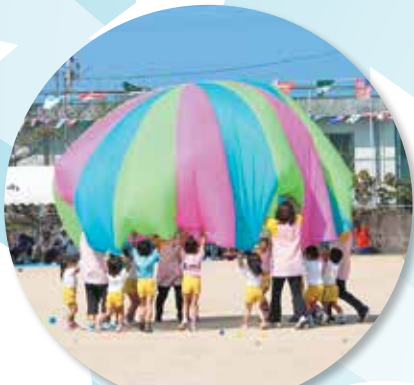
バルーン体操 (はまゆう保育所)