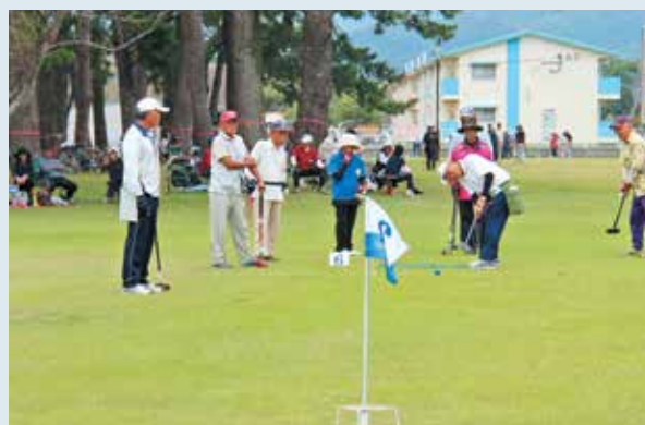
グラウンド・ゴルフを楽しむ参加者