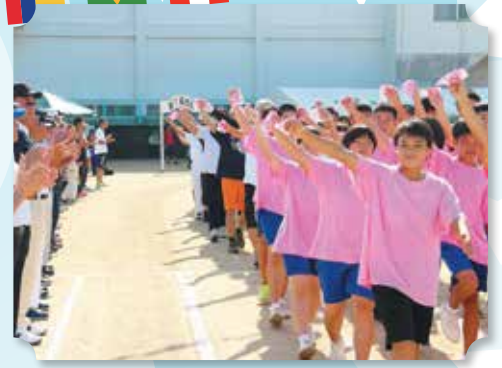
城内・滑川地区の選手入場