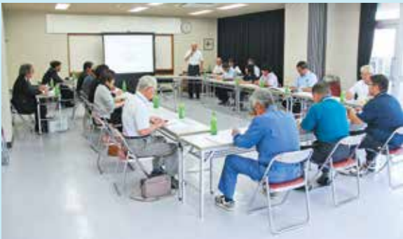
町民を代表する各種団体等の代表者や学識経験者などで構成された「本庁舎建設検討委員会」

役場本庁舎の建設に伴う設計業務委託契約を9月26日、株式会社社島中設計（鹿児島市）と締結後、新庁舎建設に向けた基本計画及び実施設計業務が実質スタートしました。 プロポーザルで最優秀の評価を得た提案書や配置図（平面図）を基に、コンパクトで機能性の高い庁舎建設に向けた協議が進められています。 今年1月から3月にかけて町内13か所で開催した町政座談会でいただいたご意見やご要望、10月2日に発足した3つの検討委員会での協議事項等を踏まえ、実施設計が進められています。