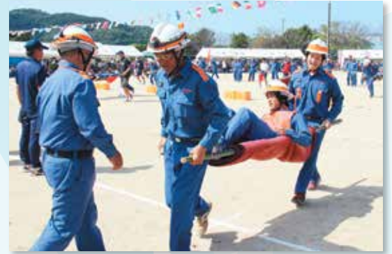
救命指令！ 消防団員は出動せよ！