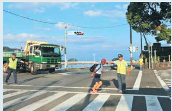
立哨指導を行う地域安全パトロール隊

また、児童生徒が交通事故に巻き込まれないようにと毎月10日は、会員が手分けし通学時間に合わせて町内の主要交差点など5か所で立哨指導されています。