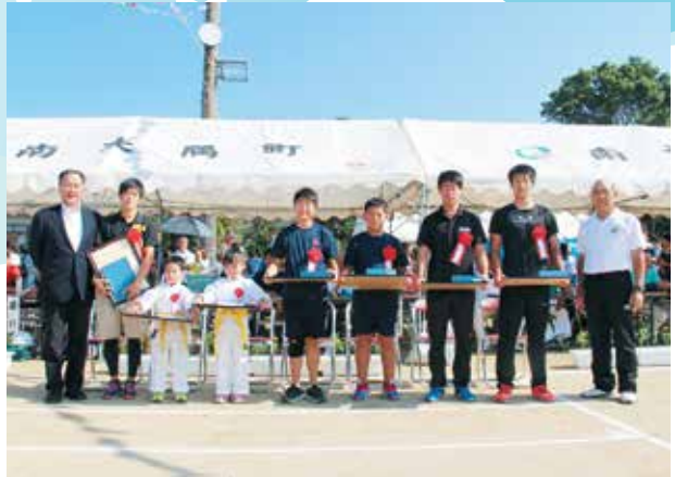
表彰された選手・団体のみなさん