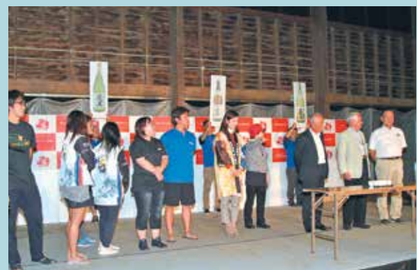
焼酎の銘柄を当てようと利き酒する参加者

前夜祭では外国チームや招待チームが集結し、プレゼント交換や焼酎の銘柄当てコンテスト、楠龍太鼓や保育園児による鼓笛マーチングなどが披露され、来場者を楽しませていました。