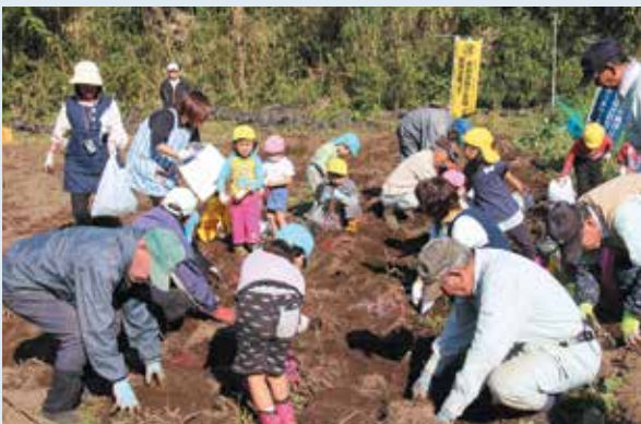
芋掘りをするねじめ幼稚園児と町シルバー会員

園児たちは、大人の手伝いをもらいながら「ヨイショ、ヨイショ」と声を出して大きなサツマイモを掘り、大喜びでした。