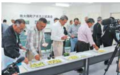
試食会（海外産との味比べ）