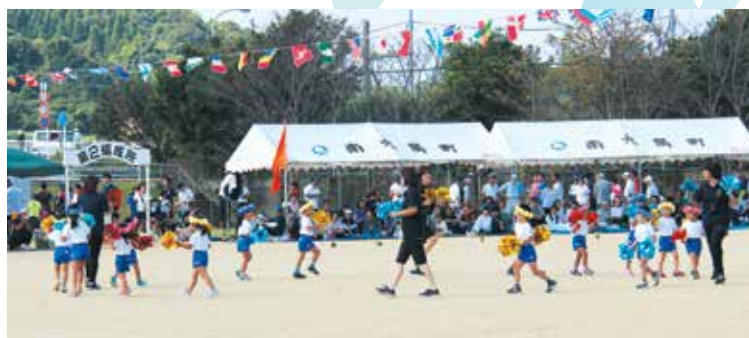
ゆうぎ (ねじめ幼稚園)