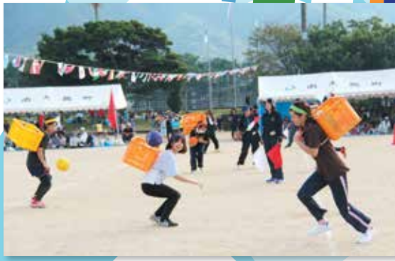
バックでキャッチ