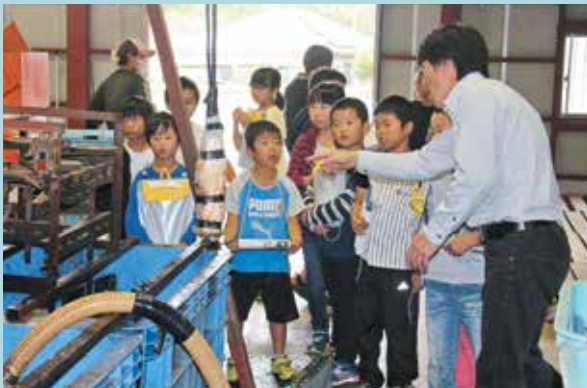
ねじめびわ茶の製造過程の説明を熱心に聴く児童

ビワの葉からねじめびわ茶の茶葉になるまでの製造過程について、農場職員から説明を受け、全国で販売されているねじめびわ茶のすべてが、南大隅町にある工場だけで作られていることに、児童はびっくりしていました。