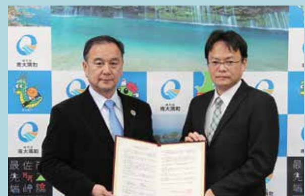
山口大隅森林管理署長（右）と森田町長

災害時の情報共有がスムーズになるばかりでなく、森林災害や林道災害が発生した際、復旧に向けた相互支援の体制が強化されました。