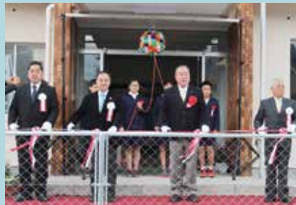
展示館テープカット