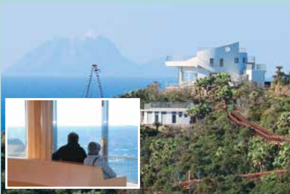
供用が開始された佐多岬展望台