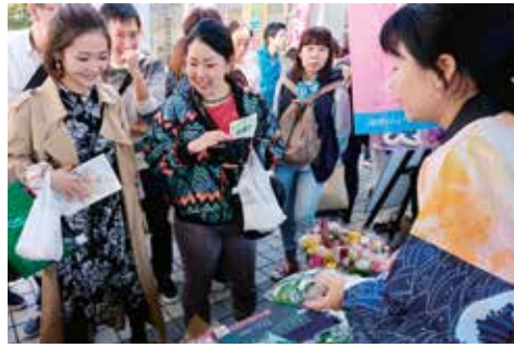
東京農業大学での収穫祭 (平成29年11月)

受入家庭の皆さんが、包括連携協定締結式や、収穫祭出店のため上京された際には、A・A研現役の皆さんはもちろんのこと、OB・OGと一緒にになって、盛大に歓迎していただいたそうです。