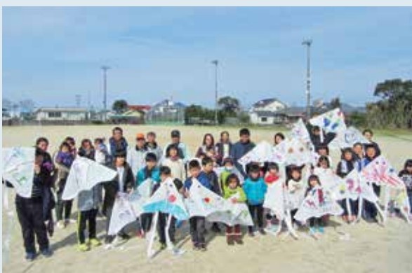
新春たこあげ大会に参加した親子

子どもたちは、社会福祉協議会おおくす会会員の指導を受けながら、約1時間かけて手作りのたこを完成させ、たこあげを楽しみました。空高くたこをあげようと、子どもたちは一生懸命走り回っていました。