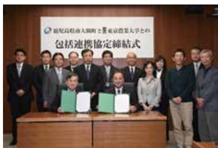
東京農業大学と本町との包括連携協定締結式 (平成29年1月)

15人の学生と13戸の家庭で始まった小さな交流が、20年の時を経て大学と町という組織を動かし、まちづくりや地域振興、教育の発展など幅広い分野で相互に協力していくため、東京農業大学と本町は平成29年1月、「包括連携協定」を締結しました。