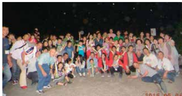
A・A研南大隅合宿 20周年記念式典 (平成27年5月)

念式典には80人もの人が、日本各地、海外からも集まり、改めて絆の深さを感じました。