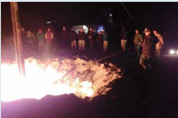
町海岸の浜辺で実施された「どやどや左議長」

昔は中学生を頭に児童が実施していましたが、少子化のため途絶えていました。子どもがいなければ大人がやればいいと、実行委員会を結成して実施され、地区民ら40人が浜辺に集まり、正月飾りや竹に火をつけ、無病息災を祈りました。