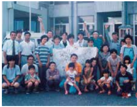
第1回A・A研南大隅合宿 (平成8年8月)

本町とA・A研との交流は平成8年の夏、13戸の農家が15人の学生を2週間受け入れるという「グリーンツーリズム」に似た形でスタートしました。2回目以降の合宿は、4月下旬から5月上旬の「ゴールデンウィーク」時期に実施され、これまで合計22回、31戸の家庭で、延べ450人を超える学生が本町での合宿を経験しています。