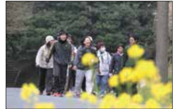
第1回大会の様子(佐多地区)