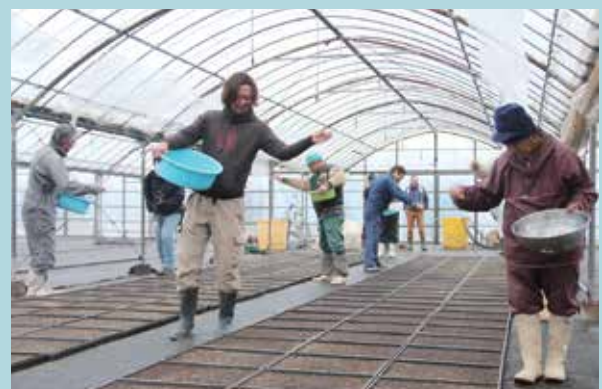
県本土トップを切って行われた種まき

現在、町内6戸の農家が約10ヘクタールで栽培しており、3月上旬に田んぼに定植します。