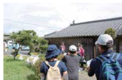
チェックポイントでの写真撮影