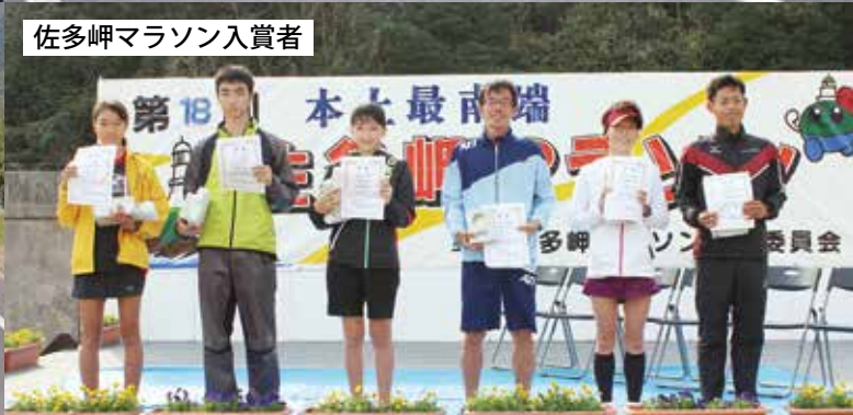
佐多岬マラソン入賞者

12月2日、第18回佐多岬マラソン、第9回31度線ウォーク、2018南大隅町地産地消フェアが同時開催されました。