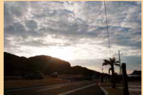
私が見た初日の出、佐多岬第 2 駐車場