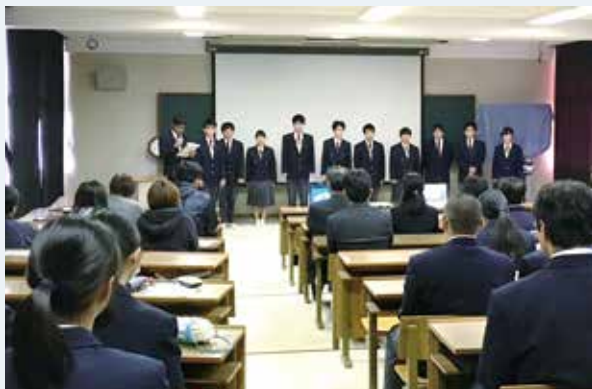
制作の活動報告をする生徒たち

PR動画は、雄川の滝アクアベースカフェや、パッションフルーツ農家など、生徒が中心となってマイクやカメラを担当して撮影し制作しました。制作された動画は、インターネット動画サイトで見るができます。