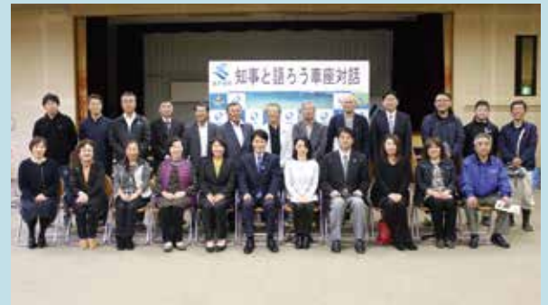
「知事と語ろう車座対話」参加者の皆さん

参加者からは、それぞれの活動紹介と、観光や教育振興、農林水産業、医療福祉等、高齢社会の課題について様々な意見が出され、知事との有意義な意見交換がなされました。