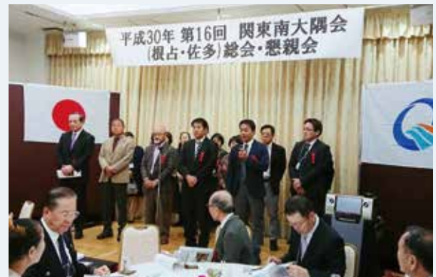
関東南大隅会総会

総会終了後懇親会も開催され、会員の皆さんは、ふるさとの話題を語り合いながら交流を深めていました。地域おこし協力隊の取り組みや、映画「きばいやんせ！私」の先行試写会が行われるなど懇親会は大いに盛り上がりました。