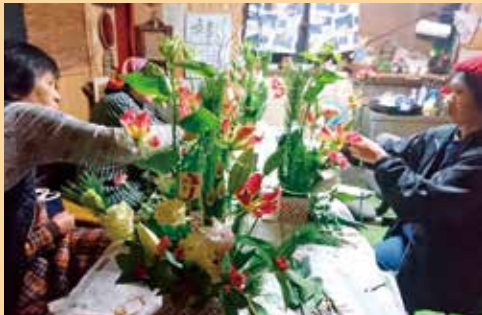
フラワーアレンジメントの様子

新年最初の仕事は佐多岬の初日の出。役場観光課・観光協会のみなさんと一緒に対応させていただきました！まだ空も暗い時間から、多くの観光客の方がいらっしやり、第 2 駐車場からシャトルバスも運行しました。鹿児島県内では、見える場所は少なかったという今年の初日の出。無事、南大隅町で、元旦の朝からお日様を拝むことができたことに感謝です！今年もいい一年にすぞ！