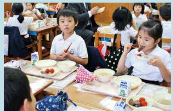
ステーキの給食を楽しむ神山小学校1年生

12月4日、町内の小中学校・幼稚園・保育園の子ども達へ、「鹿児島黒牛」ロース肉のサイコロステーキが振る舞われました。本町では、子ども達に鹿児島黒牛の良さを知ってもらおうと、畜産農家の方が給食と一緒に食べ交流を図りました。子ども達は、サイコロステーキを頬張り大満足でした。今回は、鹿児島県町村会からの助成により記念事業として実施されました。