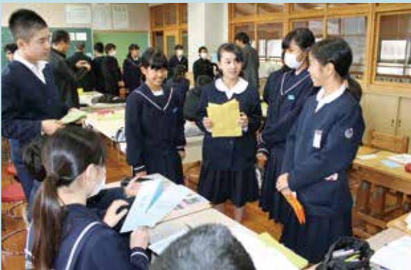
英語で作成したクイズを発表する児童生徒たち

神山小学校6年生42人は、根占中学校に向いて英語の授業を体験し、中学生と机を並べて南大隅町の紹介文やクイズを作成しました。中学1年生も久しぶりに出会う後輩に教えながら楽しんでいました。英語の授業を通して、小学校と中学校の9年間で地域の宝を育てる相互連携を進めています。