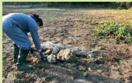
大泊での活動の様子