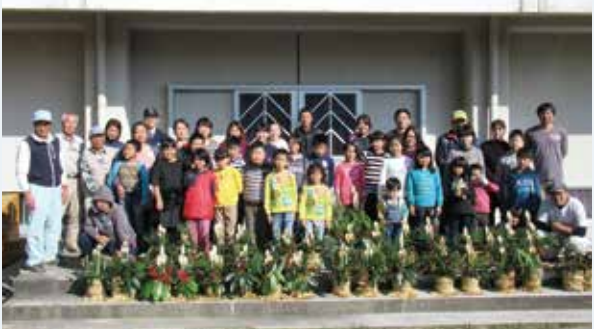
完成した門松と参加者の皆さん

「よい年でありますように」との願いを込め、それぞれ立派な門松を完成させ年の瀬の交流を深めました。