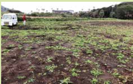
大泊の熱帯果樹施設整備予定地

イノシシやサル以外にも・・・ある朝、パッションフルーツ苗のポットが倒れている様子が確認され、よく観察してみると地面が不自然にボコボコと盛り上がっていました。もぐらの仕業です。被害というほどのものではないですが少し驚きました。