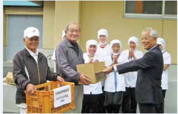
シルバー人材センター会員から教育長への寄贈