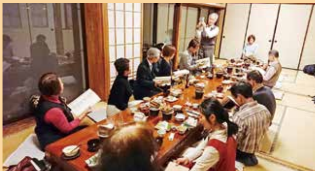
佐多岬コンシェルジュの会・懇親会の様子

事務局サブ担当として関わらせていただいている「佐多岬コンシェルジュの会」懇親会が開催されました！佐多岬コンシェルジュさんは、日頃、佐多岬や雄川の滝、周遊バスでの案内など、南大隅町の観光案内を担ってくださっています。歴史や文化に詳しいだけでなく、歌に踊りに芸達者な皆さんと話す時間は、学びあり笑いあり、本当に良き時間です！