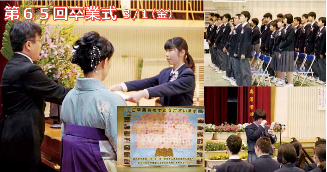
▲3年生37名が南大隅高校を卒業しました。これから様々な場所で卒業生が輝いていくことを期待しています。