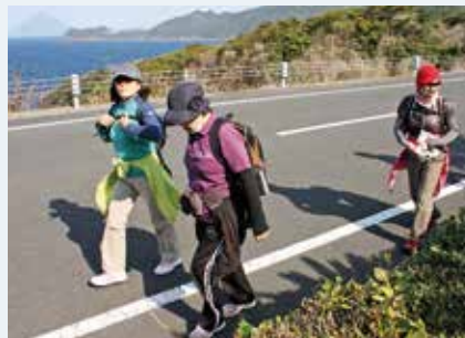
ウォーキングを楽しむ参加者

3月17日、第4回南大隅町ウォーキング大会が、佐多島泊から尾波瀬で開催されました。コースは3つ用意され、旧島泊小学校をスタートした参加者は、自分の体力に合わせて島泊自治会内、佐多ふれあいパーク、尾波瀬自治会まで南下して折り返し、景観を楽しむウォーキングができました。