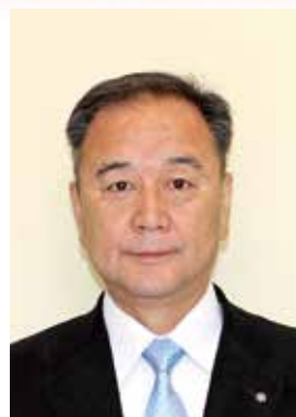
南大隅町長 森田俊彦