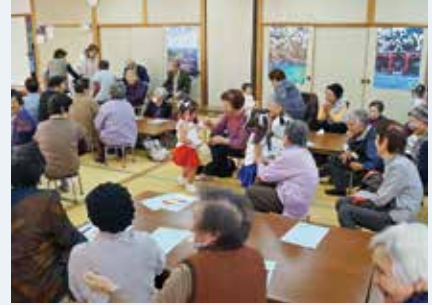
はまゆう保育所園児との交流

3月1日、80歳以上の独居高齢者の交流会「泣たい・笑たい・ふれあいの会」が山村交流施設で開催されました。交流会では、49人の佐多地区高齢者が参加し、鹿屋市消費生活センターの講話や、はまゆう保育所の園児たちによる遊戯が披露され、交流を深めました。