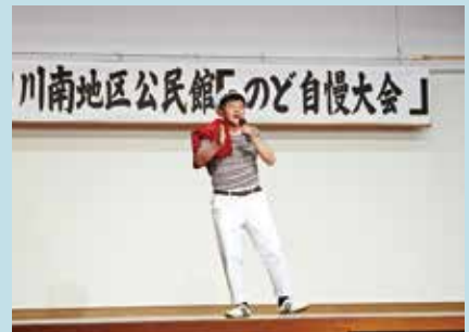
のど自慢大会の参加者

「高齢化の町でも、元気ができるイベントを開催したい」と、第3回目を迎えるのど自慢大会を開催し、交流を深めました。