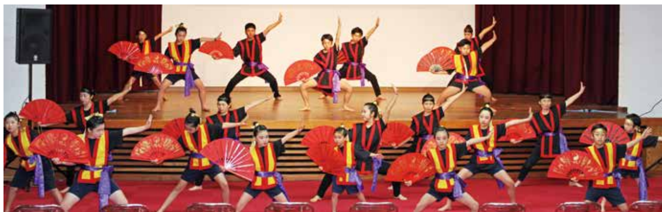
平成 30 年度実施「南蛮 F L A G」の取り組み

町民が自ら企画・提案する事業を支援するため、「企画提案型まちづくり助成事業」を実施しますので、観光振興、特産品開発、販売促進、地域づくり、イベント開催等、共生協働等に取り組まれる団体を募集します。