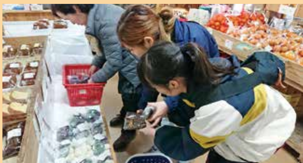
大久保家のおもちとあくまきを並べる学生さんたち

2月～3月にかけて21日間、東京農大の学生さん3名が、授業の一環として農業研修に訪れました！私は学生2名1泊のみの受入でしたが、町の暮らしについて積極的に質問してくれ、回答している私自身もまた新たな発見があり、とても新鮮な時間を過ごしました！滞在中、約11軒の農家をまわった学生さん、受け入れてくださったご家庭、事務局のみなさんお疲れ様でした！