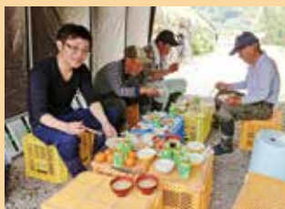
【美味しいお昼ご飯に感謝】