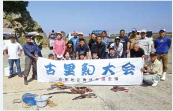
もはめ釣り大会参加者の皆さん

釣り大会後、古里公民館において、モハメの肝炒りや石鯛、サザエ、カラス貝など地元の食材を使った料理で、集落住民も参加し、釣り大会参加者との懇談を楽しみました。