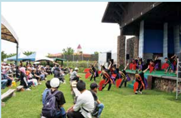
演舞する南蛮FLAGメンバー

演歌歌手によるコンサートや多くの出店ブースに、たくさんの来場者でにぎわいました。また、佐多地区の児童生徒を中心に組織された南蛮FLAGがステージを盛り上げました。