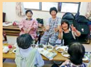
【笑顔が素敵なお母さんたち】