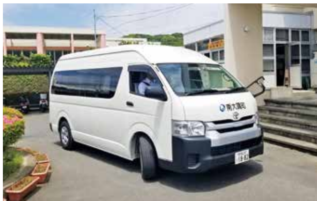
地域公共交通対策事業の 14 人乗りワゴン車