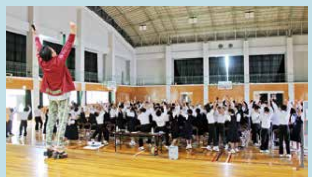
会場が一体となった講演会