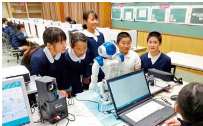
神山小学校でのロボット教育事業

空家解体事業や小中学校電子黒板購入事業に、環境保全・教育振興の寄附金を、タウンプロモーション事業に映画製作目的指定の寄附金を充て事業を行いました。