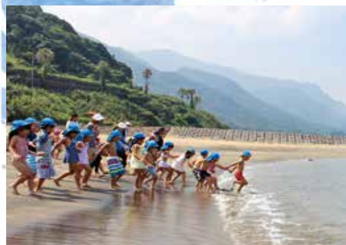
平成30年度の海開き