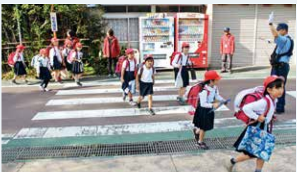
神山小学校前での声掛け運動

5月12日は「民生委員・児童委員の日」と定められており、民生委員・児童委員の活動を広く理解していただくことを目的にしています。