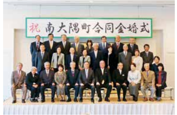
平成 30 年度の合同金婚式（ホテル佐多岬）

役場 介護福祉課 Tel 2 4 - 3 1 2 6 支所 総務民生グループ Tel 2 6 - 0 5 1 1