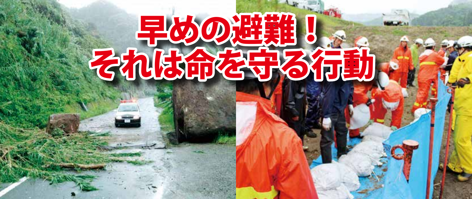
平成30年9月 台風24号による落石（国道269号線浮津付近）