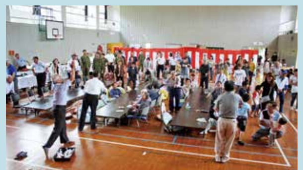
祭りが盛り上がる「餅まき」

餅まき、神輿や、ステージショーが披露され、住民や来賓、辺塚地区へ移住された方々や、出身の方々など、多くの参加者による交流が深まり、敬老会としても実施されたことから、世代を越えた祭りとなりました。