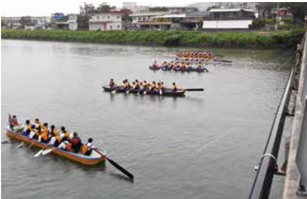
ドラゴンボートを楽しむ根占中学校生徒

町商工会青年部からドラゴンボートの漕ぎ方の指導を受けた1年生から3年生までクラスごとのチームは、それぞれのチーム旗を掲げ、ゴールを目指して、息を合わせて漕ぎ、ドラゴンボートを体感しました。