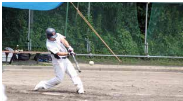
優勝したソフトボール