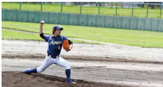
優勝した軟式野球