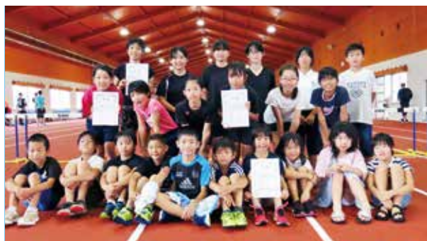
陸上競技に参加された皆さん