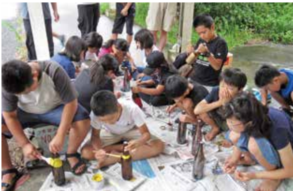
ボトルレター作りを行う参加者

7月14日、潮流の流れの学習や、メッセージボトルでの交流を目的に「洋上体験活動」を行い、52人の親子が参加しました。台風の影響により、船から瓶を流すことはできませんでしたが、メッセージが届くように期待を込めてボトルレターを作成しました。また、大泊子ども会が2008年に流した瓶がアラスカで、2010年の瓶がハワイで見つかり、それぞれ返事が届きました。