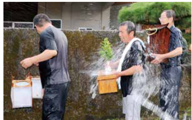
ご神体を運ぶ集落の人たち

7月27日、島泊地区のオギオンさあの嫁入りが行われました。この行事は、毎年、旧暦6月15日に行われ、この日に1年間あずかったご神体（おズシ）を隣の家へ運ぶ伝統行事です。ご神体を運ぶ道中、集落の人々が「ヤンヤ、ヤンヤ」と声をかけ、ご神体めがけて水をかけます。ご神体をあずかった家では、キュウリを食べてはいけないといわれています。