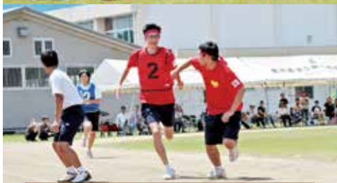
競技の部優勝：2年生（赤）