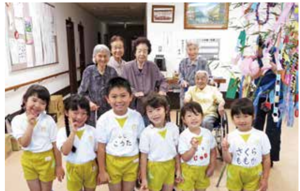
七夕飾りを届けた園児たち