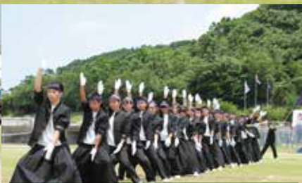
応援の部優勝：3年生（紫）