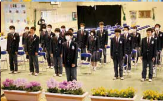
▲3年生28名が南大隅高校を卒業しました。これから様々な場所で卒業生が輝いていくことを期待しています。