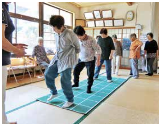
ころばん体操・スクエアステップ

心、健やかな体を育むことを目指し、「南大隅町教育行政の大綱」に基づき、ふるさとを大切に、「誇りのもてる教育・文化のまちづくり」を基本目標に、未来を担う子供たちが、豊かな心とたくましい身体を持ち、自ら考え行動する「生きる力」を備え、「ふるさとを愛し誇りにする子供」となる良好な環境づくりを推進します。