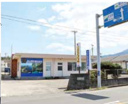
南大隅町観光協会 HP https://www.satamisaki.com/

南大隅町観光協会 事務局 Tel 24-3120 (FAX兼用) info@satamisaki.com