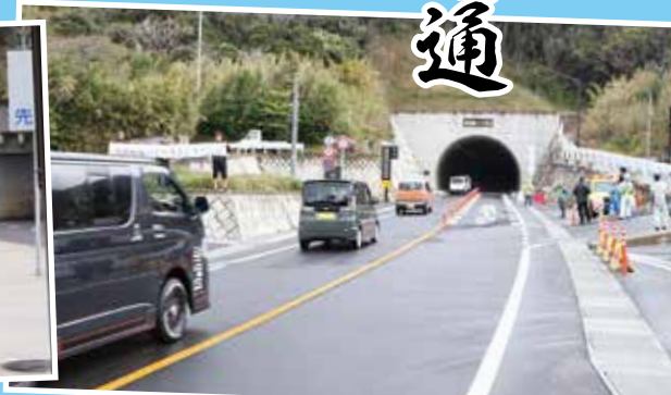
3月22日開通(伊座敷側)