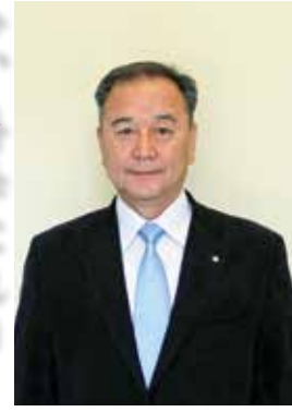
南大隅町長 森田俊彦