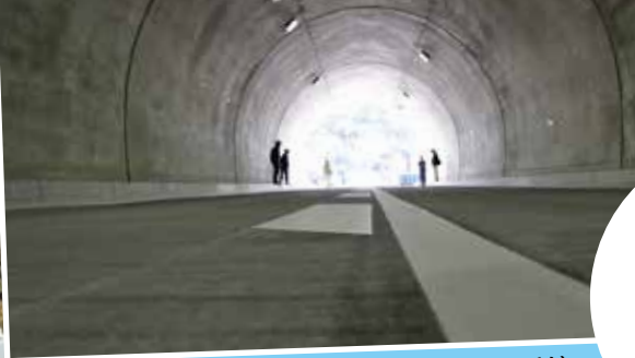
トンネル内から伊座敷方面(開通前)