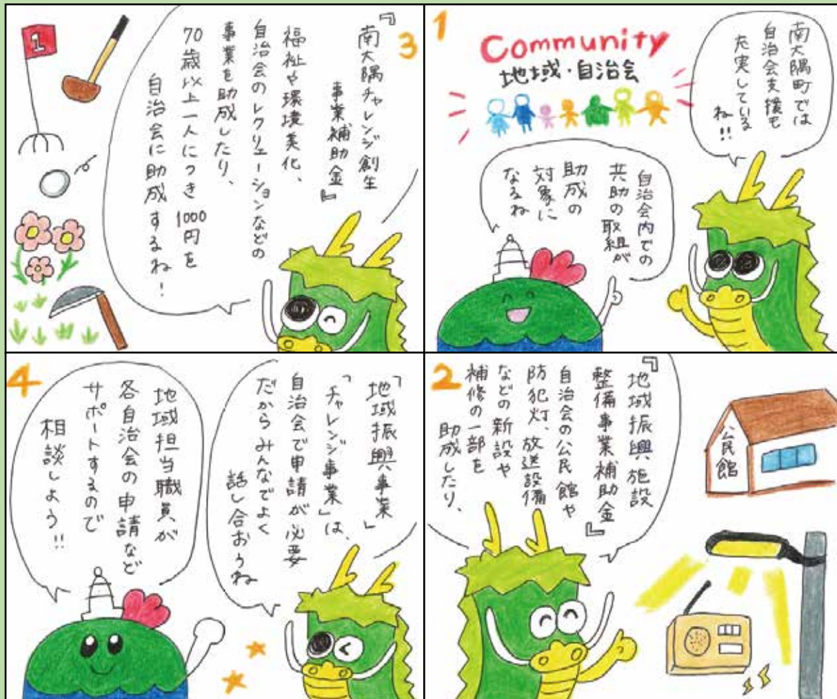
■問い合わせ先 役場 総務課 Tel 24-3111 絵 有木円美（地域おこし協力隊OG）