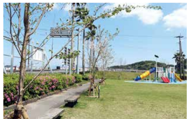
関西南大隅会寄贈の桜3本と、児童遊具

公園内は、桜が咲き春の訪れを感じられます。また、町児童遊具整備事業により、新しい児童遊具が完成し、みなと公園が桜咲く憩いの場として親子で楽しめるようになりました。