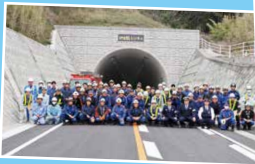
3月13日、開通前の防災訓練