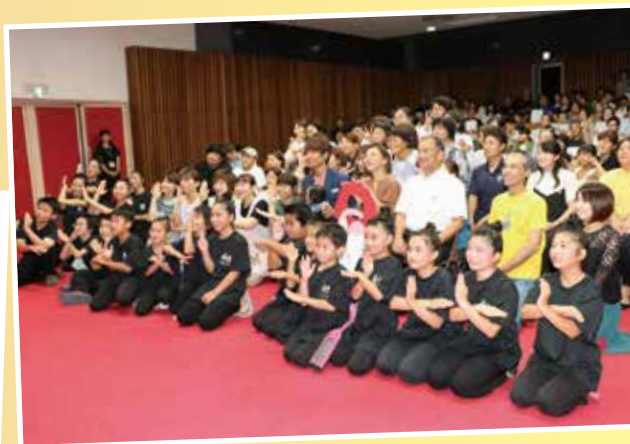
子育てサポートリーダーの皆さん(敬称略)

日常生活の中でふと感じる疑問や悩み等、何でもリーダーにお伝えください。子育て世代をつなぐ「子育て共助のプラットフォーム」として、子育てを応援していきます。子育てサポートリーダーの詳細につきましては、18歳未満の子どもがいる家庭にリーフレットを郵送しておりますので、ご確認ください。