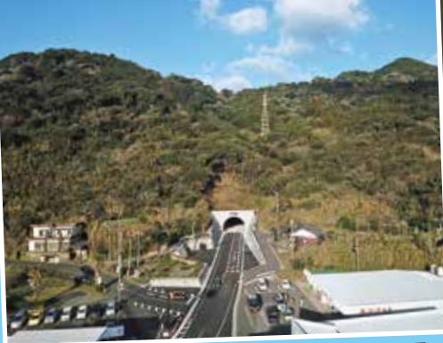
伊座敷からのトンネル開通前全景