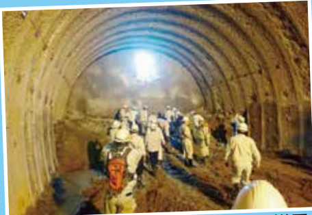
トンネル内掘削の様子