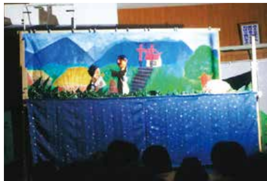
令和元年度実施「塩入人形劇団ウイング」

※令和元年度は、佐多岬コンシェルジュの案内活動用アロハシャツ・ジャケット、ホテル佐多岬での芸能人朗読会、塩入人形劇団ウイング等に活用されました。