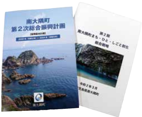
総合振興計画・総合戦略

第2次総合振興計画後期計画に基づき、「暮らす・働く・もてなす・癒す」、新たな視点から少子高齢化、人口減少社会に適応したまちづくりを進めます。光回線未整備の辺田局、辺塚局の地域内格差解消と、デジタルトランスフォーメーションが進み、自治体間の広域的な取り組みや、「共創」による民間事業者等との先進的な取り組みについて事業を進めます。定住促進対策については、4戸となったお試し住宅を活用する移住体験ツアーや、移住検討のための旅費や移住後の家賃、定住促進住宅取得資金補助金など助成制度を継続し、空き家・空き地バンクへの登録の促進を図りながら、家屋情報を提供し、町内外からの移住・定住が図られるよう、ブロンズ人材センターと連携し、取り組んでまいります。