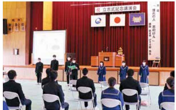
立志の誓いを発表する第一佐多中2年生