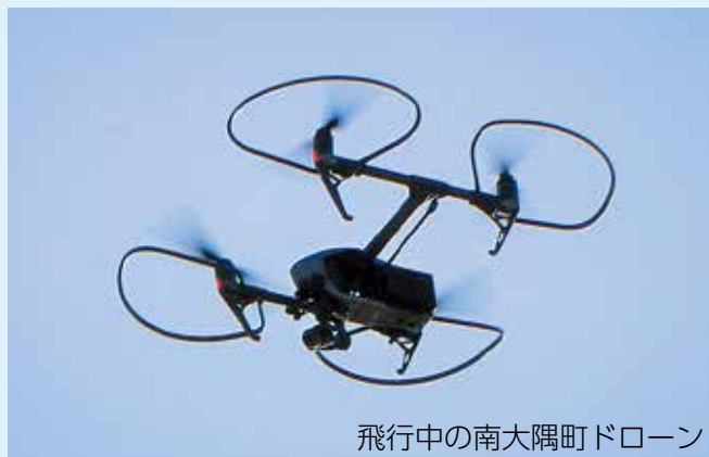
飛行中の南大隅町ドローン