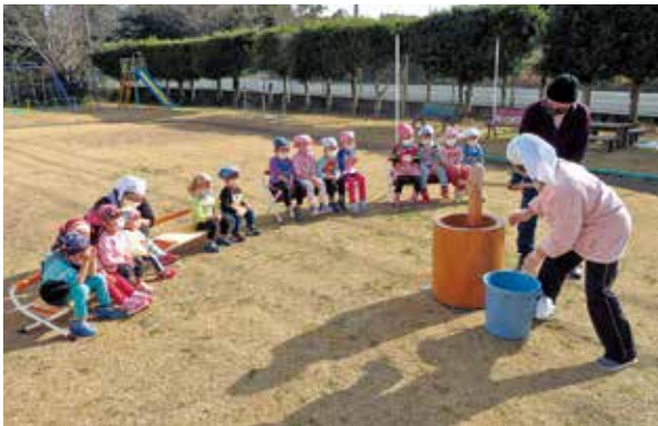
餅つきを楽しむ園児たち

また、1月16日は、新春を祝う「餅つき」と「凧あげ」を行いました。今年は、園児たちだけで実施することになりましたが、餅つきでは、『よししょ！』と園児たちの大きなかけ声が園庭に響いていました。園児16人と職員で伝承遊びともいわれる凧あげで元気よく園庭を走り回りました。