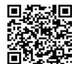
大隅肝属地区消防組合 ホームページ