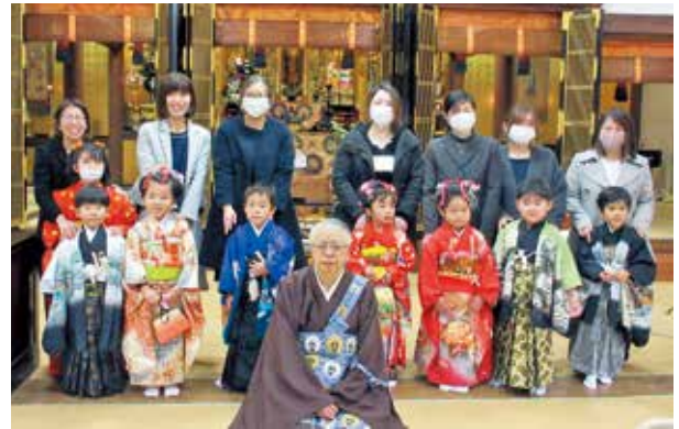
七草を祝う園児たち