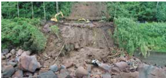
錦江町城ヶ崎の土砂崩れに押し潰された自動車

昨年の台風10号は、猛烈な勢力のまま九州南部に接近すると予報され、枕崎台風（昭和20年）や伊勢湾台風（昭和34年）に匹敵すると言われました。