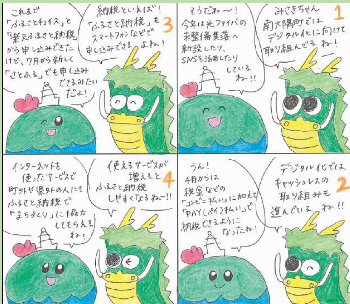
■問い合わせ先 役場 企画課 Tel 24-3113 絵 有木円美 (地域おこし協力隊 OG)

4コマ漫画の企画内容は担当課や広報担当が作成し、漫画の絵を地域おこし協力隊 OG の有木円美さんに担当していただいています。