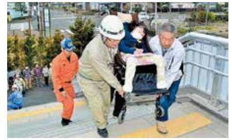
全国的に避難誘導・避難所運営は、自主防災組織（＝地区住民）が主体

危険が迫っている状況では、その地域を担当する消防団も避難誘導にあたりますが、消火・救助活動などのため消防団員が誘導に従事できない場合もあります。自主防災組織が主体となって、避難の誘導・支援をお願いします。