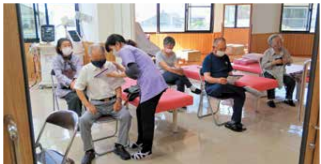
佐多診療所ワクチン接種会場