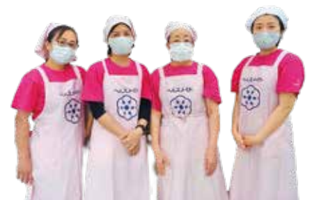
食改さん(町食生活改善推進員)