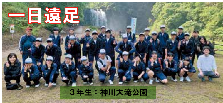
3年生：神川大滝公園