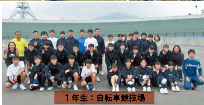
1年生：自転車競技場

4月30日(金)一日遠足がありました。生徒たちは交流を深め、楽しい時間を過ごすことができました。