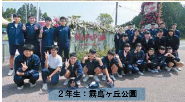
2年生：霧島ヶ丘公園