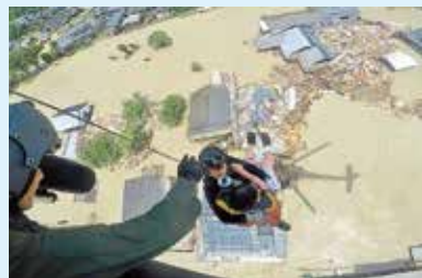
洪水で孤立した家屋からの自衛隊ヘリによる救助

西日本豪雨の際、家に残り残されたり車が動けなくなったりして、110番や119番に救助要請が何千件と来たそうです。当然、警察や消防の手が足りるはずがありませんし、豪雨の中では現場へ行くことすらできません。役場・市役所も電話はパンクし状況がつかめず、当然、災害対応は滞ってしまう結果になりました。そして、命からがら助かった人たちは、「まさかこんなになるなんて。自分だけは大丈夫だろうと思った。」と取材に答えるんですね。人によっては、「もしも、何もなかったら、どうしてくれるんだ。」と言われる人が必ずいらっしゃいます。その時の私の答えはひとつ「よかったですね、何もなくて。笑えるのも怒れるのも、何もなかったからですよ。」です。今月号の『防災特集』を読んで、「もしも」に備えてください。お願いしま～す。さぁコーヒータイム！