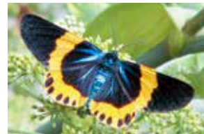
キオビエダシヤクの成虫