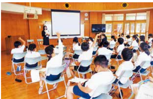
神山小学校での租税教室

5月20日、税に対する関心・理解を深めてもらうため、神山小学校で租税教室が開催されました。役場税務課職員が講師となり「税金がなくなった世界はどうなるのか」といった内容のビデオ鑑賞や税金クイズなどを通して、税への理解・関心を深めてもらうことができました。税金に関するたくさんの質問があり、租税教室で、税金の役割を知り関心をもつ機会になりました。