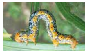
キオビエダシヤクの幼虫