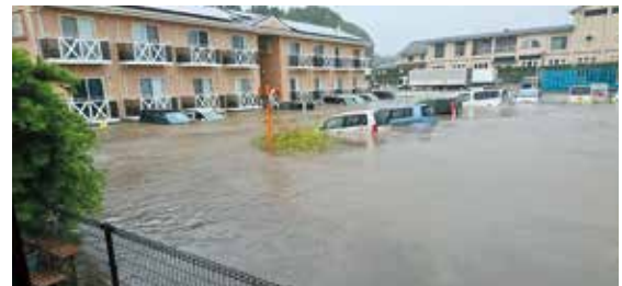
鹿屋市内の記録的豪雨による浸水

南大隅町でも、近年雨量は増加傾向にあり、いつ大規模な土砂災害や河川氾濫が発生してもおかしくない気象環境になっています。