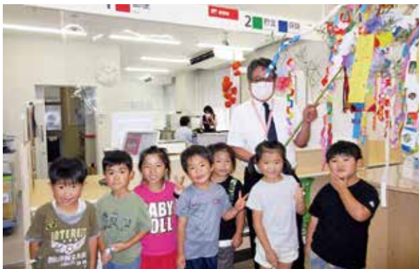
佐多郵便局へ七夕飾りを届けた園児たち