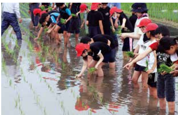
昔ながらの田植えを体験する児童

児童は、農業委員の方々から指導を受けながら、自分たちで種まきを行い大切に育てた苗を丁寧に手作業で植えました。