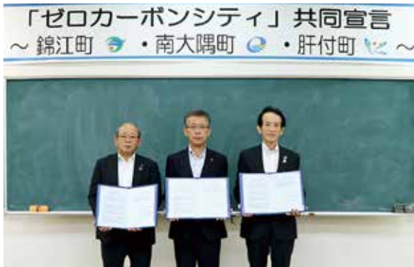
共同宣言書にサインした肝属郡3町長

3町では、公共交通を地域の共同課題として連携事業を行ってきました。宣言により2050年にむけて3町が連携し、地球温暖化対策に取り組むことで各自治体の特性を活かした「ゼロカーボンシティ」の実現と地域活性化に取り組みます。