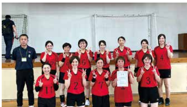
優勝した女子バレーの皆さん