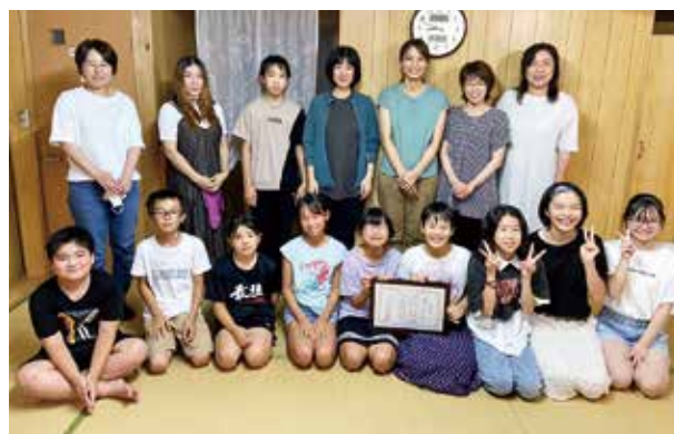
丸峯子ども会の皆さん

丸峯子ども会は、地域と連携した活動を積極的に行い、地域振興に大きく貢献してきた団体として活動が評価され受賞されました。とりわけ、親から子へと受け継がれてきた約50年以上続く「朝の本読み放送」の活動は、地域と一体となった自慢の取り組みであり伝統ともなっています。