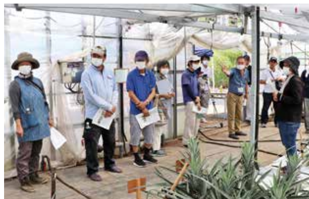
熱帯果樹施設内でのパインアップル研修会