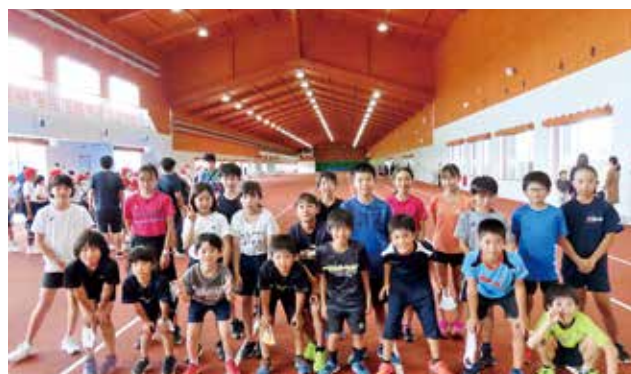
陸上競技に参加された皆さん