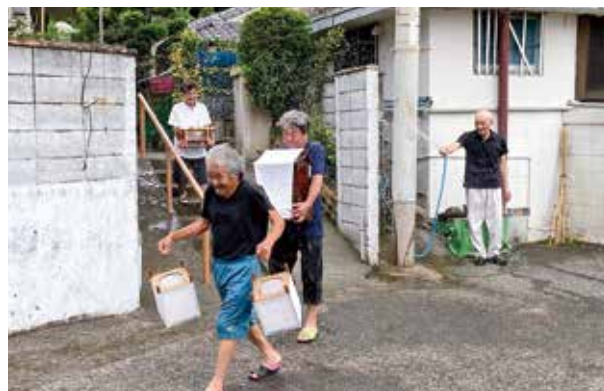
ご神体を運ぶ集落の人たち