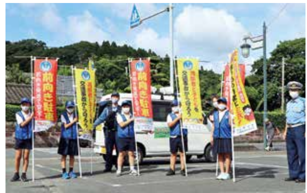
なんぐう交通・防犯少年団の神山小学校児童