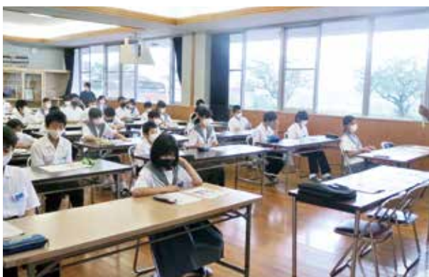
根占中学校での租税教室

講師は役場税務課職員が務め、固定資産税や消費税について、クイズを交えた授業を行いました。生徒たちは「身の回りにたくさんの税金があることを知った。」「税金の大切さをとても理解できました。」と話してくれました。