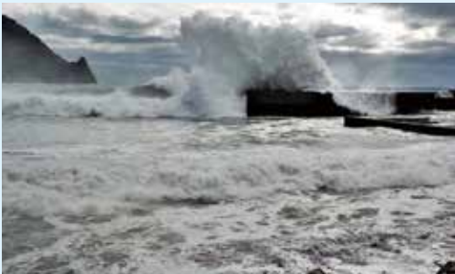
台風による波濤 (辺塚漁港)

今でも、夏の暑い日、蟬時雨を聞くと、その時の台風一過の光景が脳裏に蘇ります。当時は、まだ小学生なので本場の台風の恐ろしさなど理解もせず、ただ好奇心だけで見ていました。親父が爺さんと一緒に雨戸を固定したり、屋根にロープをかけたりと、忙しく準備をしていたことを思い出すようになったのは、最近になってからです。忙しく段取りをする親父の足下をチョロチョロとついて回り、邪魔をしては怒鳴られる自分の姿が滑稽そのものです。当時は、台風の予報精度も今ほど高くはなく、1、2日前にならないうと、勢力もコースもはっきりしない時代でした。私の実家は、木造築百年のいわゆる古民家です。数年に一度は強い台風襲われ、家のそこそこが小さな被害に合っていました。が、今でもなんとか建っています。頑丈な避難所（小学校は木造でした）などなく、避難という概念すら無いに等しい時代に、親父や爺さん達が、できうる限りの努力で台風と向き合ってきた、備えてきた賜だと思えます。