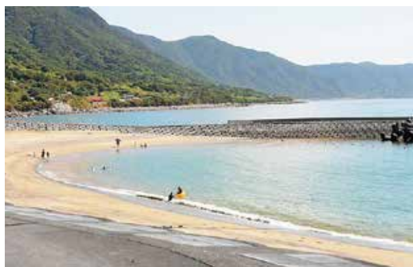
海水浴を楽しむ利用者