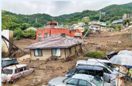
静岡県伊豆山土石流による想定外の被害 (令和3年7月、国交省撮影)

ある高齢の一人暮らしの女性が、『高齢者等避難』が出たら必ず避難していた結果、西日本豪雨（平成30年7月豪雨）で、避難したあとに家が2階の天井まで浸水してしまったという実例があります。これこそ、空振りを恐れず行動した結果、命を守ることができた典型例です。逆に、避難に関する情報が発令されているにも関わらず、これまでこの辺は大丈夫だったから、どうせ今回もそんなにひどくないだろうと、高をくくって避難をしなかったため、水没しかけた家の屋根の上で救助されたり、土砂に押し潰された家の中から無残な姿で発見されたり、というような避難の機会を見逃した例は数え切れないくらいあります。