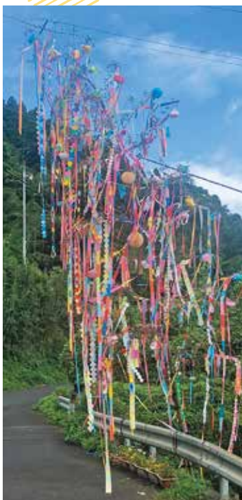
最優秀賞の浮津自治会

旧暦の七夕、8月に佐多校区民会の七夕コンクールが開催されました。 今年も14自治会が参加し、各自治会の公民館などに七夕飾りが設置されました。 審査の結果、最優秀賞が浮津自治会、優秀賞が瀬戸山自治会、3位が住宅自治会、特別賞が川田代自治会となりました。