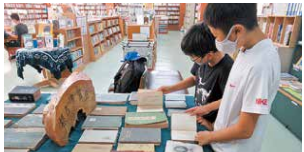
根占書籍館時代の本

ブックリサイクル、根占書籍館時代の本の展示、夏休みクイズラリー、ブックツリー「本の木を育てよう」など、いろいろな催しが行われました。根占図書館（前身は私立根占書籍館）は明治16年に創設され、今年で138周年を迎えました。読書に対する先人の思いを次世代につなぎ、図書館の新たな可能性に挑戦していきます。