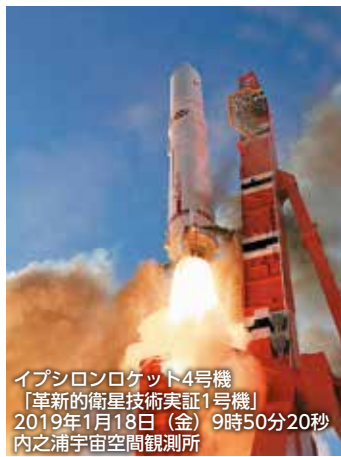
イpsilonロケット4号機 「革新的衛星技術実証1号機」 2019年1月18日（金）9時50分20秒 内之浦宇宙空間観測所