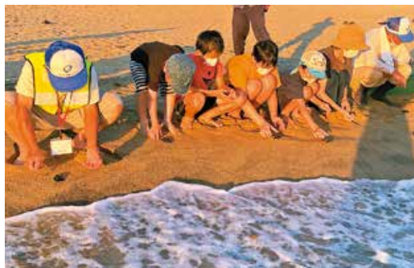
ウミガメの赤ちゃんを海へ放す参加者

渚を守る会は、ウミガメ放流会などを通じて自然環境保護に取り組んでいます。ウミガメの訪れるキレイな海を今後も守りましょう。