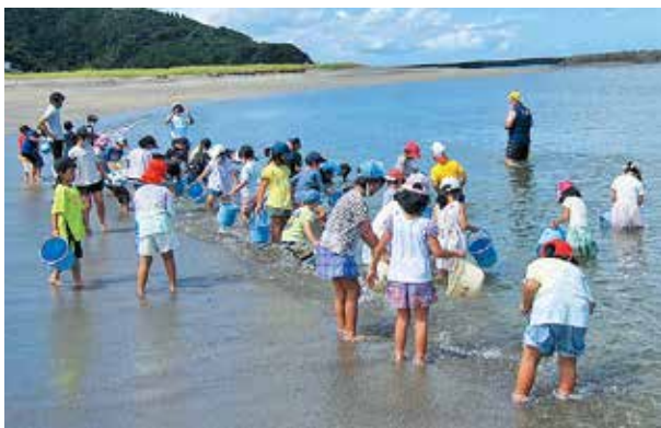
ヒラメの稚魚を放流する児童