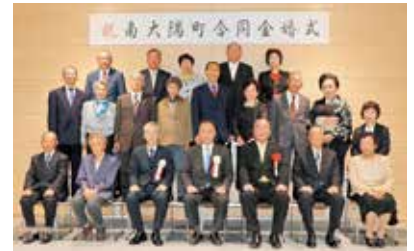
令和 2 年度の合同金婚式

対象者の方に事前の通知はありませんので、 対象であると思われる方は、本庁介護福祉課または、支所総務民生グループへ 10 月 22 日（金曜日） までに、ご連絡ください。