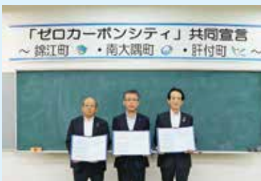
共同宣言書にサインした3町長

●ゼロカーボンシティとは、2050年にCO 2 （二酸化炭素）排出量を実質ゼロにすることを表明した自治体のことです。