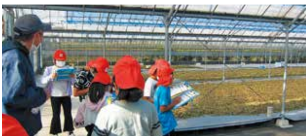
十津川農場で社会科見学をした神山小学校3年生

参加した児童からは「触ったりにおいを嗅いだり、とてもよい体験だった」や「びわ茶はいいにおい」などの感想が出され、身近な仕事として、南大隅町とのかかわりについて学ぶ貴重な学習になりました。