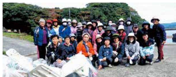
海岸清掃ボランティア参加者

当日は、根占港海岸（瀬脇地区）一帯の清掃を約1時間かけて行い、プラスチックなどの漂着ゴミを袋いっぱい回収しました。歴史講話も併せて行われ、清掃後は「自分たちの町は自分たちの手できれいにしていきたい。」といった声も聞かれました。この活動は地域のよさを改めて感じさせてくれました。住みよい町づくりの第一歩はこういう活動からはじまるのかもしれませんが。