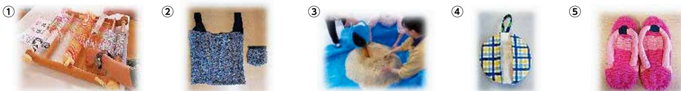
エコバッグとパッケンポーチ