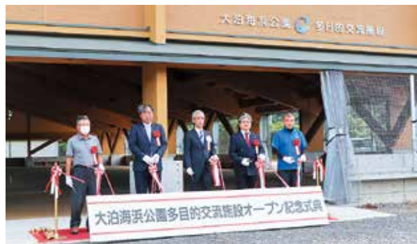
オープンを記念しテープカット

多目的交流施設は、ゲートボールなどのスポーツやレクリエーション、各種イベントなど幅広くご利用いただけます。