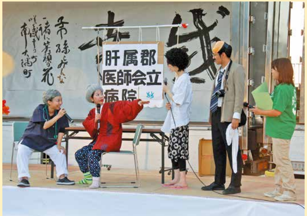
2015年8月1日、雄川フェスタにおいて行われた初公演。認知症の人やその家族に早期に関わり包括的に支援することを目的に、2013年、南大隅町認知症初期集中支援チームが発足。認知症に対する理解を深めてほしいとの思いから、肝属郡医師会立病院、町包括支援センター、町社会福祉協議会、町役場職員により「南の星座」はスタートしました。

認知症患者は全国に600万人以上とされ、その割合は高齢者の6人に1人。2025年には730万人を超え、近い将来高齢者の5人に1人が認知症になると予測されています。