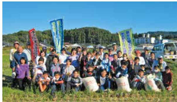
収穫した米を手にする神山小学校5年生

児童は、農業委員の方々から指導を受けながら、種まきから収穫までの米作り体験を通じて、農業への親しみや理解を深めることができました。