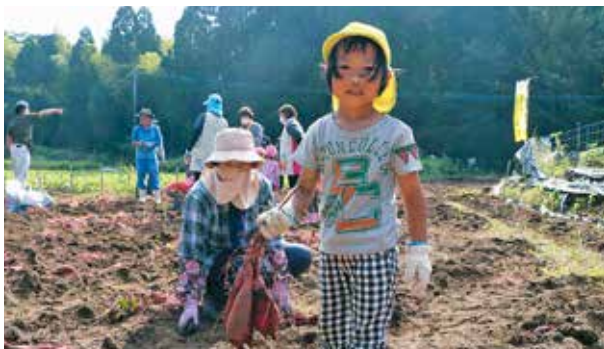
芋掘りをする園児とシルバー人材センター会員

園児たちは、会員に教えてもらいながら、サツマイモをたくさん手にして大喜びでした。園児からの「一緒にやりましょう」の言葉に、笑顔あふれる活動となりました。