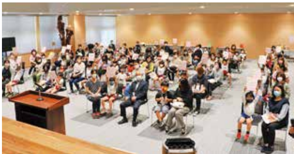
贈呈された本を手にする子どもたち

子どもたちに読書習慣をつけるきっかけになるよう、おすすめ絵本の中から2冊を親子で一緒に選んでいただき、就学時健診の「子育て講座」において贈呈。子ども自身が「本を選ぶ楽しさ」「読む楽しさ」を知るきっかけをつくることで、自発的な読書につながることを目指します。