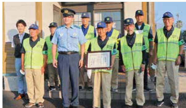
表彰を受けた隊員の皆さん

平成22年に設立されたボランティア団体であり、隊員11人が交通立哨や通学路のパトロール、児童の登校見守り活動、青色回転灯を点灯した車両によるパトロール等の防犯活動を実施されています。日頃の防犯活動に感謝いたします。