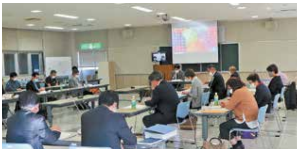
第3回肝属郡医師会立病院再整備基本計画策定委員会

年内としていた基本計画の策定期間は来年3月に、新病院の開院時期は令和7年4月以降に延期することとなりました。