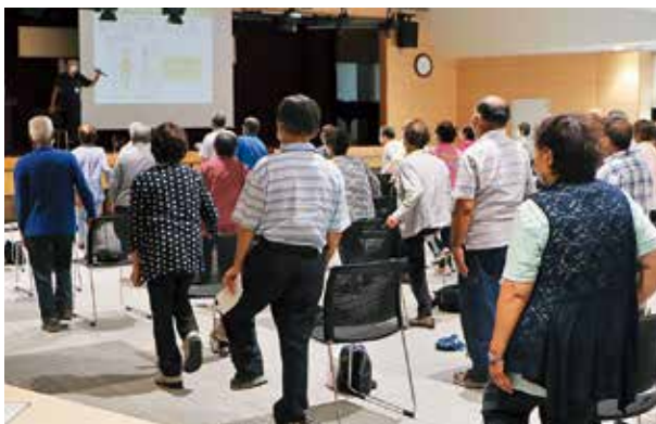
予防トレーニングを体験する参加者

講演会終了後は、みなと公園でグラウンドゴルフ大会も開催され、会員の交流が図られました。