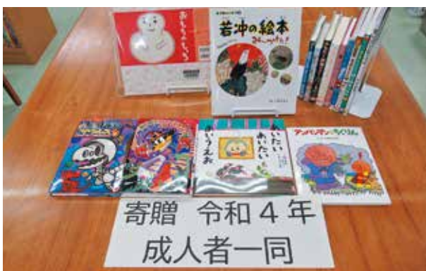
寄贈いただいた児童書