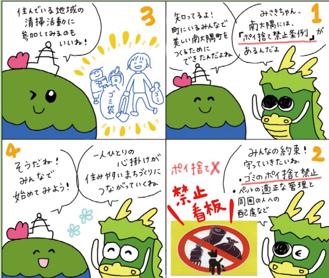
■問い合わせ先 町民保健課 Tel 24-3125 絵 有木円美 (地域おこし協力隊OG) 4コマ漫画の企画内容は担当課や広報担当が作成し、漫画の絵を地域おこし協力隊OGの有木円美さんに担当していただいています。