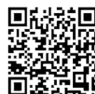
厚生労働省 ホームページ

効果や副反応 小児接種の必要性や副反応についての情報は、厚生労働省のホームページもしくは、日本小児科学会ホームページに詳しく記載してありますのでご覧ください。