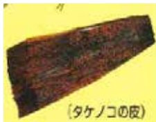
タケノコの皮あくまきの皮