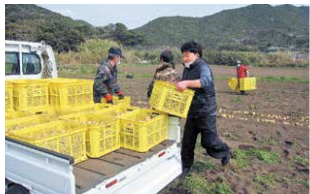
大泊地区の圃場での様子

今後も、担い手不足や高齢者による労働力低下を少しでも解消するため、町やJA鹿児島きもつき農協・白鳩会と連携しながら、農福連携事業を推進していきます。