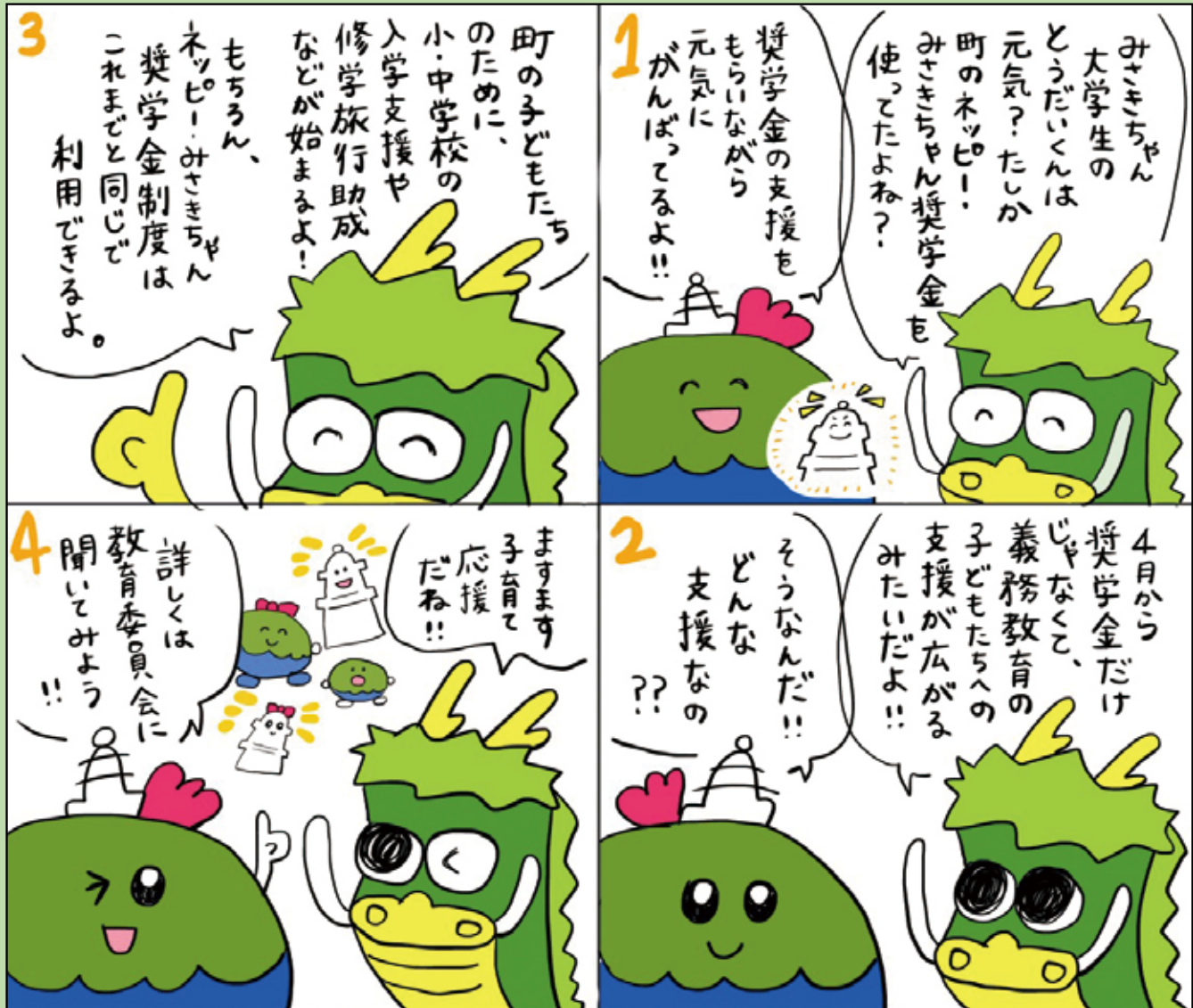
■問い合わせ先 教育委員会 Tel 24-3143 絵 有木円美（地域おこし協力隊OG） 4コマ漫画の企画内容は担当課や広報担当が作成し、漫画の絵を地域おこし協力隊OGの有木円美さんに担当していただいています。