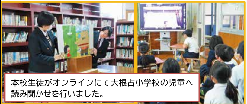
本校生徒がオンラインにて大根占小学校の児童へ読み聞かせを行いました。