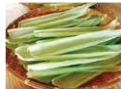
トウモロコシの皮