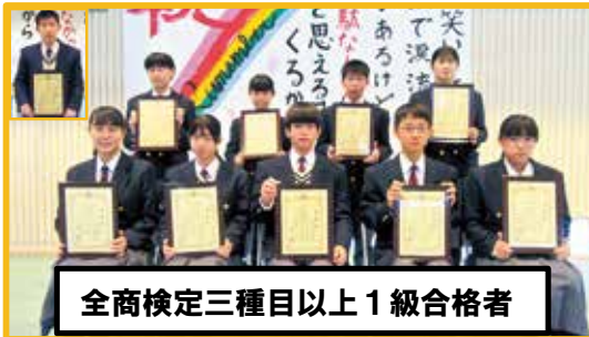
全商検定三種目以上1級合格者

▼3年生 28名が南大隅高校を卒業しました。これから様々な場所で卒業生が輝いていくことを期待しています。