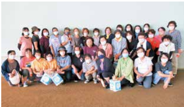
グラウンドゴルフで交流を深めた参加者

町地域女性会連絡協議会では、会員相互の親睦を深め、健康づくりを目的に、8月28日、根占ふれあいドームにおいて「第13回グラウンドゴルフ大会」を開催しました。会員35人が賑やかに集い、随所に好プレーも見られました。参加者からは、「ホールポストを狙って打っても、なかなか思うようにいかないが楽しかった。」という声も聞かれ、みんなで和気あいあいと、笑顔と笑い声のあふれる大会になりました。