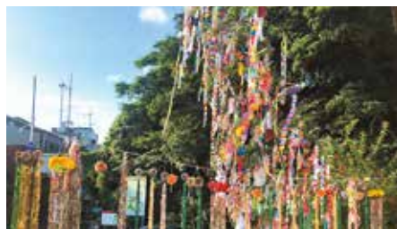
優秀賞 浜下自治会