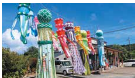
大浜郵便局に展示された仙台の七夕飾り