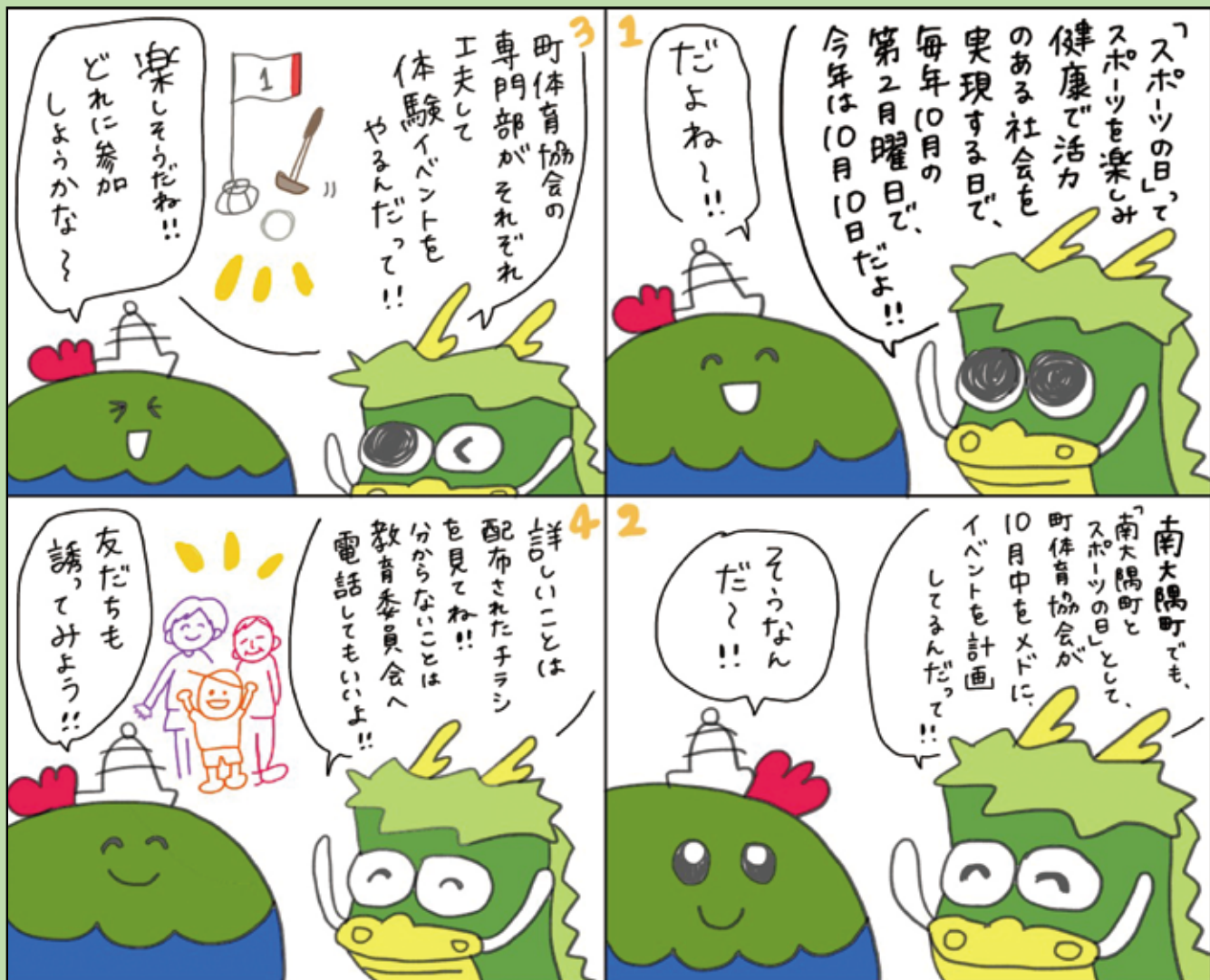
■問い合わせ先 教育委員会 Tel 24-3164 絵 有木円美 (地域おこし協力隊OG) 4コマ漫画の企画内容は担当課や広報担当が作成し、漫画の絵を地域おこし協力隊OGの有木円美さんに担当していただいています。