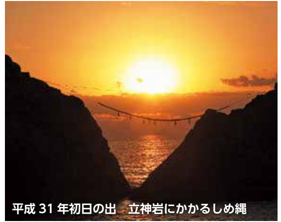
平成31年初日の出 立神岩にかかるしめ縄

平成31年から立神岩へのしめ縄設置の取組を始め、南日本新聞に取り上げられるなど、地域の活性化につながっています。