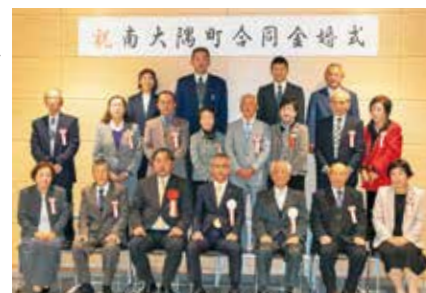
令和 3 年度 合同金婚式

※詳細につきましては、新型コロナウイルス感染症の状況を見て、開催日を後日対象者にご連絡いたします。