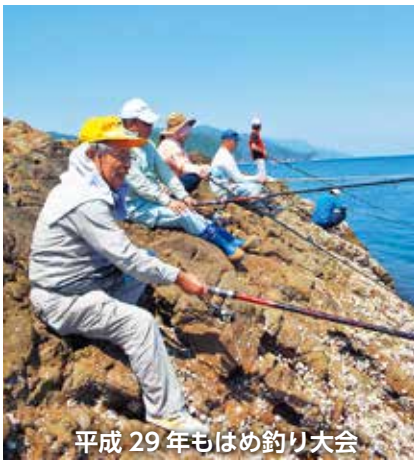
平成29年もはめ釣り大会

「できることを、できる限りでいい。例えば、十五夜を前のように賑やかにできないが、お月様へのお供えだけでも。一度やめてしまおうと始めることは難しい。近所隣、つながりがあるから、声かけ、気掛けが自然と出てくる。」