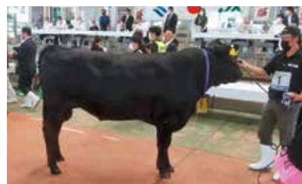
しらき系種雄牛 白浜喜号