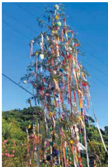
最優秀賞 浮津自治会