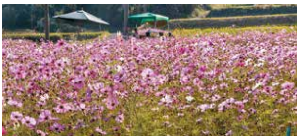
松之迫のコスモス畑