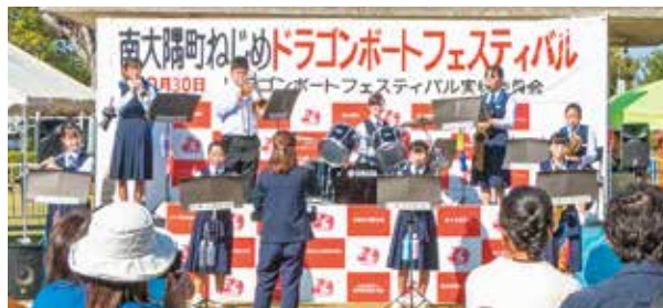
根占中学校音楽部