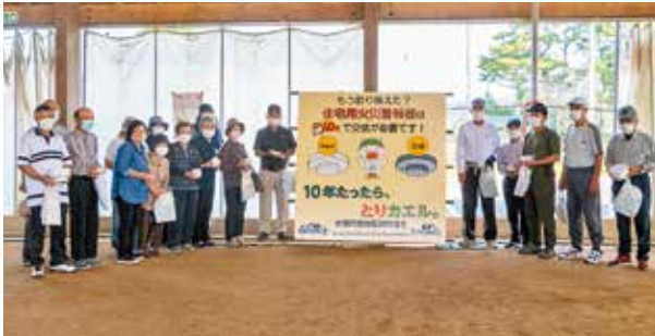
住宅用火災警報器を手にする参加者

会場では車両展示も行われ、はしご車の体験には、子どもたちや親子での参加もみられました。