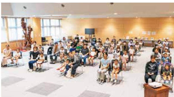
贈呈された本を手にする子どもたち

子どもたちに読書習慣をつけるきっかけになるよう、おすすめ絵本の中から2冊を親子で一緒に選んでいただき、就学时健診時の「子育て講座」において贈呈。子ども自身が「本を選ぶ楽しさ」「読む楽しさ」を知るきっかけをつくることで自発的な読書につながることを目指します。