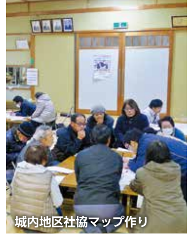
城内地区社協マップ作り

地区社協は、地域のみんなで話し合い、問題や課題を協力して解決を図ることを目的とし設置されています。城内地区では平成29年度から地区社協の活動を開始。自治会ごと地域の人をまとめた