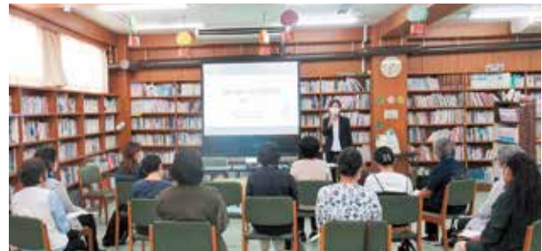
朗読を学ぶ参加者

「聞いた人がイメージできるのが朗読」であり、滑舌・アクセント・間・抑揚などいろいろな技術が合わさった中でも、聞き手がイメージするための“間”が大切と話され、受講者からは「美しい文章や言葉に寄り添った朗読を届けたい。」などの感想が寄せられました。