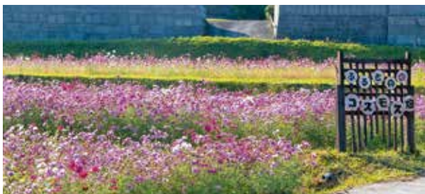
古殿のコスモス畑