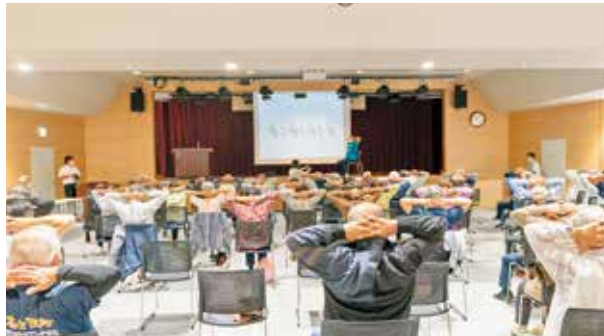
シルバーリハビリ体操を体験する参加者

講演会修了後は、みなと公園でグラウンドゴルフ大会も開催され、会員の交流が図られました。