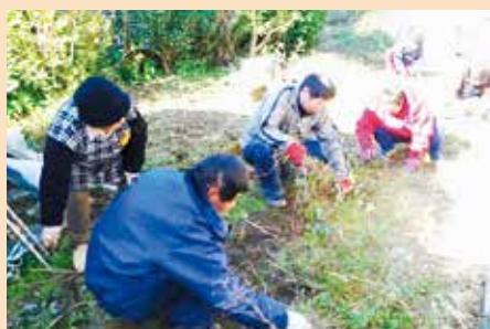
生活支援ボランティア活動