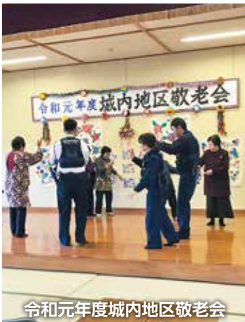
令和元年度城内地区敬老会

地区で集まることで、なかなか会う機会がない方々が顔を合わせて語り合う。「久しぶり、元気やっとな」の声、歌や踊り、最後のハシヤ節では、会場はいっぱいなので、その場で立って踊って。にぎやかな声と笑顔にあふれていたそうです。