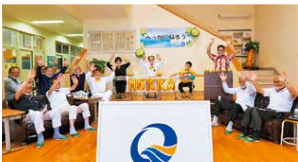
オンラインイベントの様子

終始和やかな雰囲気で行われたイベントには、辺塚に縁のある方々からたくさんのメッセージが届いていました。