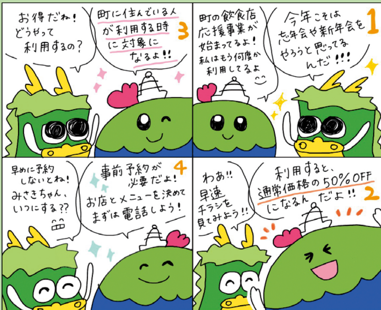
■問い合わせ先 商工観光課 Tel 24-3115 絵 有木円美（地域おこし協力隊OG） 4コマ漫画の企画内容は担当課や広報担当が作成し、漫画の絵を地域おこし協力隊OGの有木円美さんに担当していただいています。