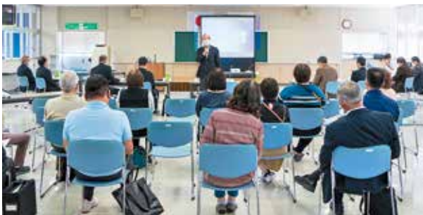
肝属郡医師会立病院 再整備基本設計公募型プロポーザル審査委員会

10月30日、錦江町文化センターにおいて二次審査が行われ、4事業者によるプレゼンテーション及びヒアリングが、医師会関係者、錦江町及び南大隅町の町民を対象に公開で行われました。審査の結果、最優秀者及び優秀者（次点者）が決定されました。