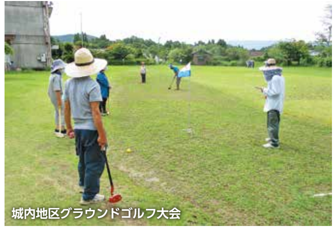
城内地区グラウンドゴルフ大会

最近では、人口減少と高齢化により、掃除をできる人が少なくなってきたことと、今後の活動の継続が課題と話されます。