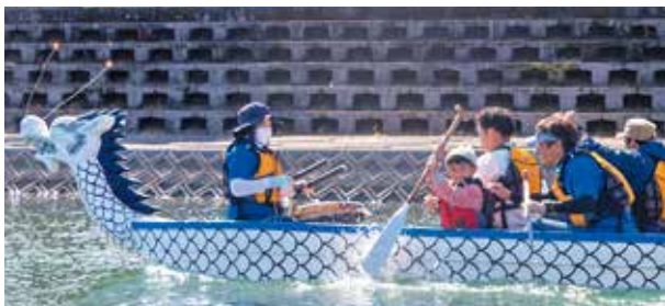
ドラゴンボート体験

3年ぶりの開催となった今年は規模を縮小し、青空市とドラゴンボート体験が行われました。秋空の下、ドラゴンボートを親子で漕ぐなど、通常のレースではできない体験となりました。