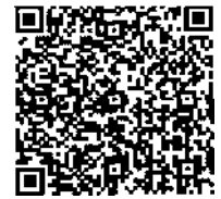
インボイス制度 特設サイト

制度の概要の他に説明会の開催情報や申請手続などを掲載しています。 「国税庁適格請求書発行事業者公表サイト」へのリンクもご案内しています。