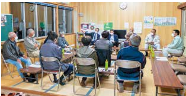
野尻野自治会で開催された出前町政座談会

町では喜んでいただけるまちづくりを目指し、町民の皆さんのご意見、ご提案をお待ちしています。