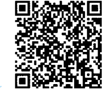
チャットボットは こちらから