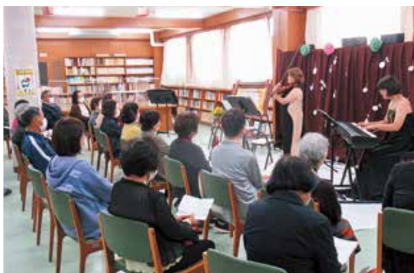
優しい音色に聞き入る参加者

参加者は、バイオリンとピアノの優しい調べに聴き入り、地域に身近な場所である図書館で、デュオの音色が響き渡る非日常を楽しみました。