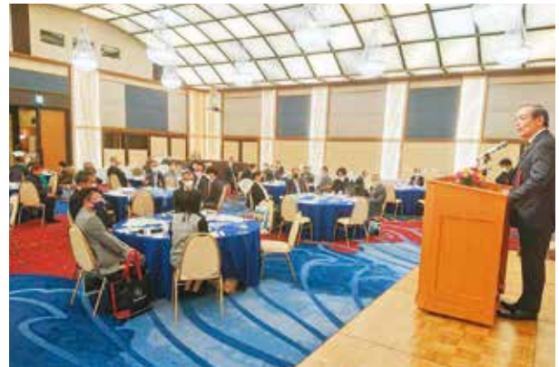
関東南大隅会総会

今回の総会において、町政発展のため関東南大隅会から貴重な寄附金をいただきました。