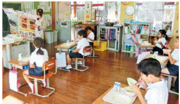
ねじめ黄金カンパチの照焼を食べる児童たち

食に関する正しい知識と望ましい食習慣を身につけることができるよう、学校教育においては給食の地場産物の活用を推進しています。