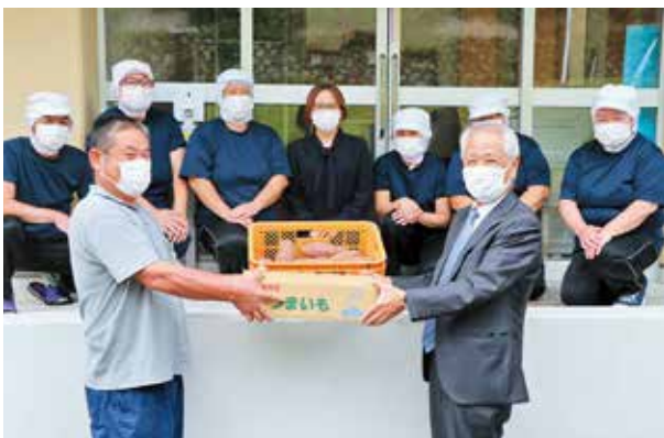
シルバー人材センターから教育長へ寄贈

寄贈は2016年から継続している取り組みで、町給食センターは、芋ご飯、ケーキなど児童生徒が喜ぶ献立で出されます。