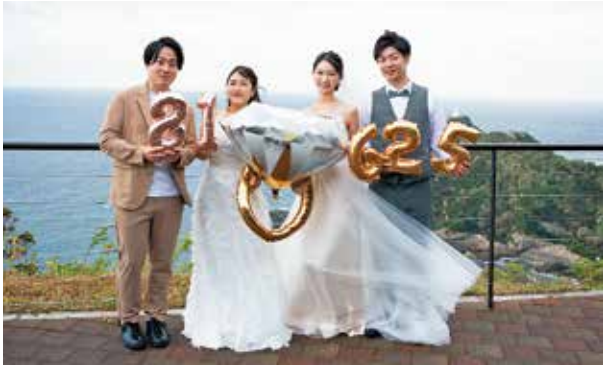
佐多岬でフォトウエディングに参加したカップル

一生の思い出づくりを南大隅町で体験し、地域のファンになっていただき、本町の魅力を発信することを目的に、町の観光地を舞台に、新型コロナウイルス感染症の影響などにより結婚式ができないカップルなどが対象。学生時代、関西地区で南大隅町 Deep Trip Ambassador (アンバサダー) を務めたゆかりのある2組が参加しました。