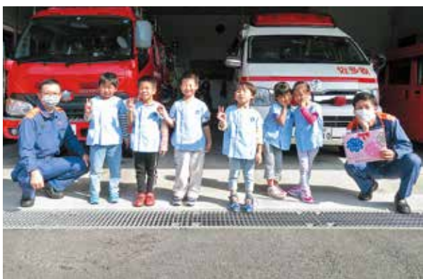
南部消防署佐多分署へカレンダーを届けた園児たち

いつも働いている事業所の方々へ「いつもありがとう」の感謝の気持ちを込めて手作りされたカレンダーを園児が手渡すと、事業所の方々も笑顔になりました。