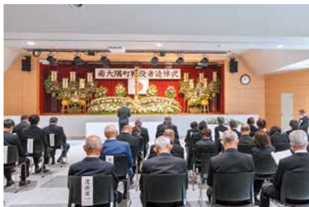
追悼のこたばを捧げる遺族会会長