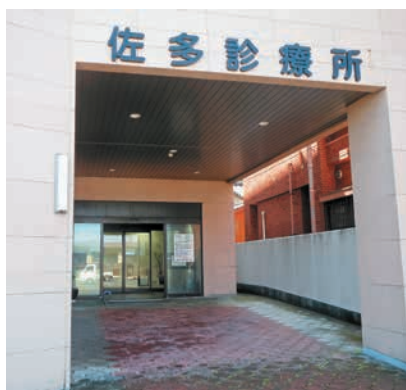
診療所 (佐多診療所)

入ってもらい頑張っていたきたい。いつまでも治療ができると安心して行ける場所が欲しくなる時が来ると思う。