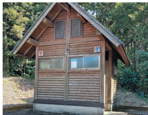
パノラマパーク西原台トイレ

西原台のトイレは、建設から20年経過しております。当初は林業従事者用の休憩用トイレ