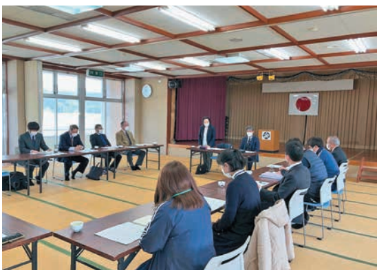
社会福祉協議会の概要等調査

訪問介護事業は、在宅で介護を受ける人には必要不可欠である。社会福祉協議会の訪問介護事業所を統合する案を、行政が間に入り、各事業所の考えを聞き、取りまとめて良い方向になるよう要望します。