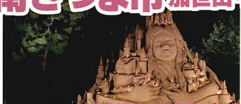
吹上浜砂の祭典(2024年5月3日~5日開催予定)