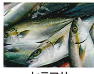
ヒラマサ 写真は販売商品の一例です

錦江町は、北に桜島、西に開聞岳を一望できる神川海岸や西日本最大級の照葉樹林が広がる稲尾岳がある町です。ヒラマサやお茶、肝属山系から湧き出る冷水を利用した特産品をはじめ、地域資源を活かした春の「花瀬公園まつり」や夏の「やまんなか音楽会」、冬の「大根やぐらライトアップ」など年間を通して様々なイベントを開催しています。