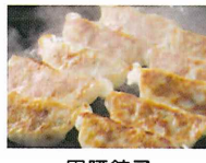
黒豚餃子 写真は販売商品の一例です

南さつま市は、日本三大砂丘の吹上浜と、リアス式海岸が美しい坊野間県立自然公園や珍しい渡り鳥の飛来で有名な万の瀬川河口などの豊かな自然の他、鑑真大和上上陸にみる歴史や神話・伝説など文化的にも特筆される資源に恵まれたまちです。南さつまの恵まれた大地と黒潮踊る東シナ海から生まれる新鮮な食材は、食通をうならせる素晴らしいものがあります。