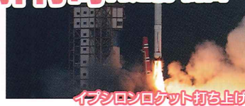
イプシロンロケット打ち上げ