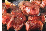
新村畜産サイコロステーキ 写真は販売商品の一例です

肝付町は、全国でも珍しいロケットの発射場があり、高山流籠馬やナゴシドンといった伝統を大切に紡ぐ町です。固体燃料ロケットイプシロンの打ち上げが行われている内之浦宇宙空間観測所は、敷地内の展望台から見る大きなパラボラアンテナや眼下に広がる景色も絶景(見学無料)。他にも食や古墳といった魅力が盛りだくさんの肝付町を、ぜひのんびりと味わってほしい。