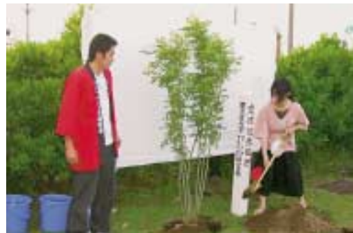
▶ 東南アジア原産 シマトネリコの植樹