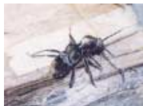
ケブカトラカミキリ成虫

これは「ケブカトラカミキリ」の幼虫による樹皮下への食害によるものです。幼虫は樹皮にもぐりこみ薬剤は効かないため、成虫を駆除します。駆除方法は、スミチオン70%乳剤を180倍に希釈し、動噴等で幹や枝にむらなく散布することです。なお、スミチオンは、農協や森林組合で取り扱っています。