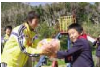
吹奏楽で歓迎する大泊小児童

3月6日に宗谷岬をスタートし、昼夜を問わず走り続け、3月19日の朝、ゴールである南大隅町に到着しました。到着後は大泊小学校の児童達がマーチングで迎え、選手やスタッフの感激もひとしおとなりました。