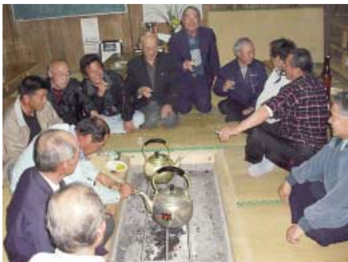
公民館に手作りの囲炉裏端で なごやかなムードの大野自治会総会

打詰自治会主催で毎年行われている、 稲尾岳登山終了後の酒向の様子。 遠くは、鹿児島市の山岳愛好家の方々 も参加しました。