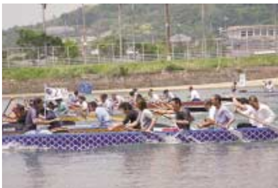
写真上：ジュニアの部優勝の 大中尾チームの子どもたち 写真下：白熱したレースの様子

みなみおおすみドラゴンボート大会 大中尾ジュニア初優勝 今回は、町内から四十四チームが参加し、 熱戦を展開しました。中でも、今回佐多地区 から参加した大中尾地区の子ども達がジュ ニアの部で初優勝を飾り、大会を盛り上げ ました。レースの結果は次のとおりです。 一般の部 優勝 今市自治会 2位 丸峯やろう会A 3位 中原自治会 レディースの部 優勝 丸峯レディース 2位 下園レディースB 3位 町二レディース ジュニアの部 優勝 大中尾ジュニア 2位 滑川子ども会A 3位 町二子ども会A