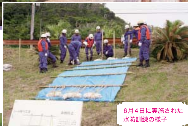
6月4日に実施された 水防訓練の様子

これから、夏にむけて短時間に集中して、雨が降る季節になります。本町もこれまでの歴史の中で、幾多の自然災害を受けてきました。近年、「天災は必ずやってくる」といわれています。日頃から災害に対しての備えに努めましょう。