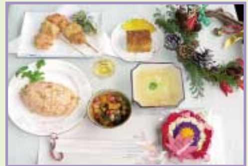
写真は洋風うからご膳“冬至”

今回はクリスマスも近いということで、食されたみなさん全員にスタッフの方が手作りされたクリスマスリースや毛糸で編んだたわしなどのプレゼントもありました。