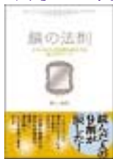
「鏡の法則」 著者：野口嘉則 出版社：総合法令出版