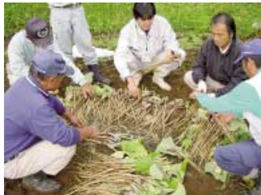
収穫・出荷検討会

かん水施設ほ場(国営畑かんほ場)に導入 畦立、マルチ、播種、掘取の機械化に取り組む。 栽培者が10名で230a、播種9月中～下旬、出荷が1月12日～3月上旬月